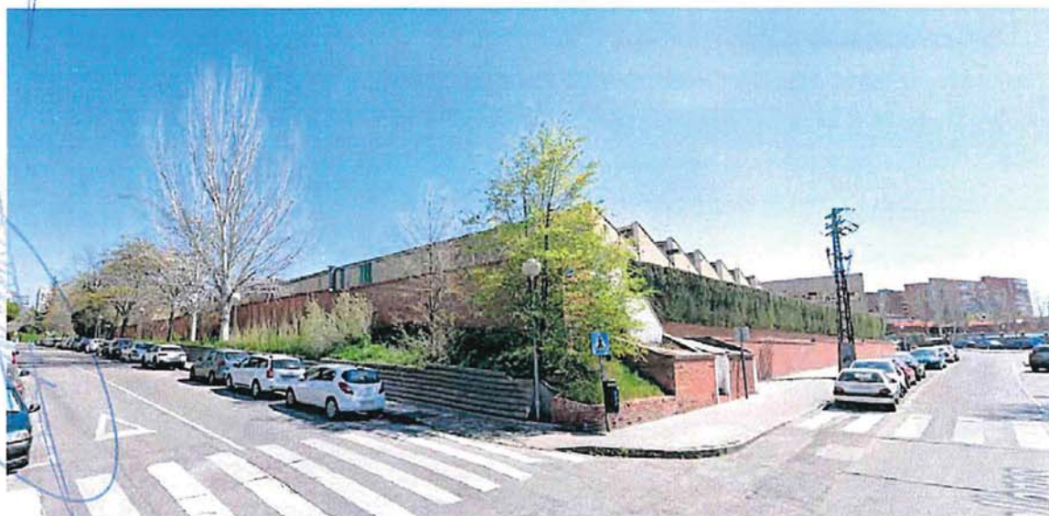
Calle Rubens esquina con Magallanes