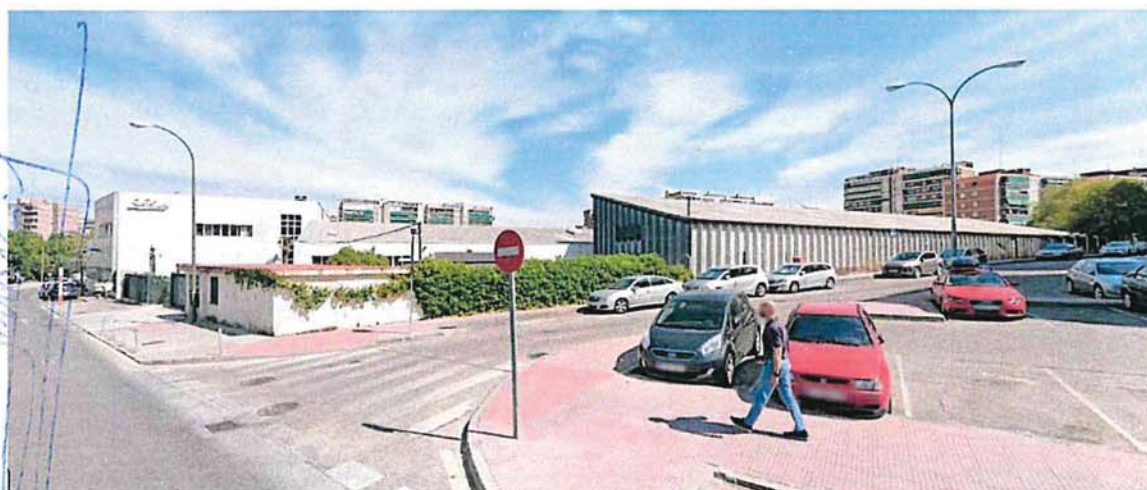
Calle Cid Campeador esquina con Rubens