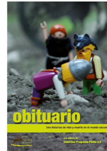
FIG 1 y 2. Programa Pintia. Cartel de la película Obituario. Tres historias de vida y muerte en el mundo vacceo y Trabajo con materiales originales vacceos en el Laboratorio de Arqueología. Autor: Pablo de Castro, 2013 y 2010.