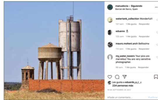
FIG 18 y 19. Patrimonio en conserva. Montaje de la exposición en FEYTS-Uva. Autora: Olaia Fontal, 2020.

La acción Patrimonio en Conserva (Marín, 2017; OEPE-UVa, 2018-2020) (FIG 17, 18 y 19). es un ejemplo de cómo introducir curricularmente el patrimonio en el aula sirviéndose de los vínculos entre los alumnos y sus bienes patrimoniales para construir artefactos y relatos en los que visibilizar esas relaciones. El resultado –más allá del intercambio surgido de las conversaciones en el laboratorio de educación plástica de la facultad– es una instalación de recipientes de cristal que contienen sus patrimonios íntimos. El proyecto tiene actualmente continuidad en Instagram (@patrimonioenconserva / #patrimonioenconserva).