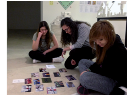
FIG 11 y 12. En [re]construcción. Montaje de la exposición y Tarjeta divulgativa de la exposición. Autor: Pablo de Castro, 2016.

#Souvenirs1936 (CSG, 2016-2020) es un proyecto estable en torno a la Guerra Civil Española, construido para alumnos de segundo de bachillerato, donde se dan cita los procesos tradicionales de investigación histórica junto a las metodologías de investigación basadas en las artes y las actividades de identización. Los participantes generan mate-