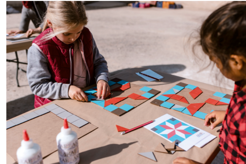
FIG 6. HA del castillo. Preparación del taller con ayuda de los participantes. Autor: ARAE, 2019.