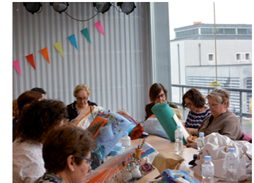
FIG 8. Distrito II. Demostración de encaje de bolillos. Autor: bit:LAV, 2018.

pleo del sistema de grupos de trabajo para el desarrollo de acciones de investigación que, bebiendo de las pedagogías críticas y la antropología –cultural, visual y etnográfica–, concluyen en interesantes reflexiones en formato audiovisual, donde la autoría casi siempre se diluye en el grupo y se concede la voz a miembros de colectivos o contextos en riesgo de exclusión social. Entre sus últimas producciones, Putá mina se convierte en una intensa indagación sobre el patrimonio íntimo de las mujeres mineras de la cuenca de Gordón, en el contexto de la desmantelación de su forma de vida al señalarse el inminente cierre de la mina.