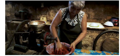
FIG 10. Cine Janal. Cita visual a la película El Tikin Xiik' Asado . Autor: Miguel Ventura, 2018.

tórico bajo la renovada denominación de Patrimonio Joven de Futuro , constituye uno de los mejores estímulos para que la educación patrimonial penetre en la escuela. Bajo el formato de un concurso, se convocaba para que escolares de ESO, Bachillerato y Formación Profesional abordasen el estudio de los bienes culturales castellanos y leoneses. Partiendo de un trabajo de documentación e investigación sobre un BIC declarado –o en vías de serlo–, el programa obtenía estupendos y complejos artefactos educativos que presentaban muy poliédricamente los elementos patrimoniales, analizando su estado actual de conservación y aportando soluciones para garantizar su sostenibilidad futura mediante propuestas de conservación integrada que lo convirtieran en un elemento de referencia para su comunidad de acogida. Los procesos de identización jugaban un papel fundamental en el proceso de trabajo, como también la resolución de las conclusiones empleando propuestas de investigación basadas en las artes.