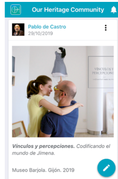
FIG 15. Recuerdos prestados. Cita visual a la pieza de Silvia Orive. 2020.