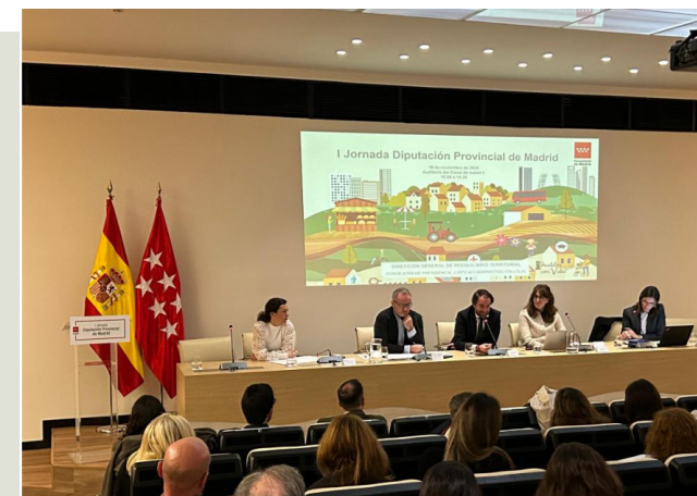
19/11/2025. I Jornada sobre las Funciones de Diputación Provincial de la Comunidad de Madrid

La I Jornada sobre las Funciones de la Diputación Provincial de la Comunidad de Madrid, celebrada el 19 de noviembre de 2025, destacó el papel del gobierno regional al asumir competencias propias de diputación, enfocándose en el reequilibrio territorial, el refuerzo de servicios municipales y la atención ciudadana.