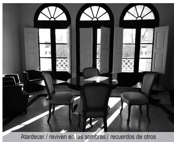
Atardecer / reviven en las sombras / recuerdos de otros