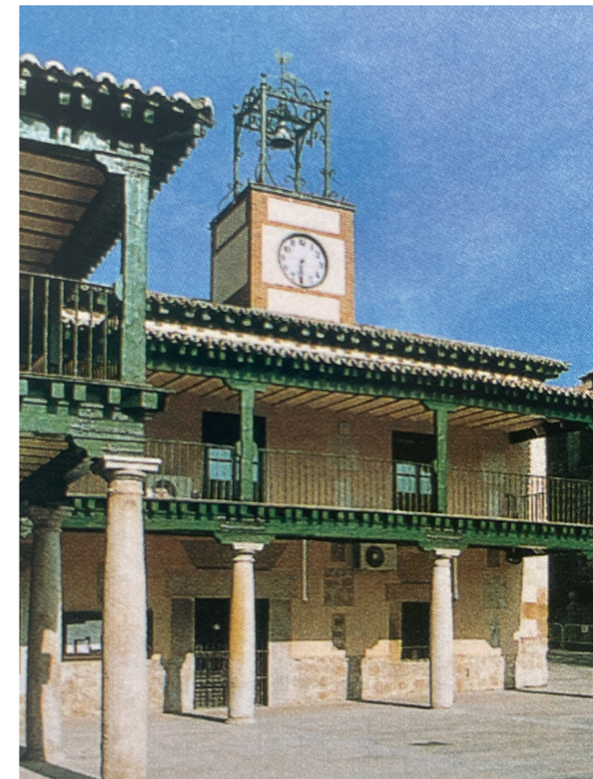
Ayuntamiento 1997-1998.