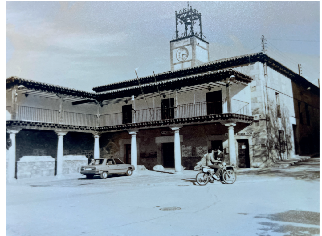
Ayuntamiento. En: Información, clasificación y normativa para los cascos antiguos de la zona Suroeste del ámbito de la Comunidad de Madrid, 1984.