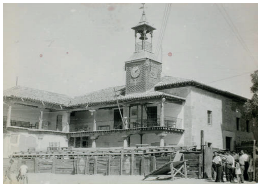
Cierre de la plaza para las fiestas, 1940.