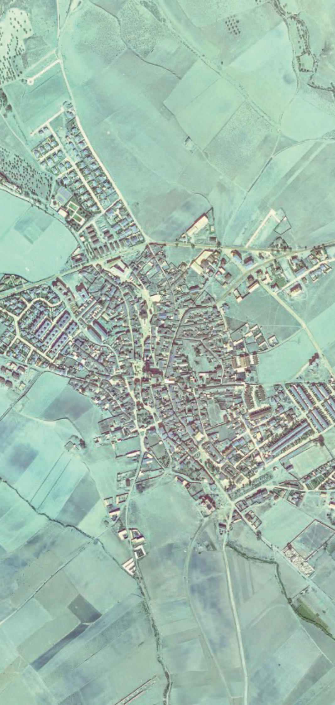
VILLA DEL PRADO EN 1980.