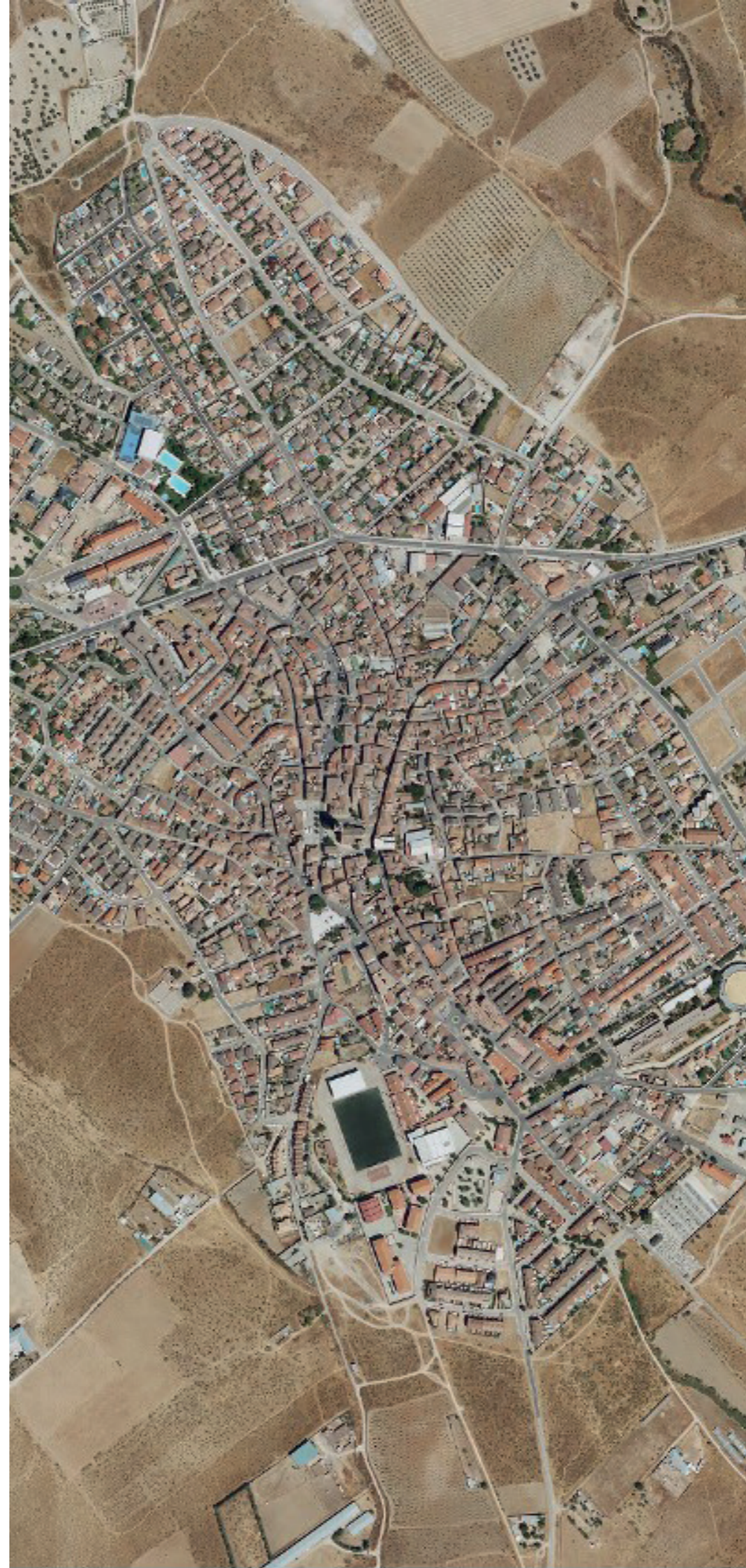
VILLA DEL PRADO EN 2022.