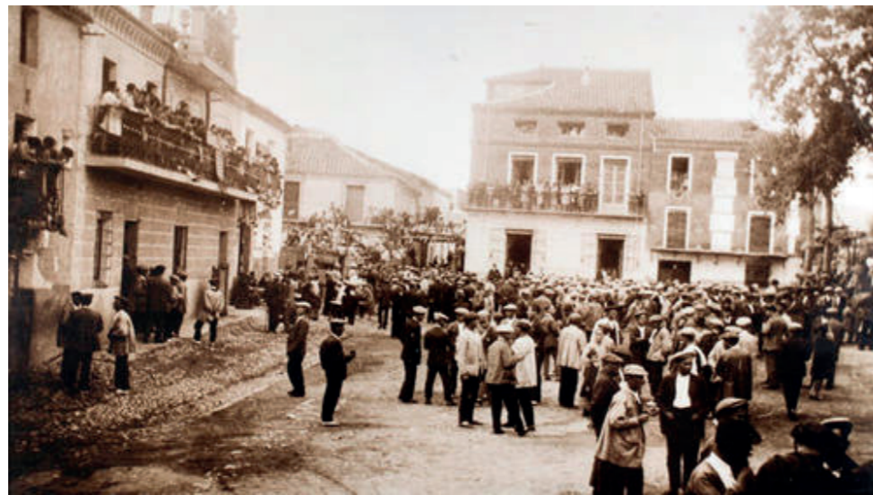
Fiestas patronales, 1910.