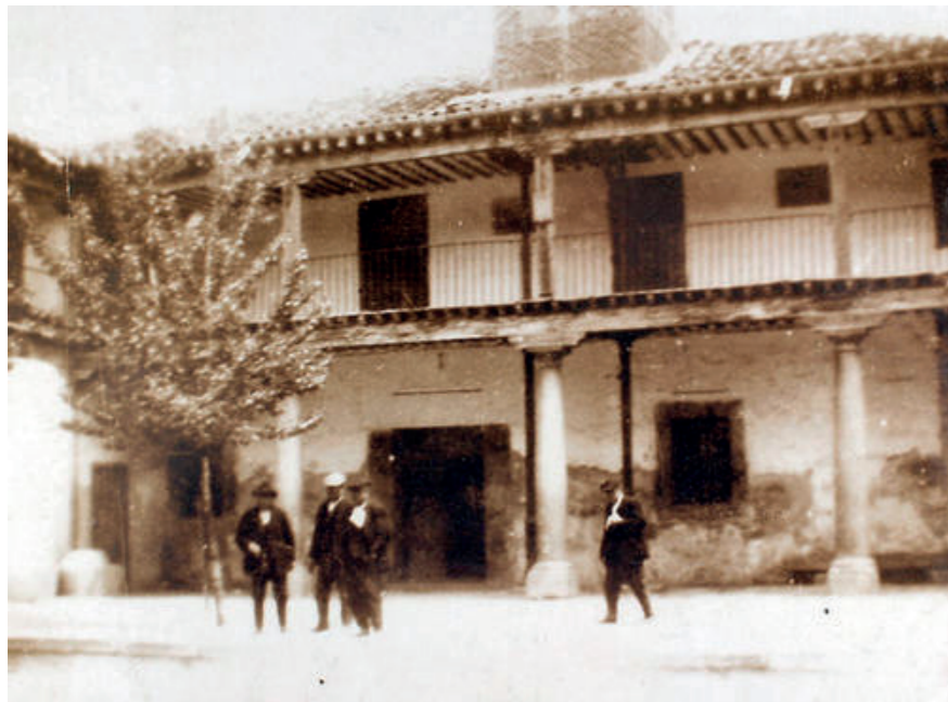
Fachada del antiguo Ayuntamiento, 1900.