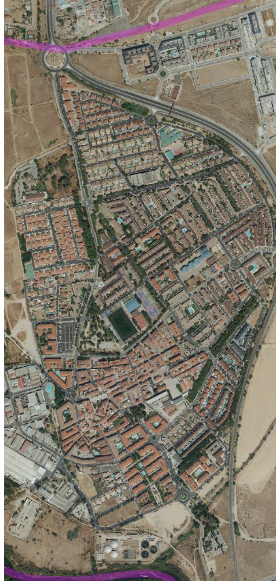
VELILLA DE SAN ANTONIO EN 2022. FUENTE: CARTOMADRID