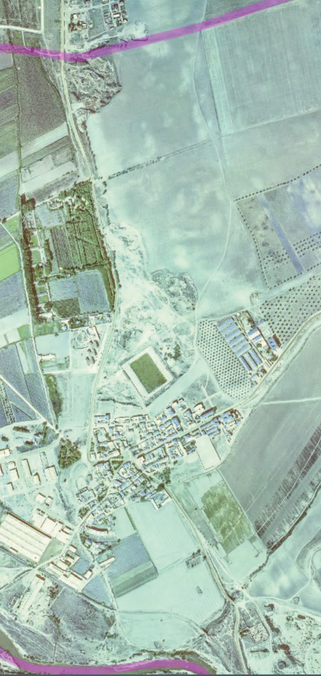
VELILLA DE SAN ANTONIO EN 1980.