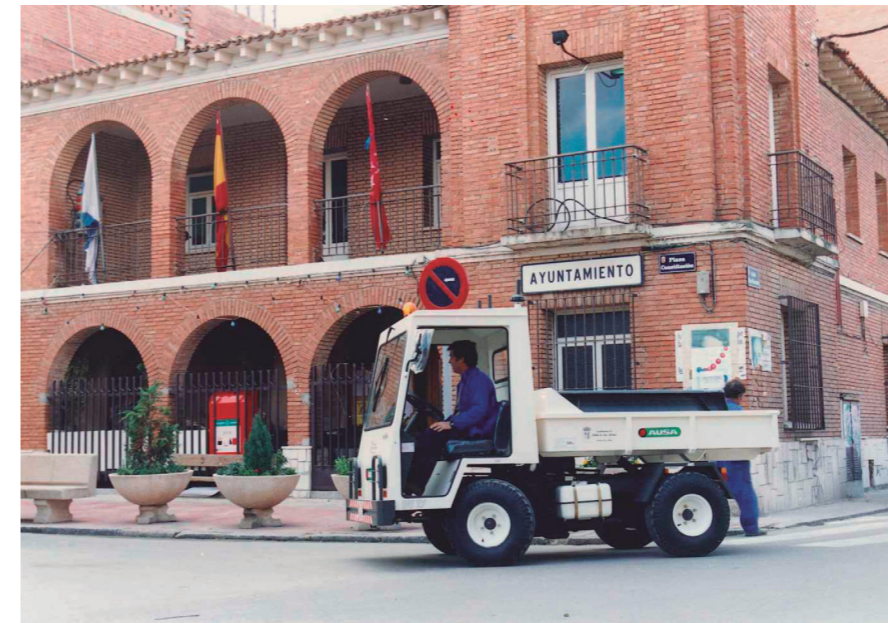
Fachada del antiguo Ayuntamiento, 1995.