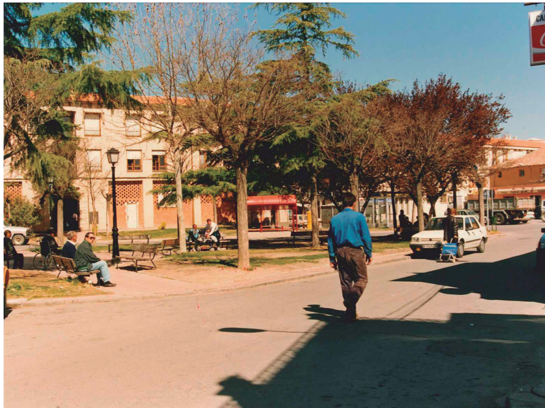
Plaza de la Constitución antes de su peatonalización, 1995.