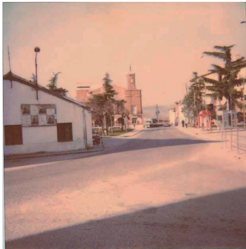
Calle Mayor y Plaza de la Constitución antes de su peatonalización, sin fecha.