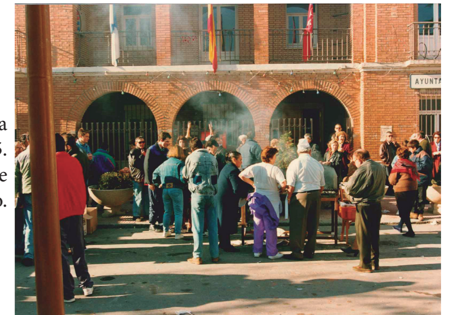
Fiesta de la Pitanza en la plaza de la Constitución, 1995.