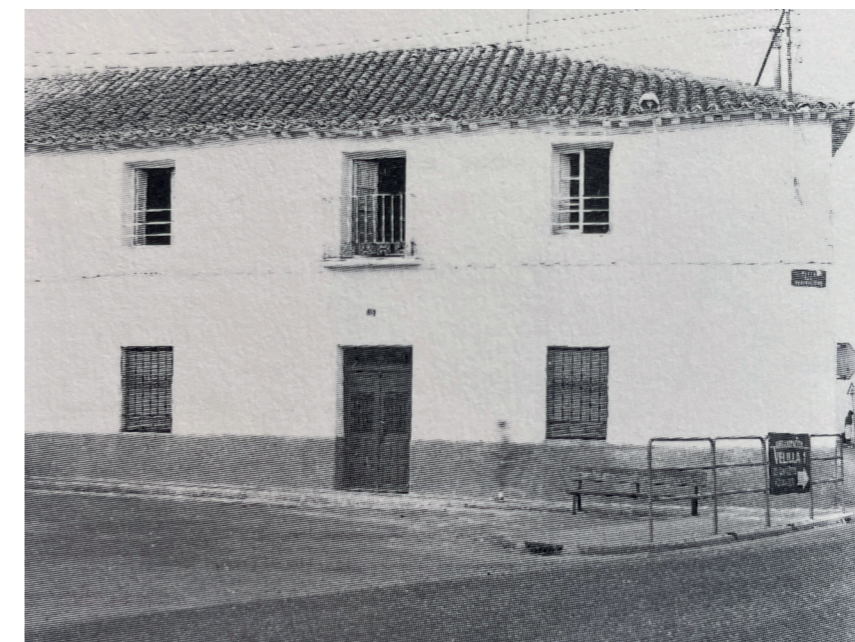
Vivienda en la plaza. En: Arquitectura y desarrollo, 2002.