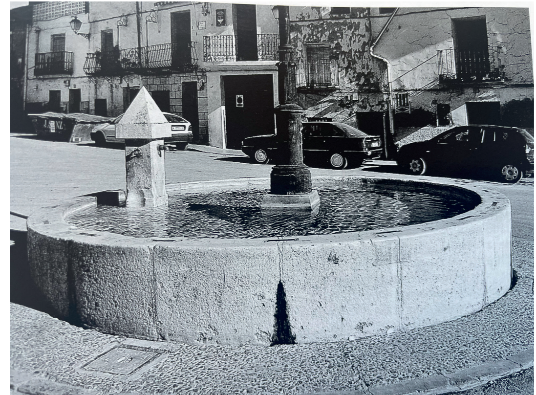
Fuente neoclásica. Fotografía de Vicente Patón. En: Arquitectura y desarrollo, 2009. Fuente: Centro de Documentación de Medio Ambiente y Ordenación del Territorio.