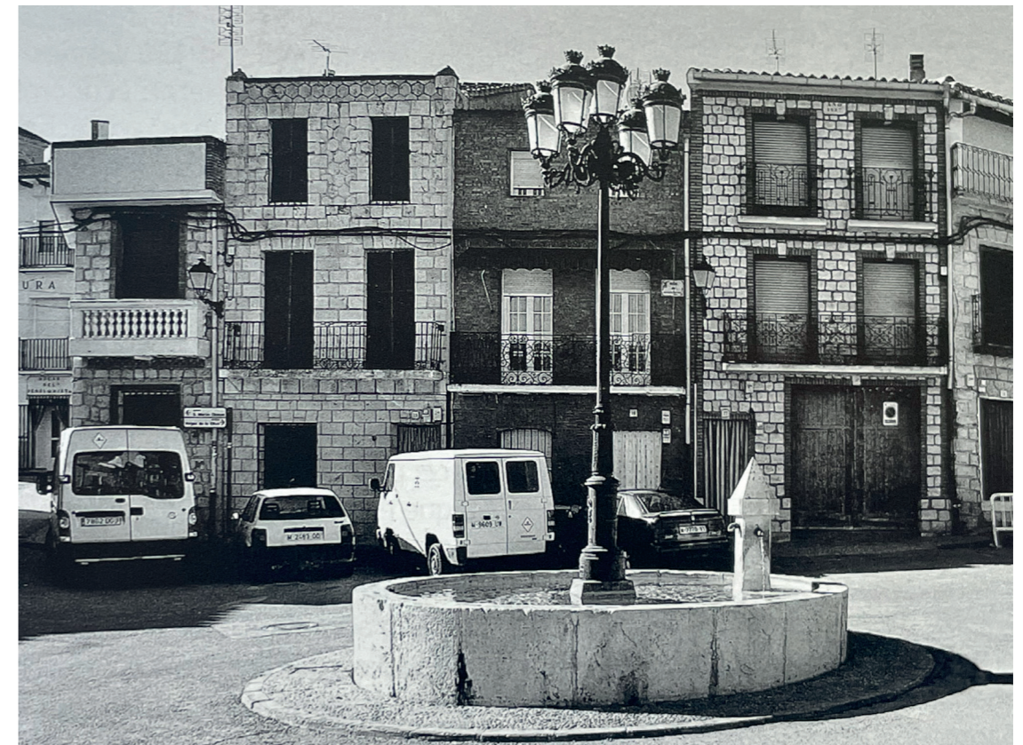
Fuente neoclásica. Fotografía de Vicente Patón. En: Arquitectura y desarrollo, 2009. Fuente: Centro de Documentación de Medio Ambiente y Ordenación del Territorio.