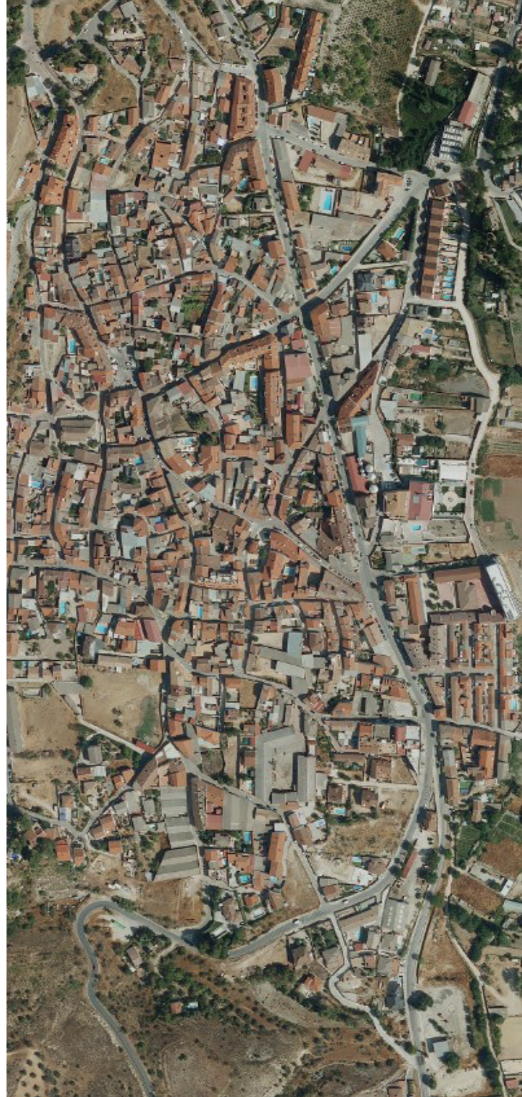
VALDILECHA EN 2022.