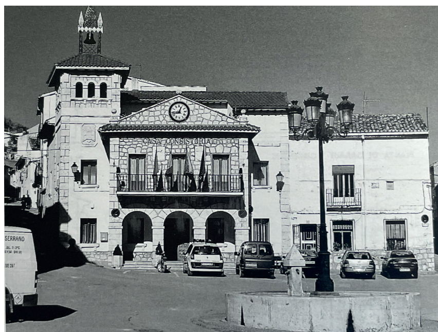
Casa consistorial tras la reforma de 1999. Fotografía de Vicente Patón. En: Arquitectura y desarrollo, 2009. Fuente: Centro de Documentación de Medio Ambiente y Ordenación del Territorio.