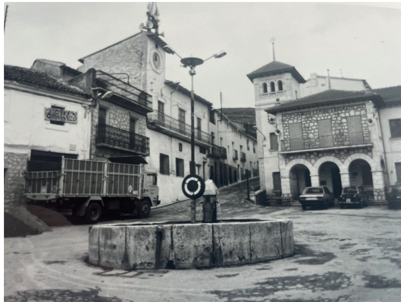
Plaza del Ayuntamiento. En: Información, clasificación y normativa para los cascos antiguos de la zona Suroeste del ámbito de la Comunidad de Madrid, 1984.