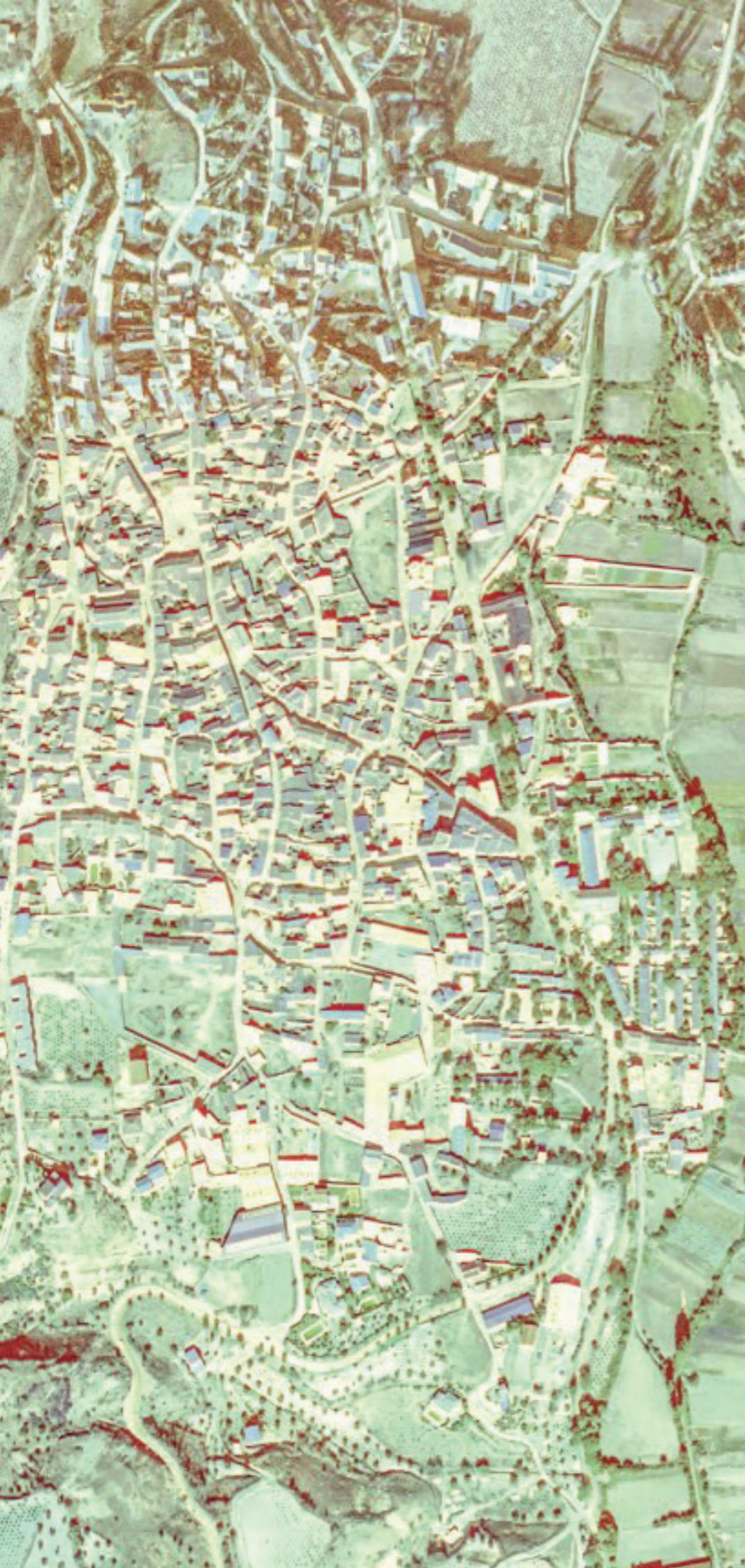
VALDILECHA EN 1980. FUENTE: CARTOMADRID