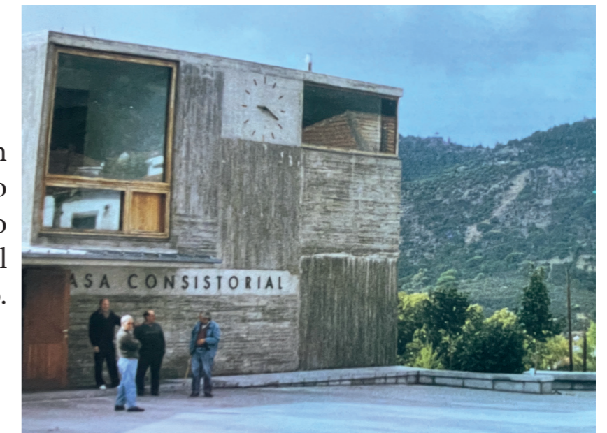
Plaza de España. En: Plazas con historia, 2002.