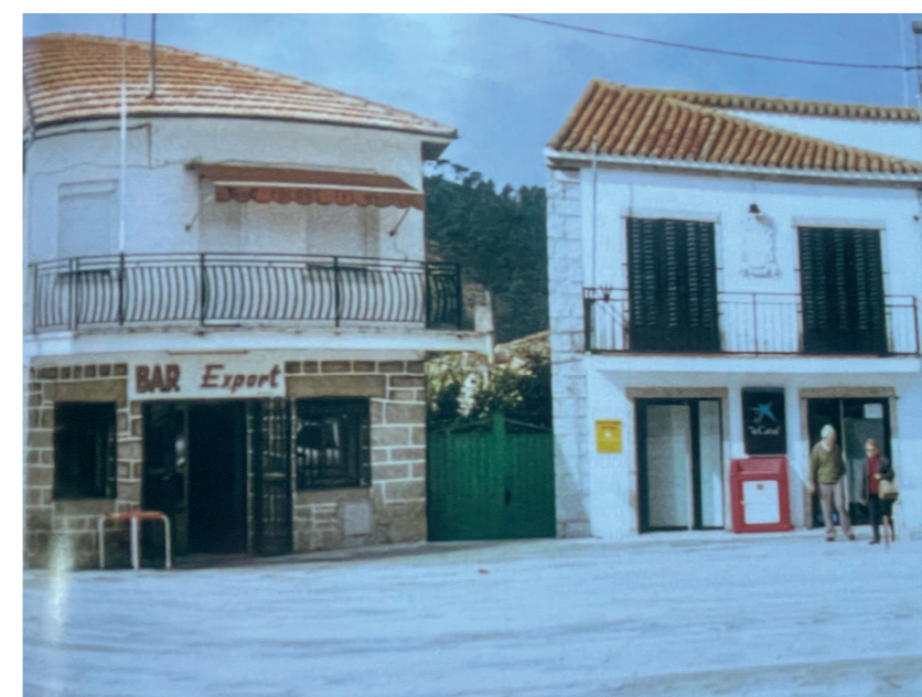
Plaza de España. En: Plazas con historia, 2002.