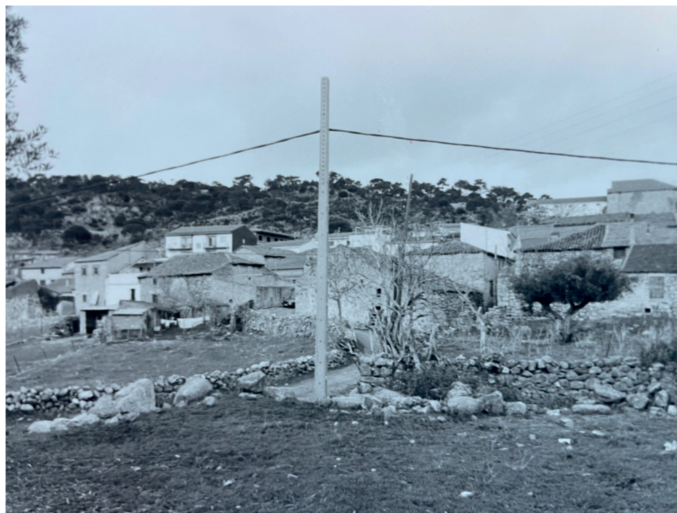
Antiguo Ayuntamiento. Fotografía: Actividades y Servicios Fotográficos. En: Arquitectura y desarrollo, 1999. Fuente: Centro de Documentación de Medio Ambiente y Ordenación del Territorio.