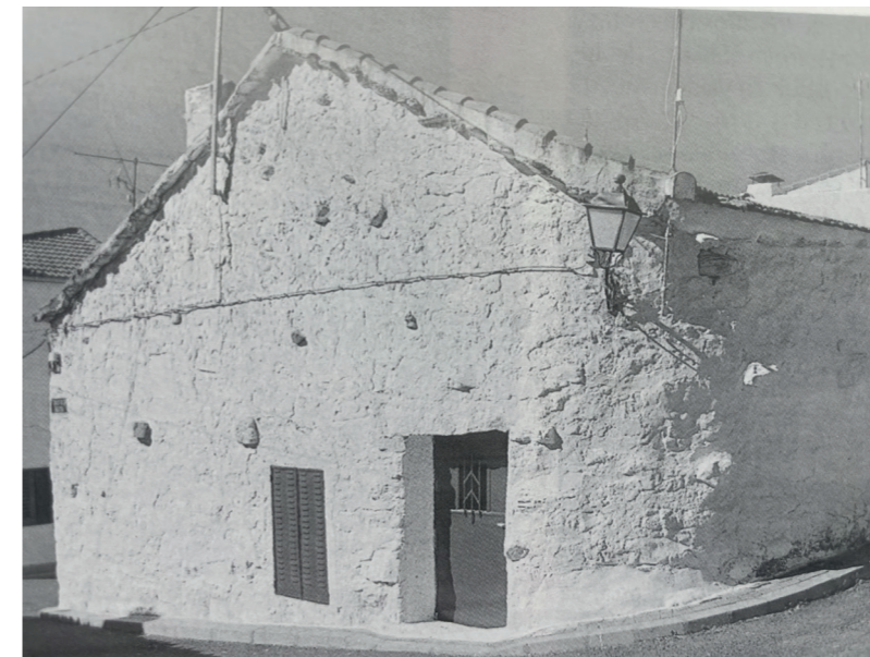
Vivienda. En: Arquitectura y desarrollo, 1999.