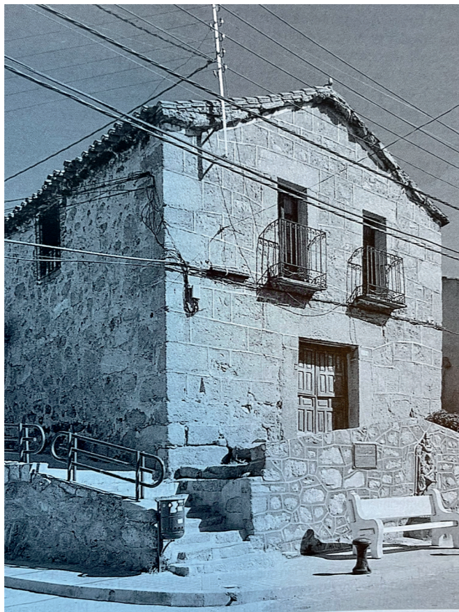
Vista de Valdemaqueda. En: Información, clasificación y normativa para los cascos antiguos de la zona Suroeste del ámbito de la Comunidad de Madrid, 1984.