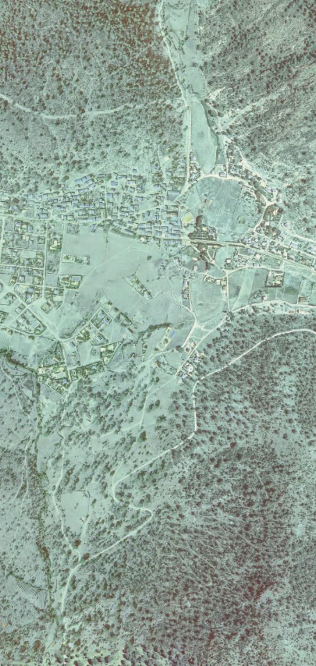
VALDEMAQUEDA EN 1980.