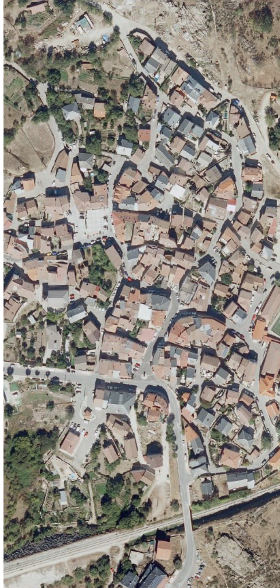
VALDEMANCO EN 2022.