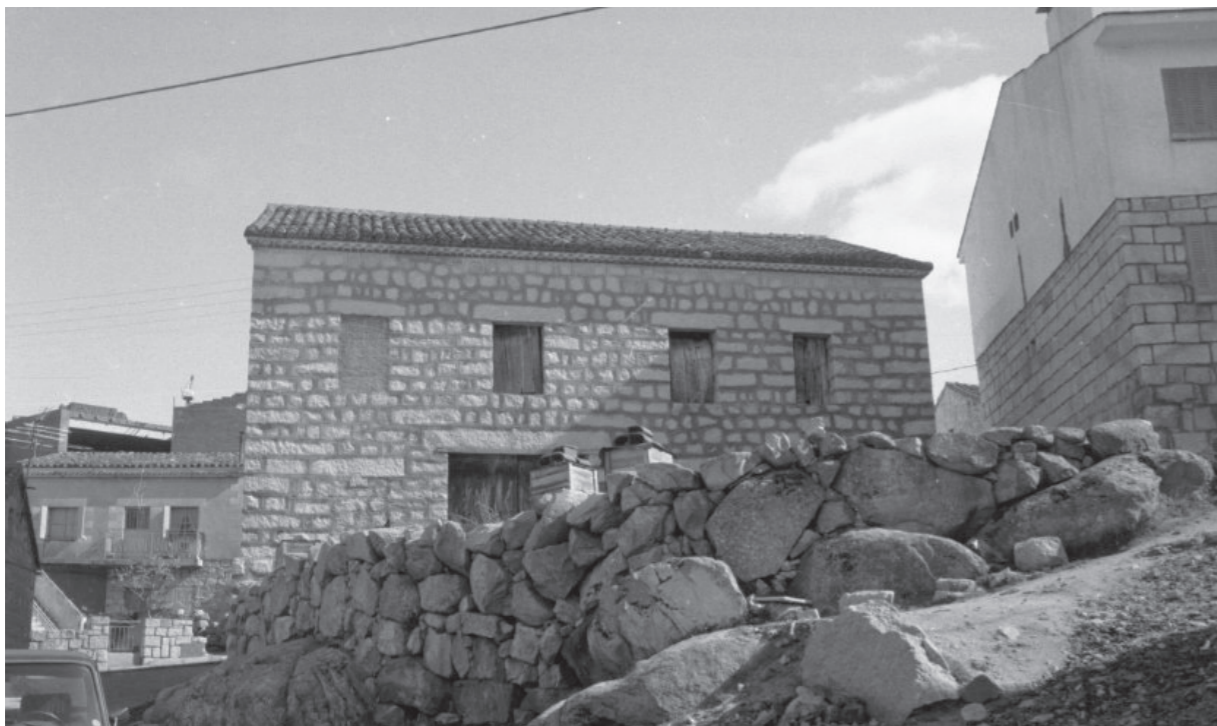
Plaza. En: Inventario de cascos antiguos, edificios y elementos singulares de la Comunidad de Madrid, 1985.