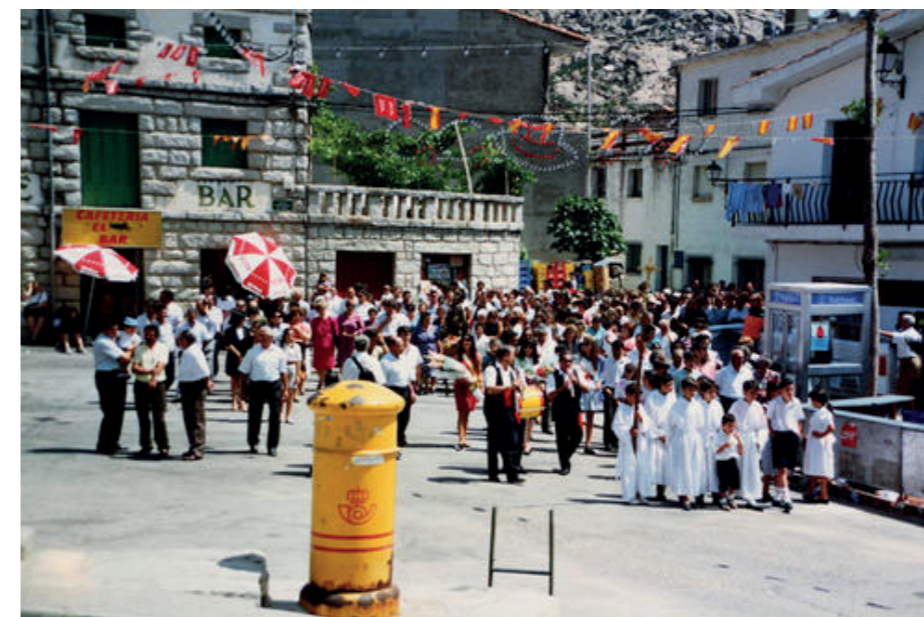
Fiestas de San Roque, 1992.