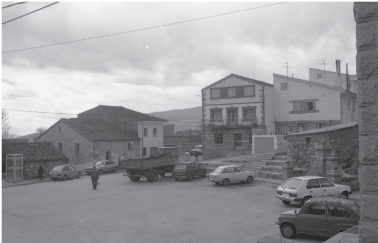
Plaza. En: Inventario de cascos antiguos, edificios y elementos singulares de la Comunidad de Madrid, 1985.