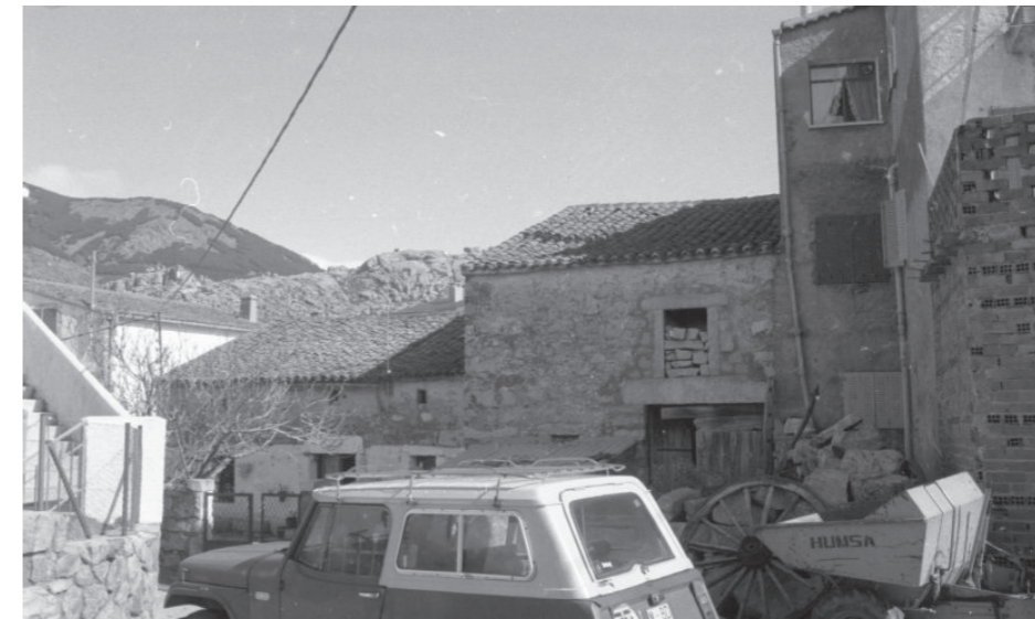
Plaza. En: Inventario de cascos antiguos, edificios y elementos singulares de la Comunidad de Madrid, 1985.