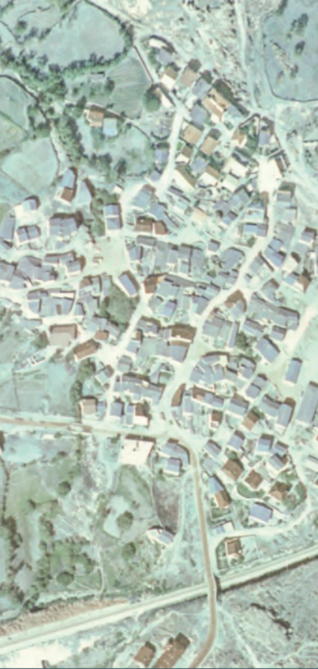
VALDEMANCO EN 1980.