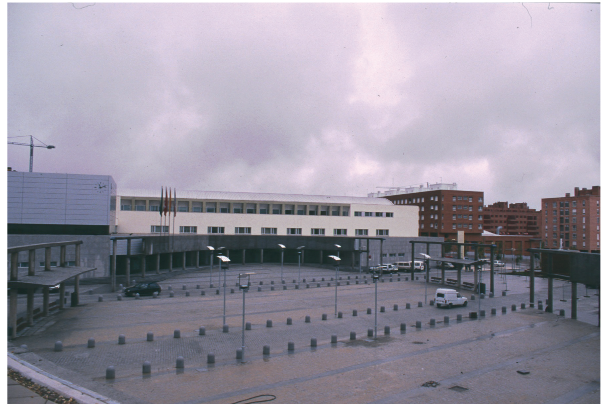
Plaza, 1999.