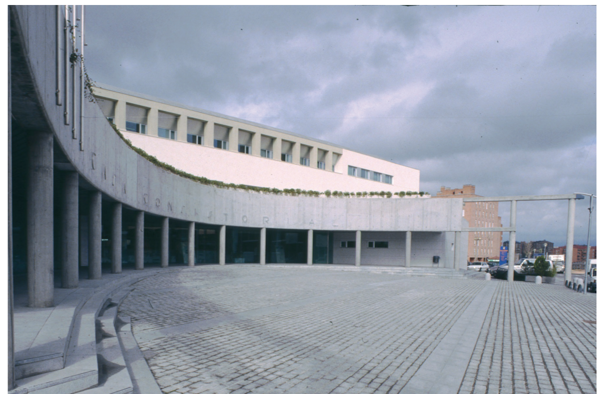
Ayuntamiento, 1999.