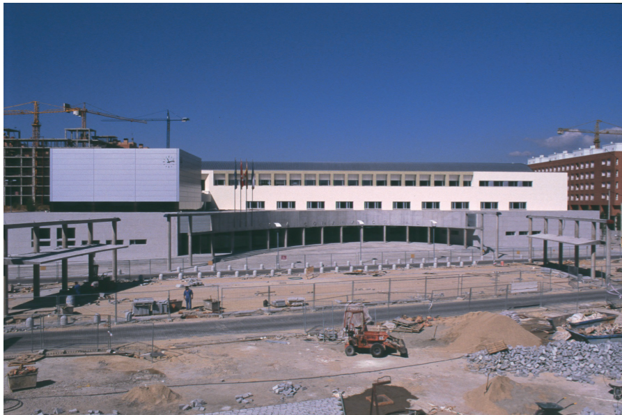
Obras plaza del Ayuntamiento, alrededor 1995.