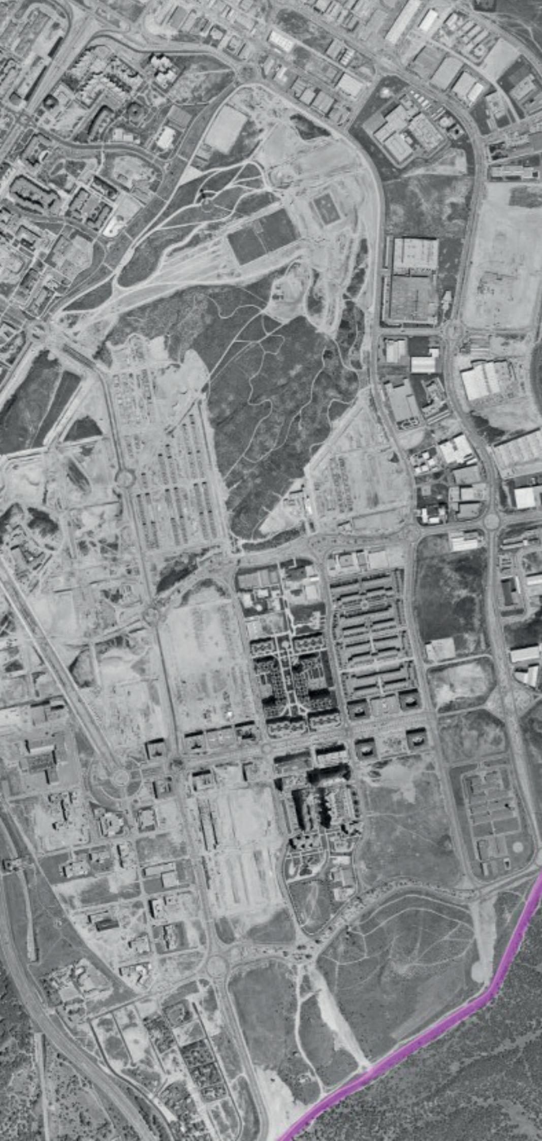
TRES CANTOS EN 1991 (AÑO DE SU FUNDACIÓN).