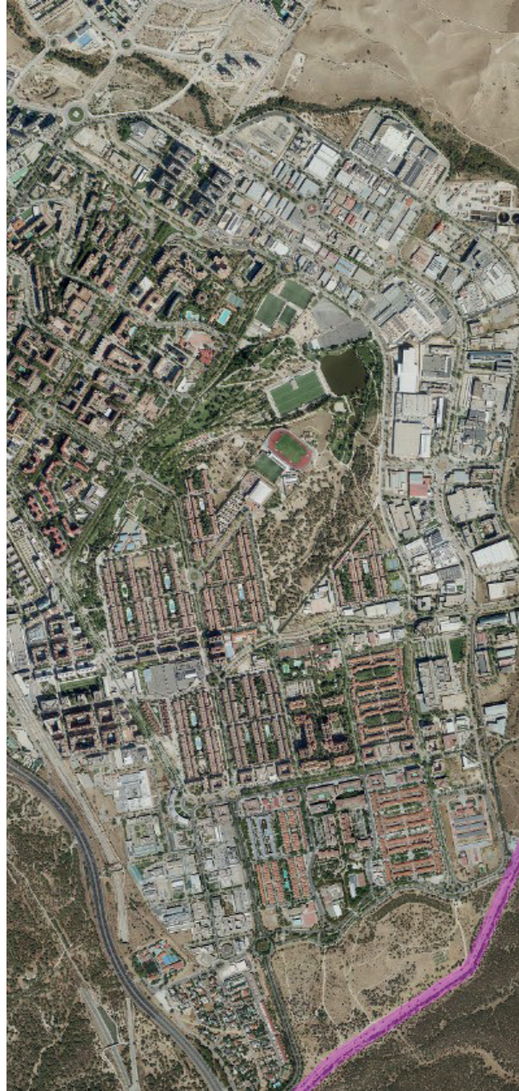
TRES CANTOS EN 2022. FUENTE: CARTOMADRID