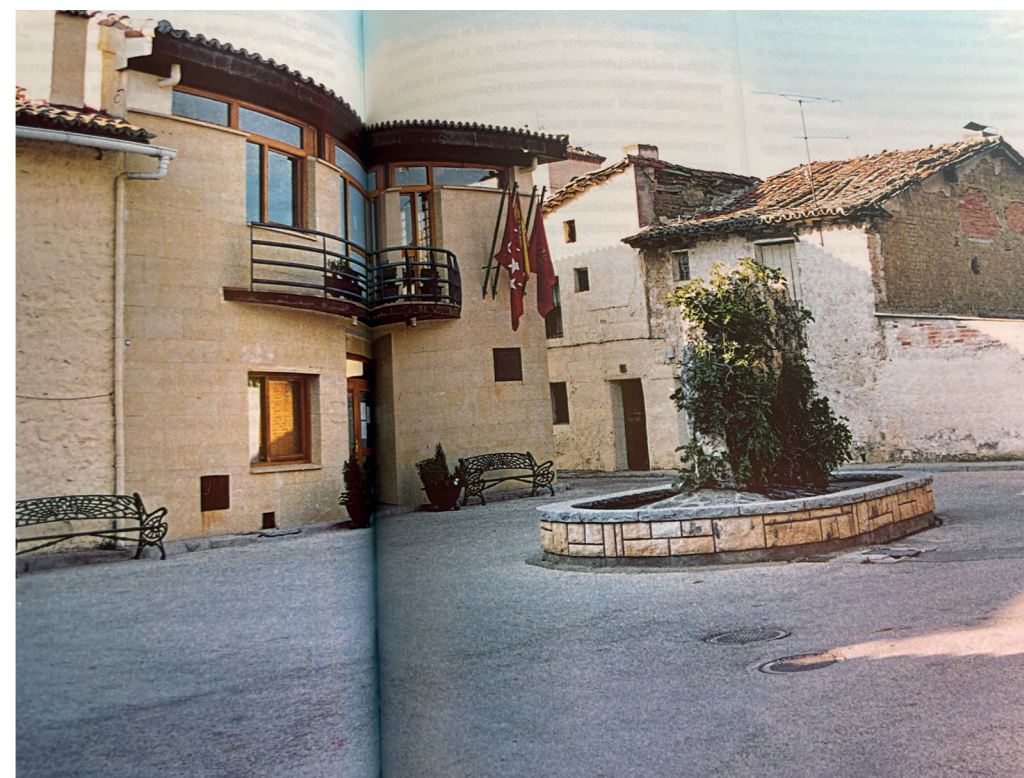
Plaza Tercia. En: Plazas con historia, 2004.