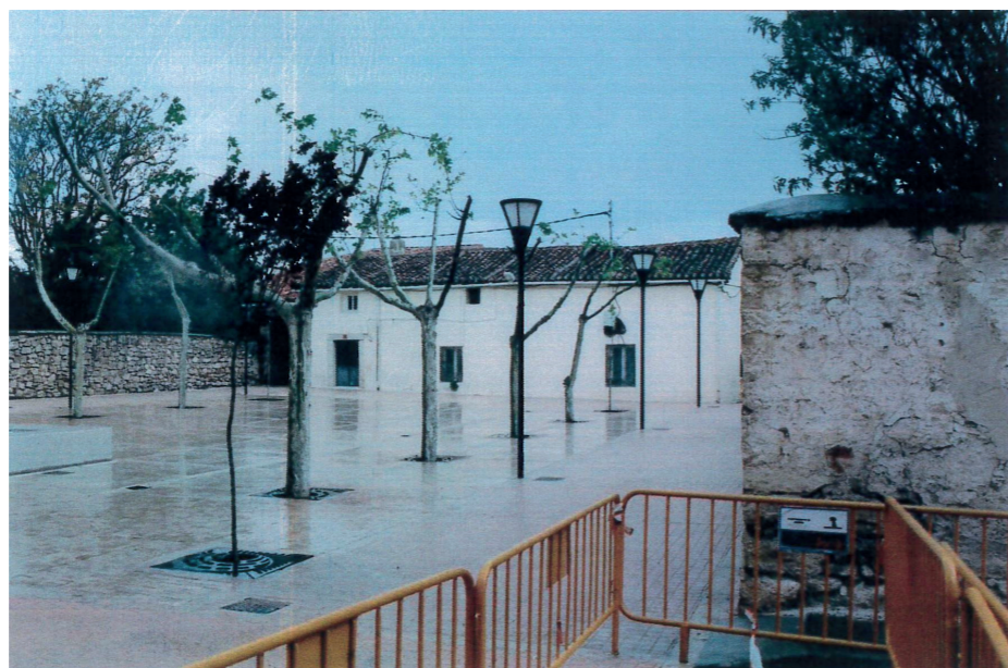
Plaza Mayor, 2000.