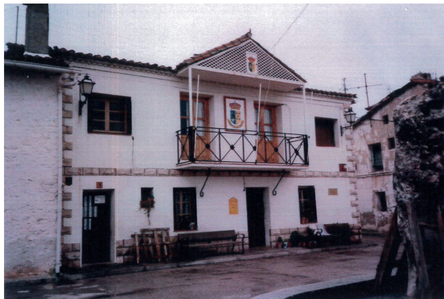
Plaza de España, 1989.