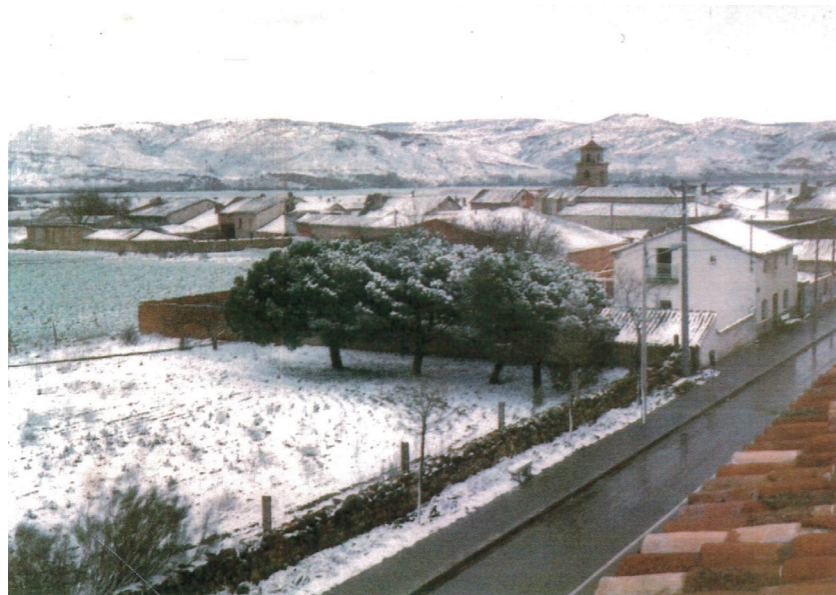
Plaza del Comercio, 1987.