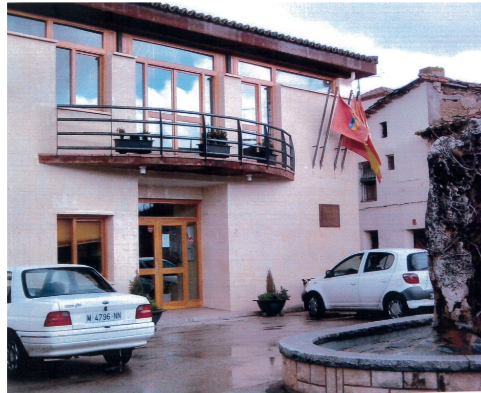
Plaza Tercia, 2000.