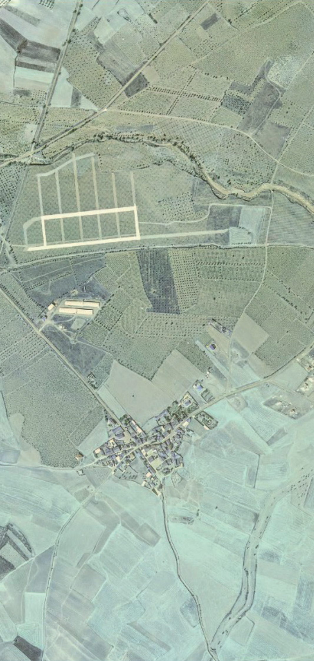
TORREMOCHA DE JARAMA EN 1980.