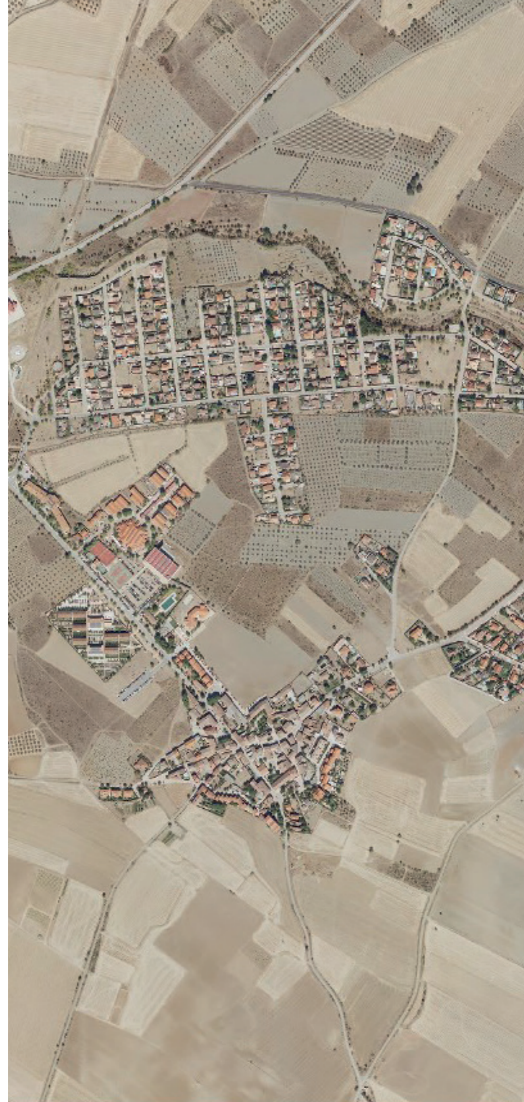
TORREMOCHA DE JARAMA EN 2022.