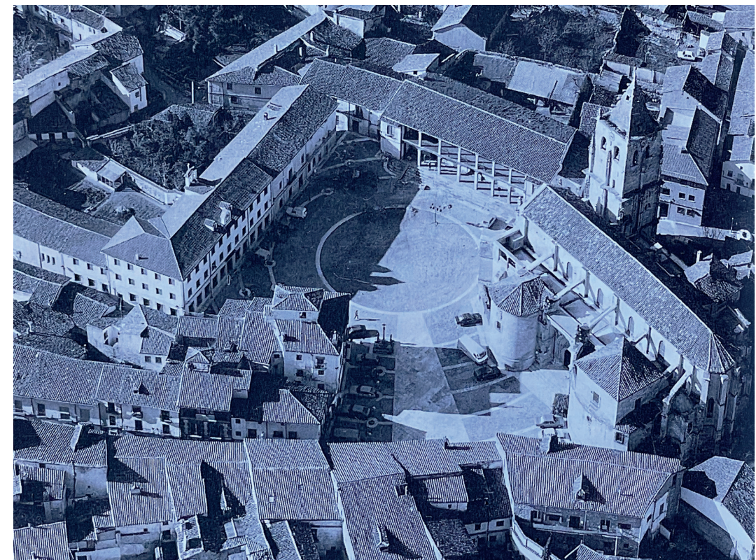
Vista aérea de la plaza Mayor. En: Arquitectura y desarrollo, 1991.