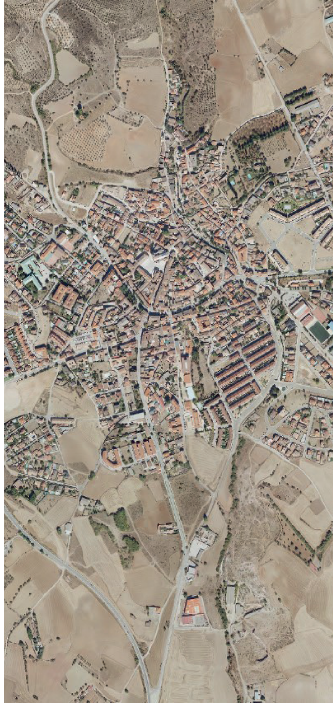
TORRELAGUNA EN 2022.