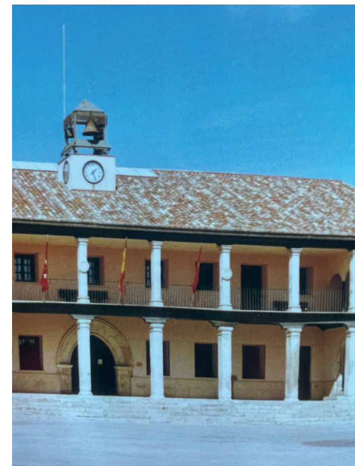
Plaza. En: Plazas con historia, 1992.