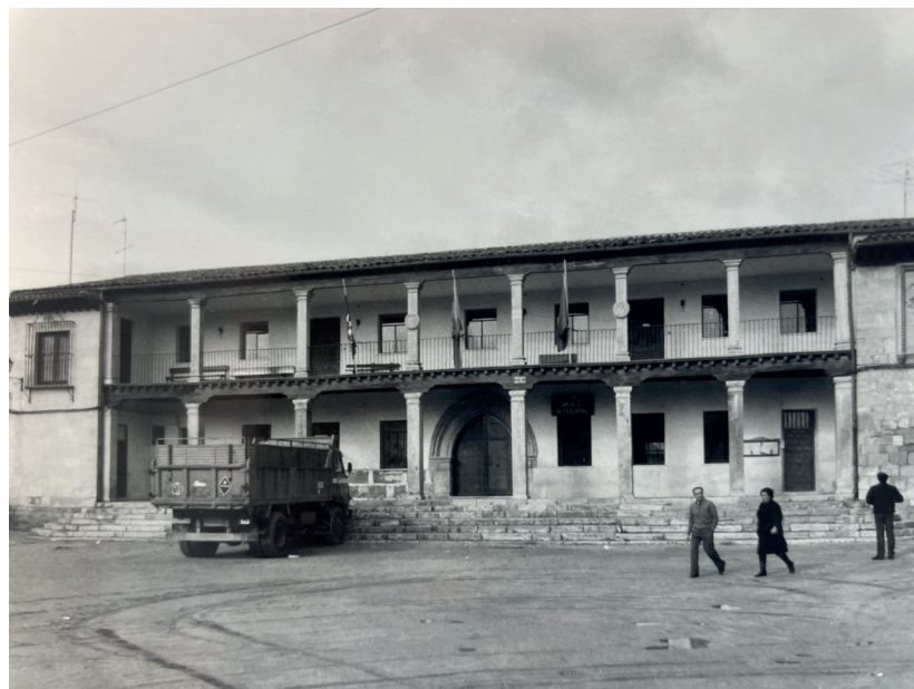
Plaza Mayor. En: Información, clasificación y normativa para los cascos antiguos de la Zona Norte del ámbito de la Comunidad Autónoma de Madrid, 1984.