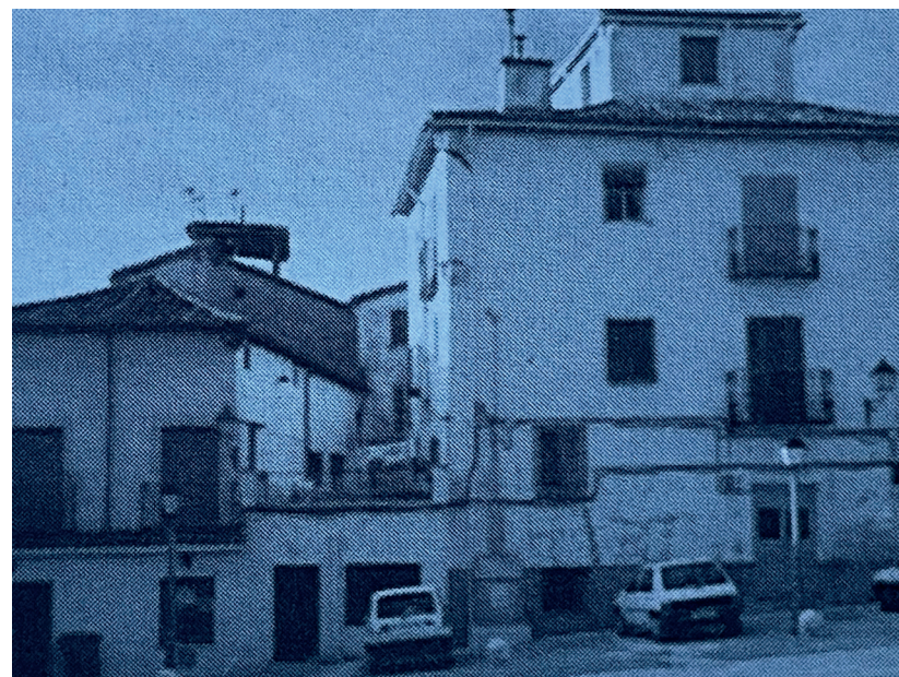
Viviendas, fachada lateral. En: Arquitectura y desarrollo, 1991.