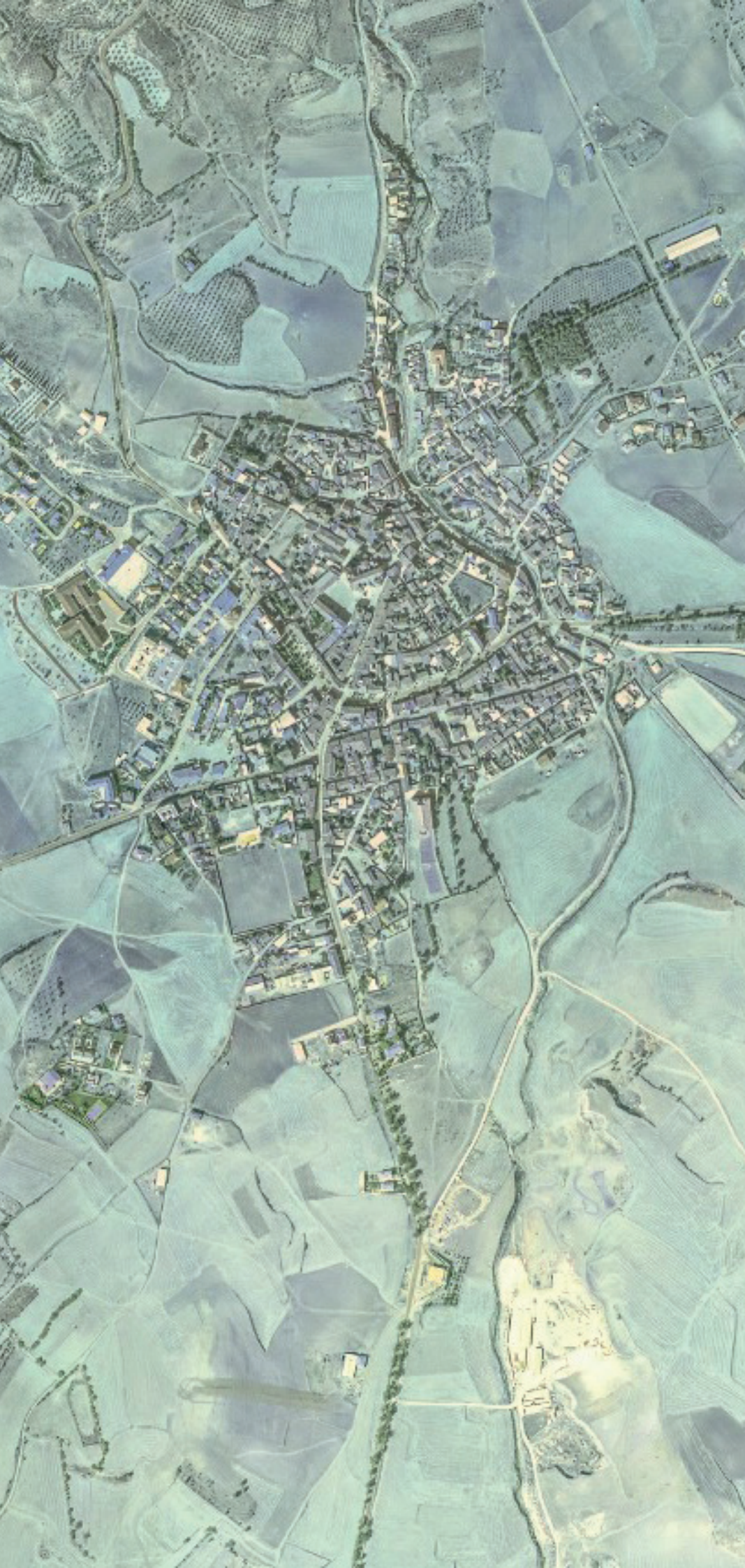
TORRELAGUNA EN 1980.