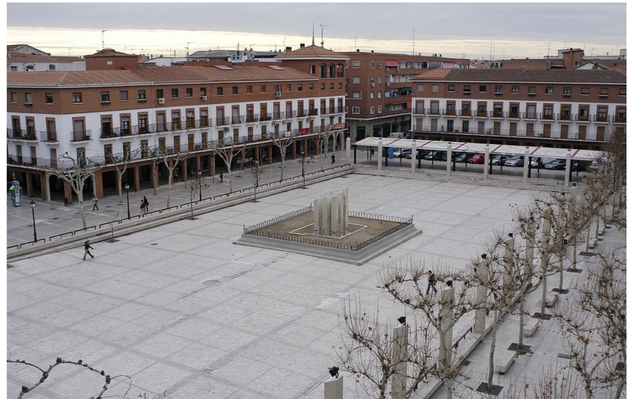
Plaza Mayor antes de reforma de 2008.