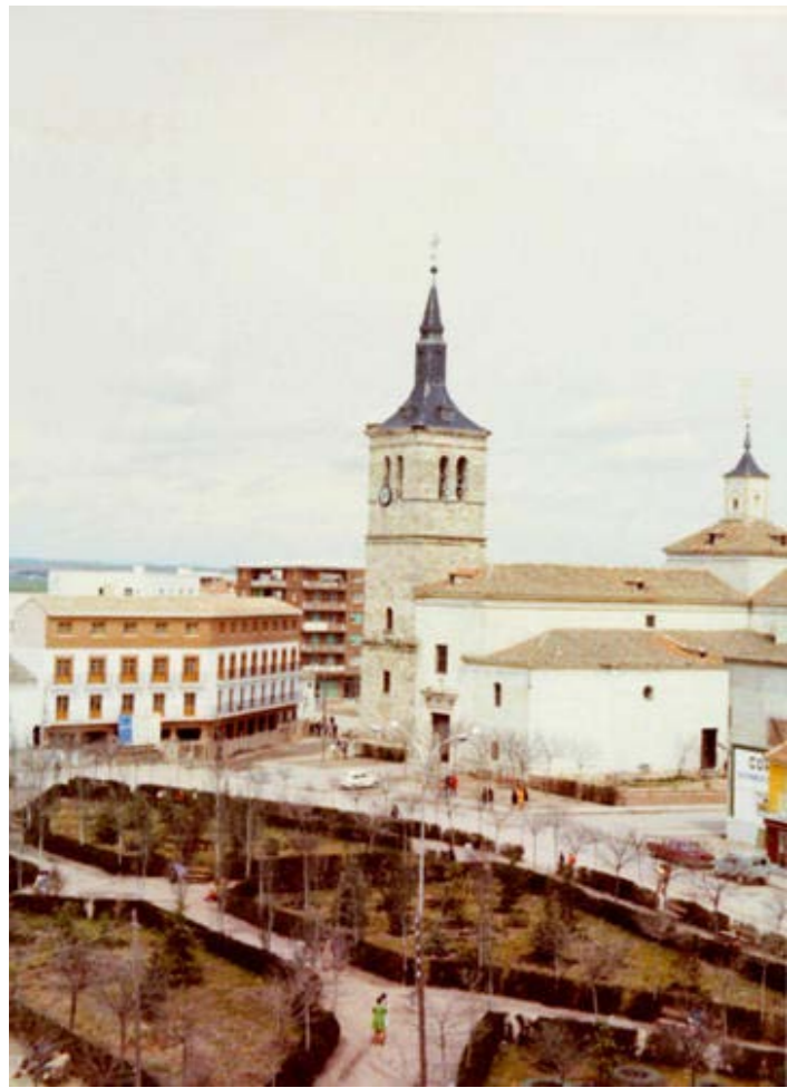
Plaza Mayor, 1968.