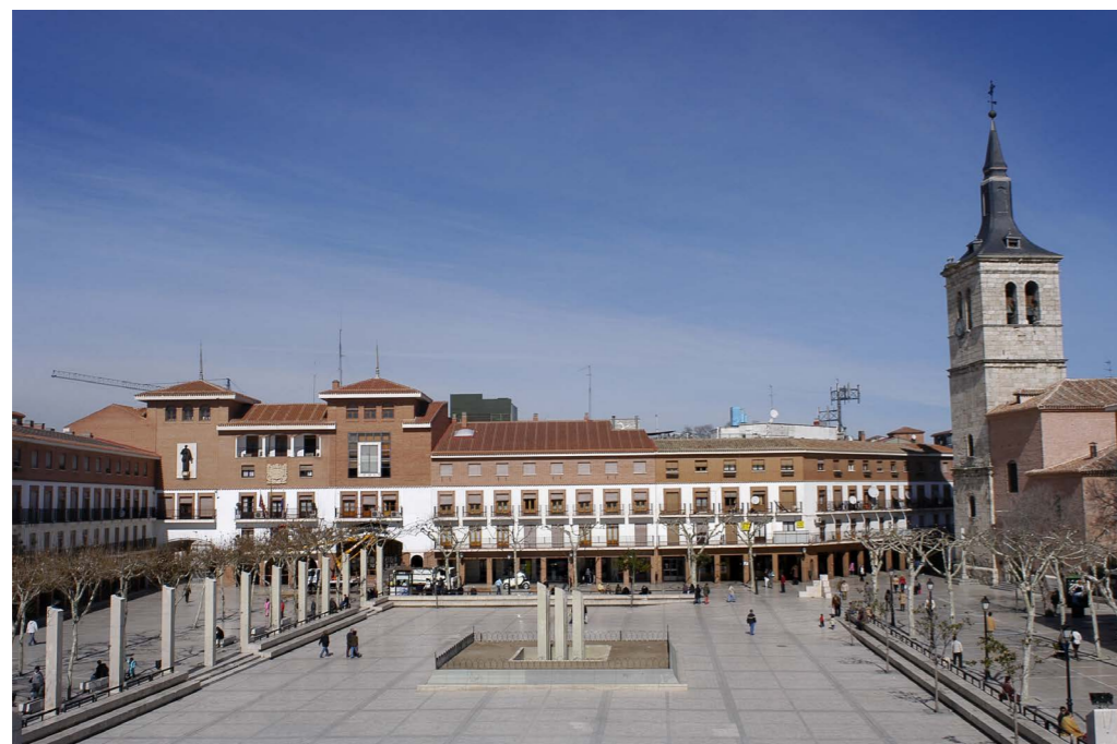
Plaza Mayor antes de reforma de 2008.