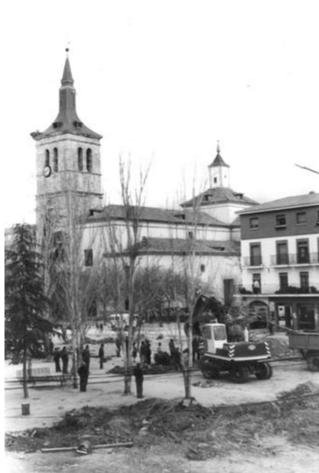
Plaza Mayor, 1968.