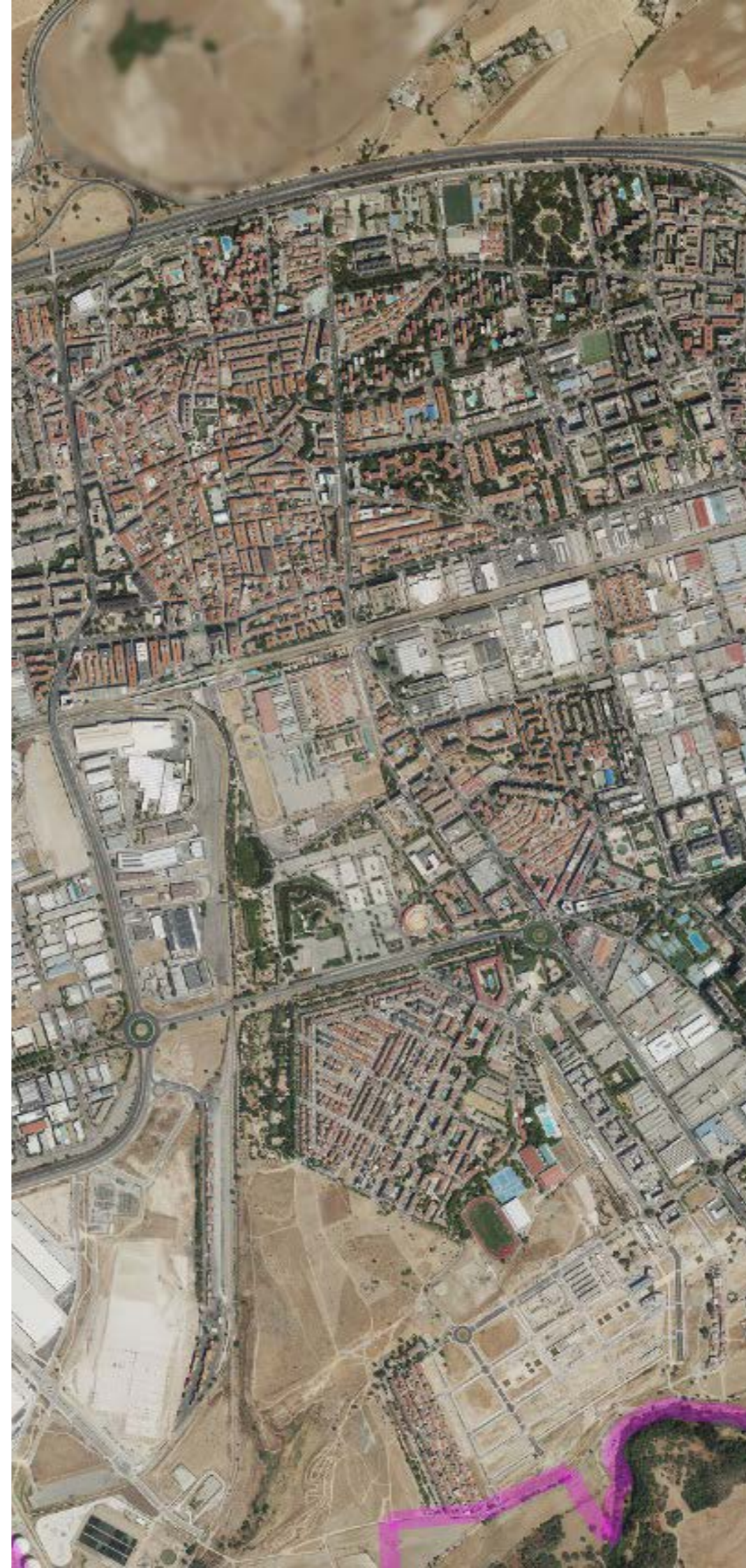
TORREJÓN DE ARDOZ EN 2022.