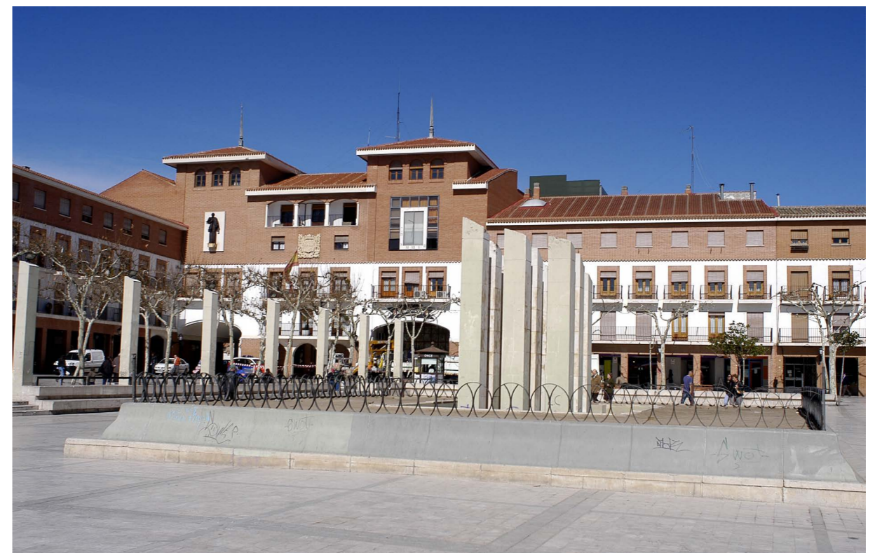
Plaza Mayor antes de reforma de 2008.