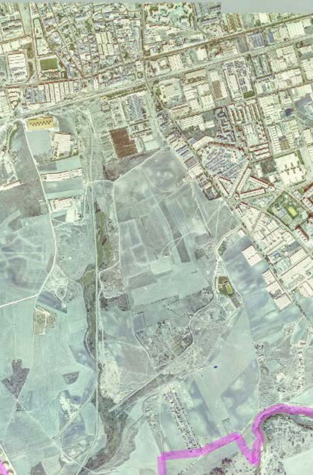
TORREJÓN DE ARDOZ EN 1980.