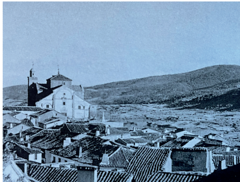
Vista general de San Martín de Valdeiglesias, 1949. En: Arquitectura y desarrollo, 1991.