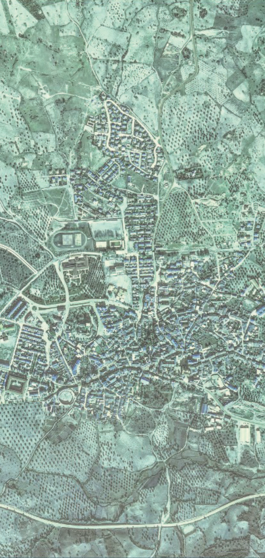
SSAN MARTÍN DE VALDEIGLESIAS EN 1980.