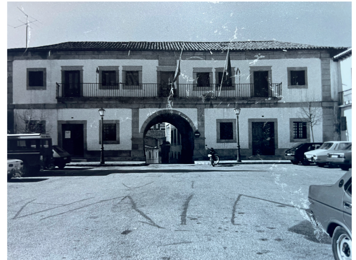
Plaza. En: Información, clasificación y normativa para los cascos antiguos de la zona Suroeste del ámbito de la Comunidad de Madrid, 1984.