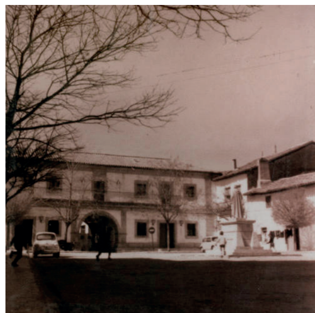
Plaza, 1950.