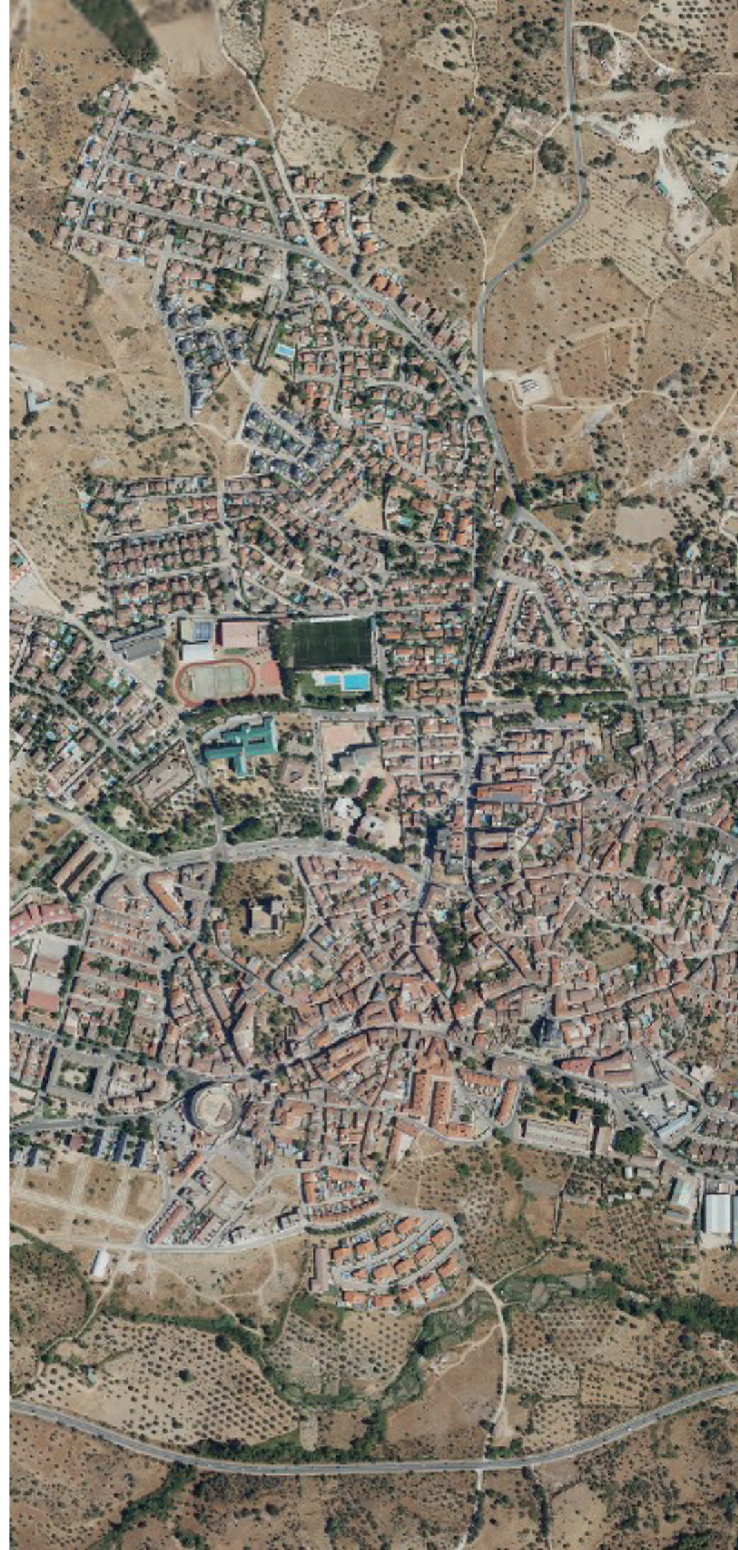
SAN MARTÍN DE VALDEIGLESIAS EN 2022.