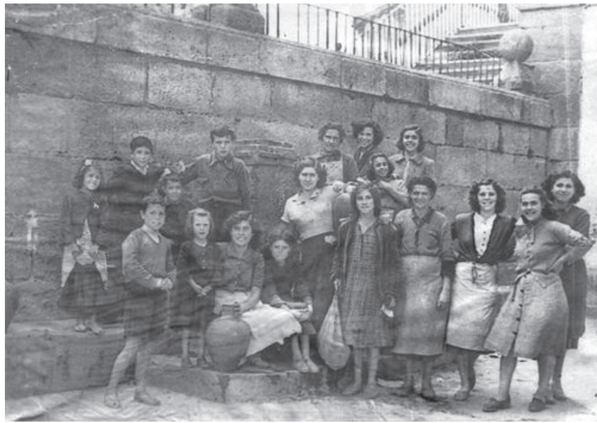
Fuente en la plaza Real, 1940.