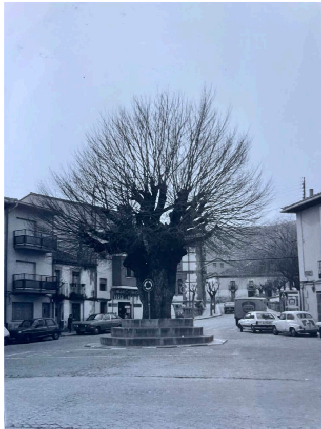
Plaza de Rascafría. En: Información, clasificación y normativa para los cascos antiguos de la Zona Norte del ámbito de la Comunidad Autónoma de Madrid, 1984.