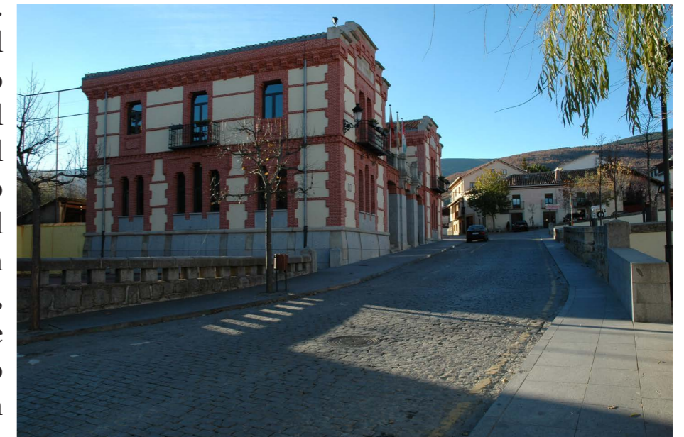
Ayuntamiento y plaza. Fotografía: José Manuel Ablanedo. En: Proyecto de remodelación del espacio entorno al Ayuntamiento y proyecto de rehabilitación del Ayuntamiento en Rascafría. Estado inicial, 2004. Fuente: Centro de Documentación de Medio Ambiente y Ordenación del Territorio.