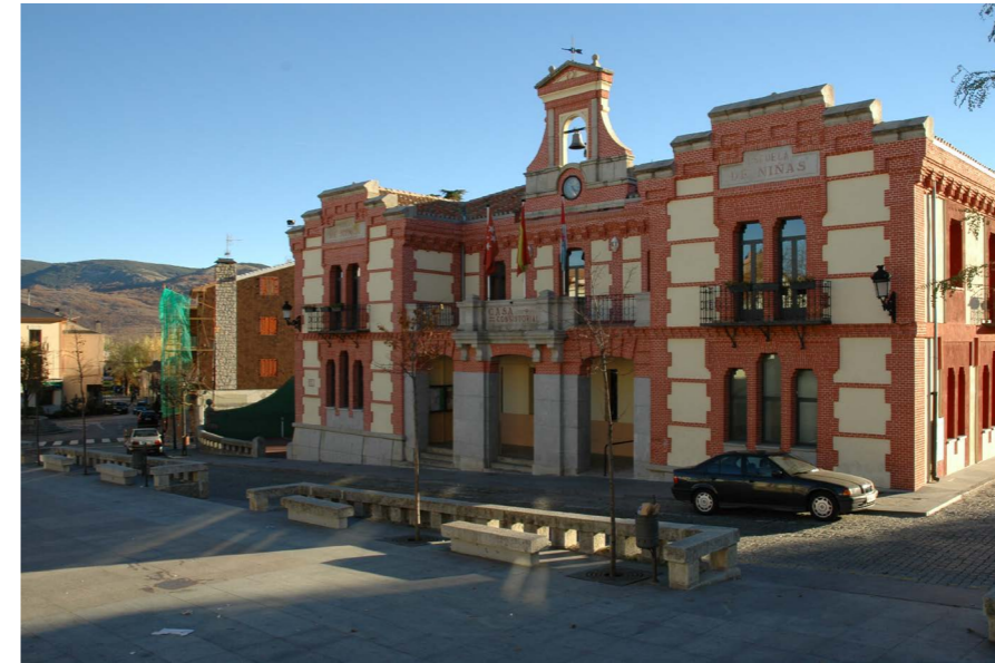
Ayuntamiento. Fotografía: José Manuel Ablanedo. En: Proyecto de remodelación del espacio entorno al Ayuntamiento y proyecto de rehabilitación del Ayuntamiento en Rascafría. Estado inicial, 2004. Fuente: Centro de Documentación de Medio Ambiente y Ordenación del Territorio.