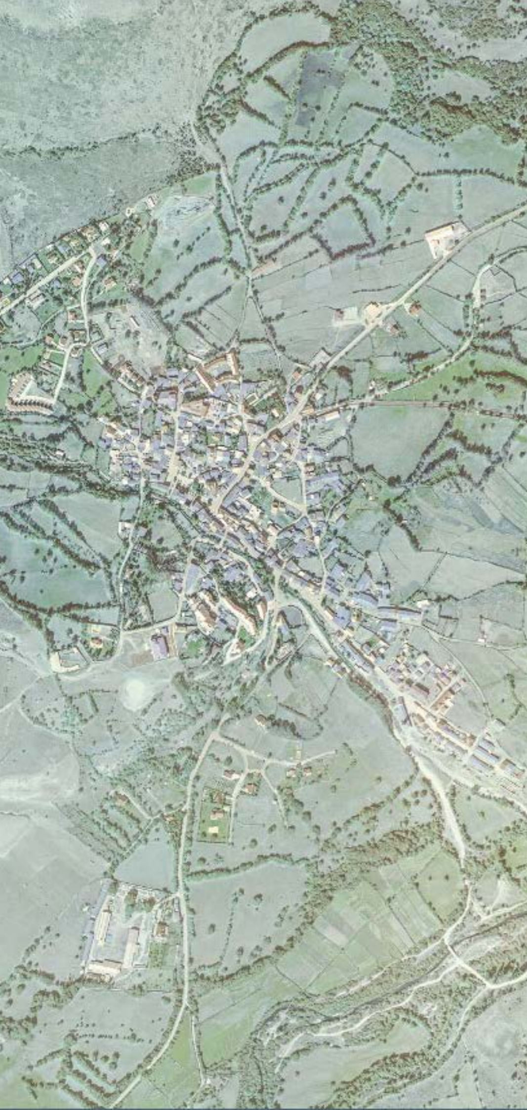
RASCAFRÍA EN 1980.