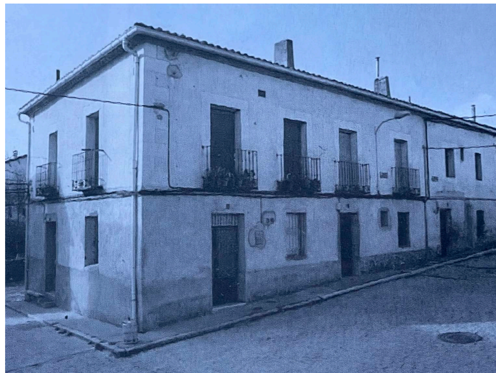
Edificio en plaza. En: Arquitectura y desarrollo, 1991.