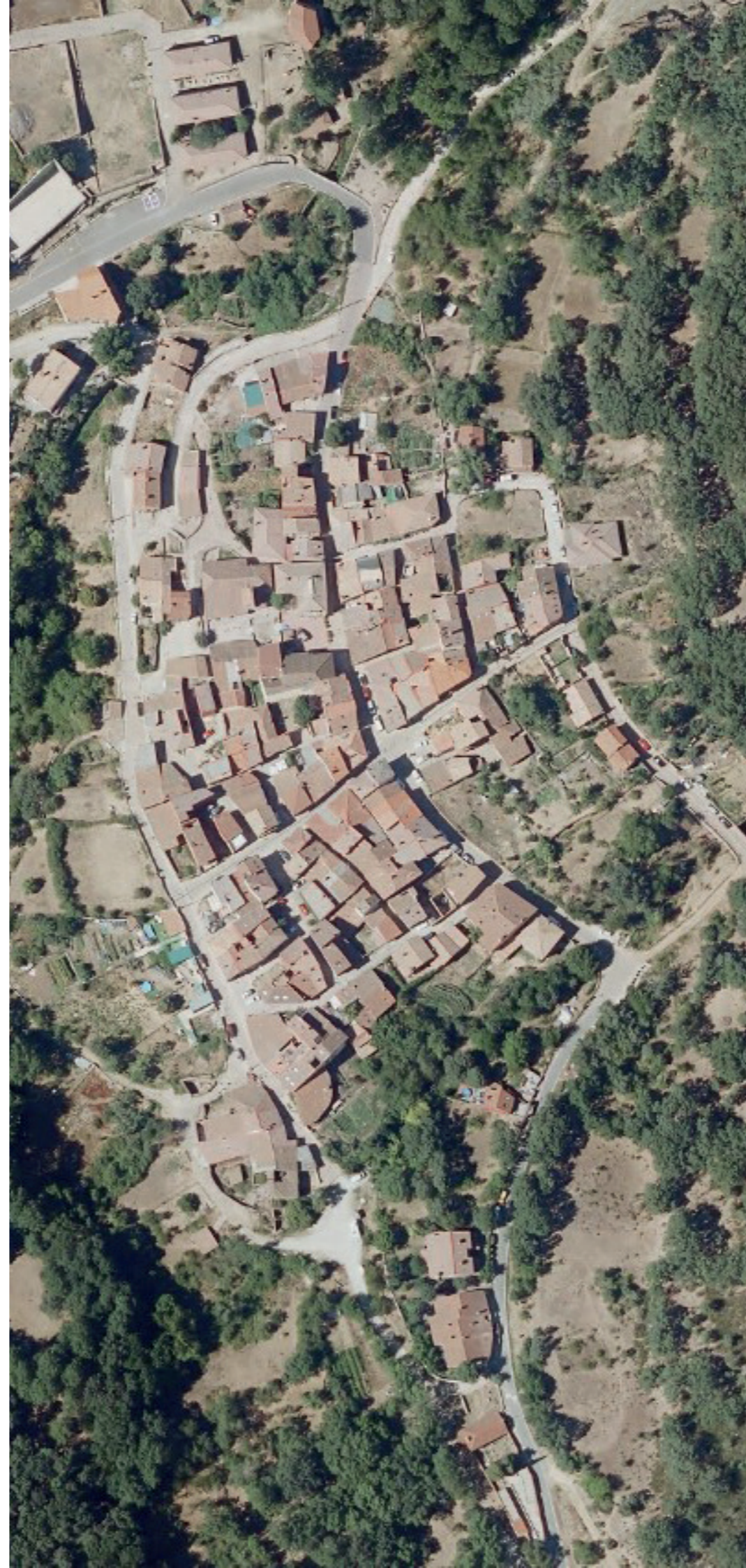
PUEBLA DE LA SIERRA EN 2022.