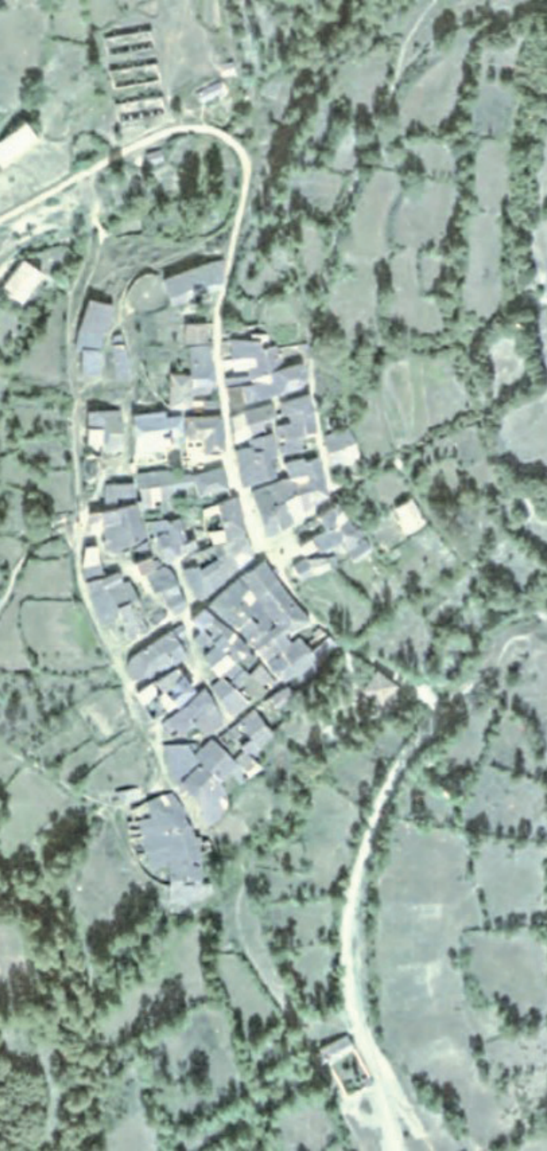
PUEBLA DE LA SIERRA EN 1980.