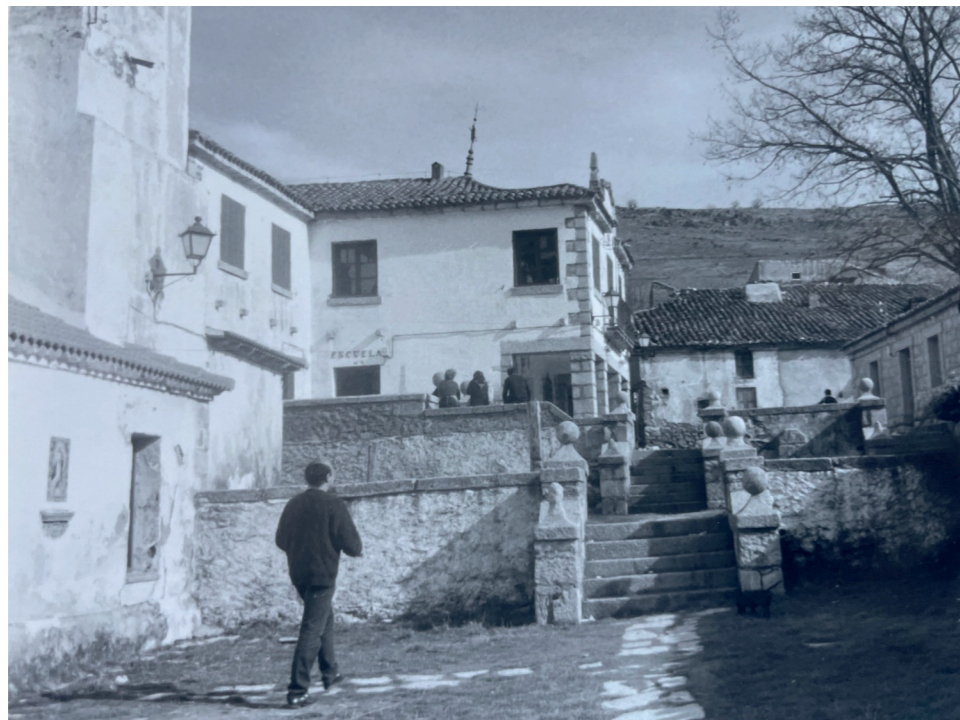
Plaza del Ayuntamiento. En: Información, clasificación y normativa para los cascos antiguos de la Zona Norte del ámbito de la Comunidad Autónoma de Madrid, 1984.