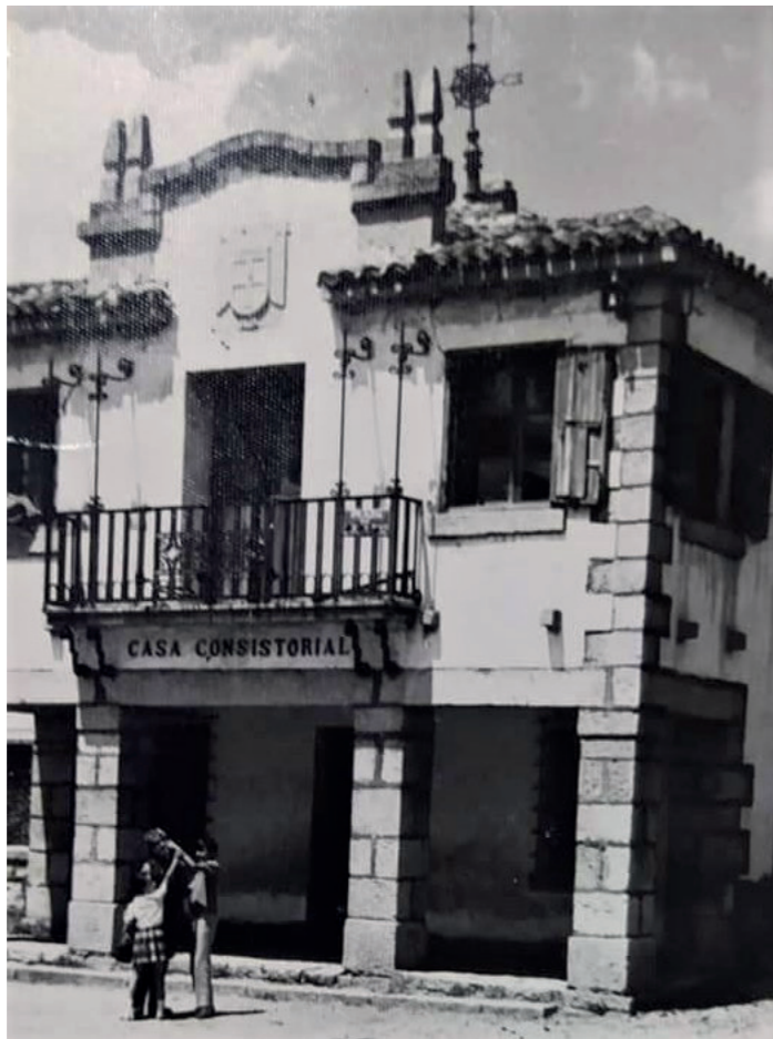
Plaza del Ayuntamiento, sin fecha.