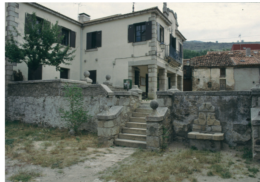
Plaza del Ayuntamiento, 1992. Fotografía de José Manuel Ablanedo. Fuente: Centro de Documentación de Medio Ambiente y Ordenación del Territorio.