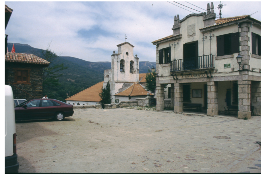
Plaza del Ayuntamiento, 1992.