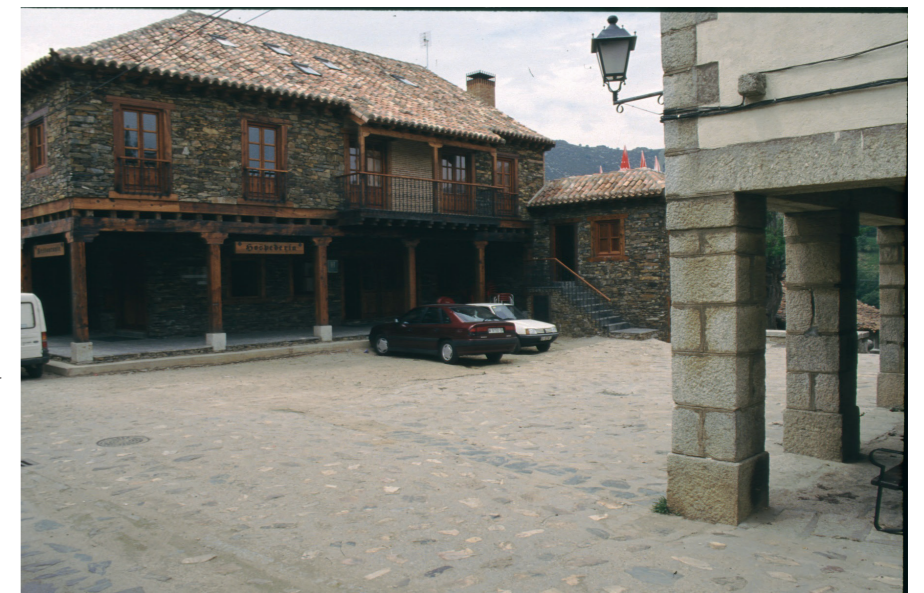
Plaza del Ayuntamiento, 1992.