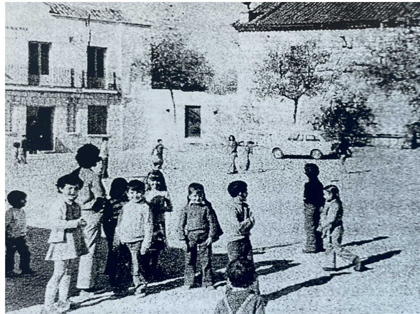
Plaza en 1976. En: Arquitectura y desarrollo, 2009.