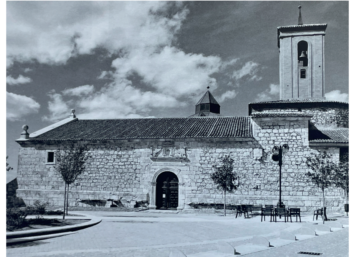
Plaza. En: Arquitectura y desarrollo, 2009.