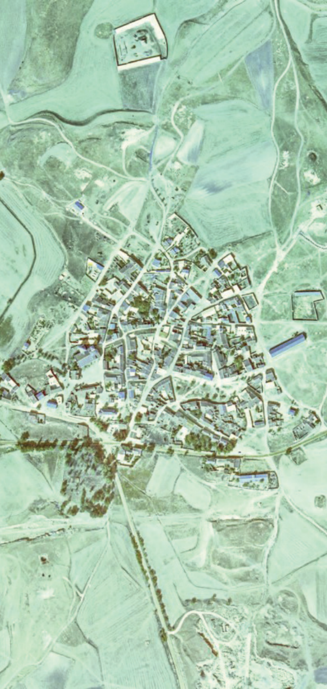
POZUELO DEL REY EN 1980.