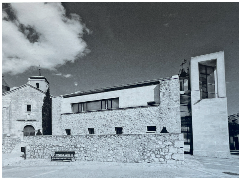
Ayuntamiento, fachada oriental. En: Arquitectura y desarrollo, 2009.