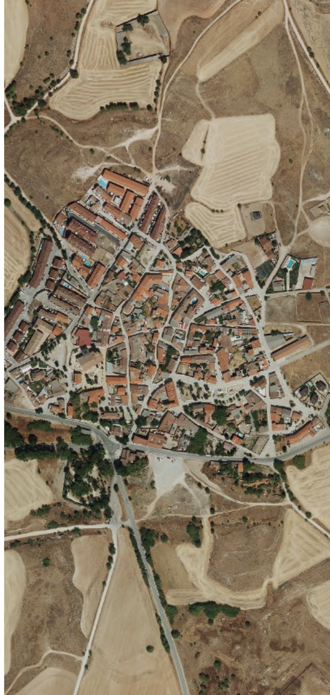
POZUELO DEL REY EN 2022. FUENTE: CARTOMADRID