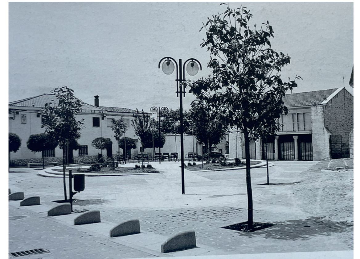
Plaza de la Constitución, 2007. Fotografía de Enrique Krahe. En: Arquitectura y desarrollo, 2009. Fuente: Centro de Documentación de Medio Ambiente y Ordenación del Territorio.