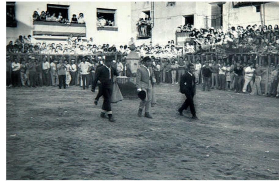
Toreros en la plaza, 1969.