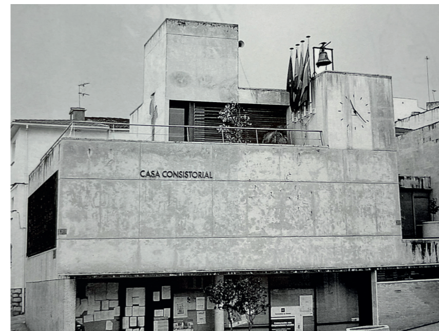
Plaza Constitución. En: Arquitectura y desarrollo, 2009. Fuente: Centro de Documentación de Medio Ambiente y Ordenación del Territorio.