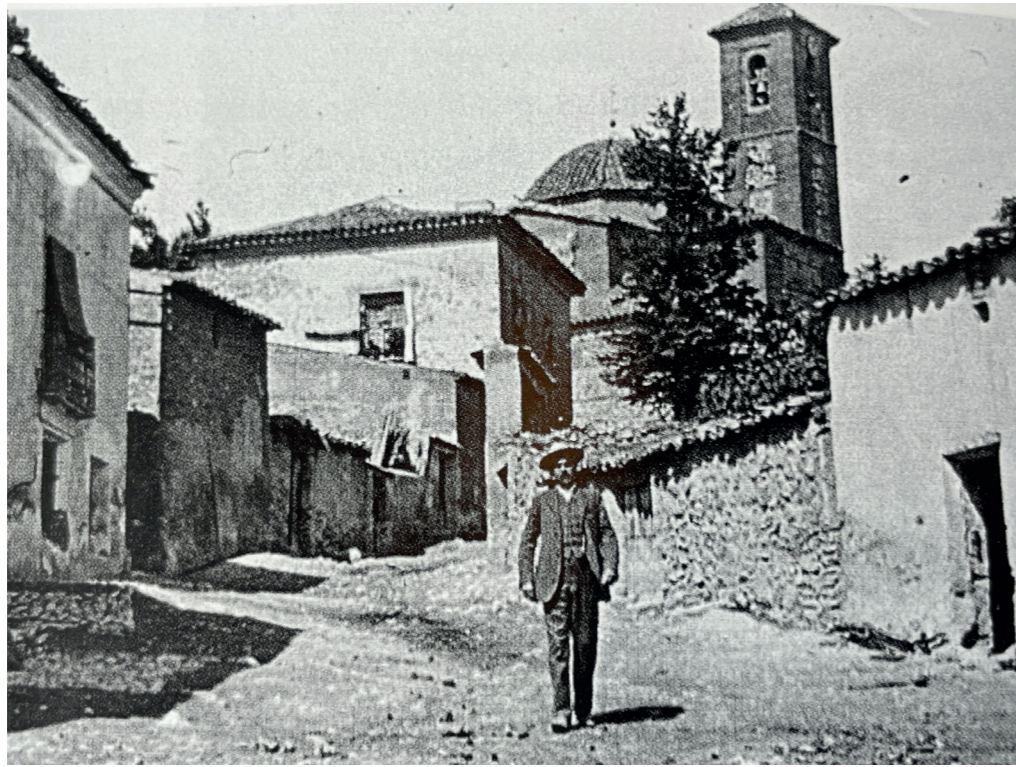
Orusco de Tajuña hacia 1900. En: Arquitectura y desarrollo, 2009.