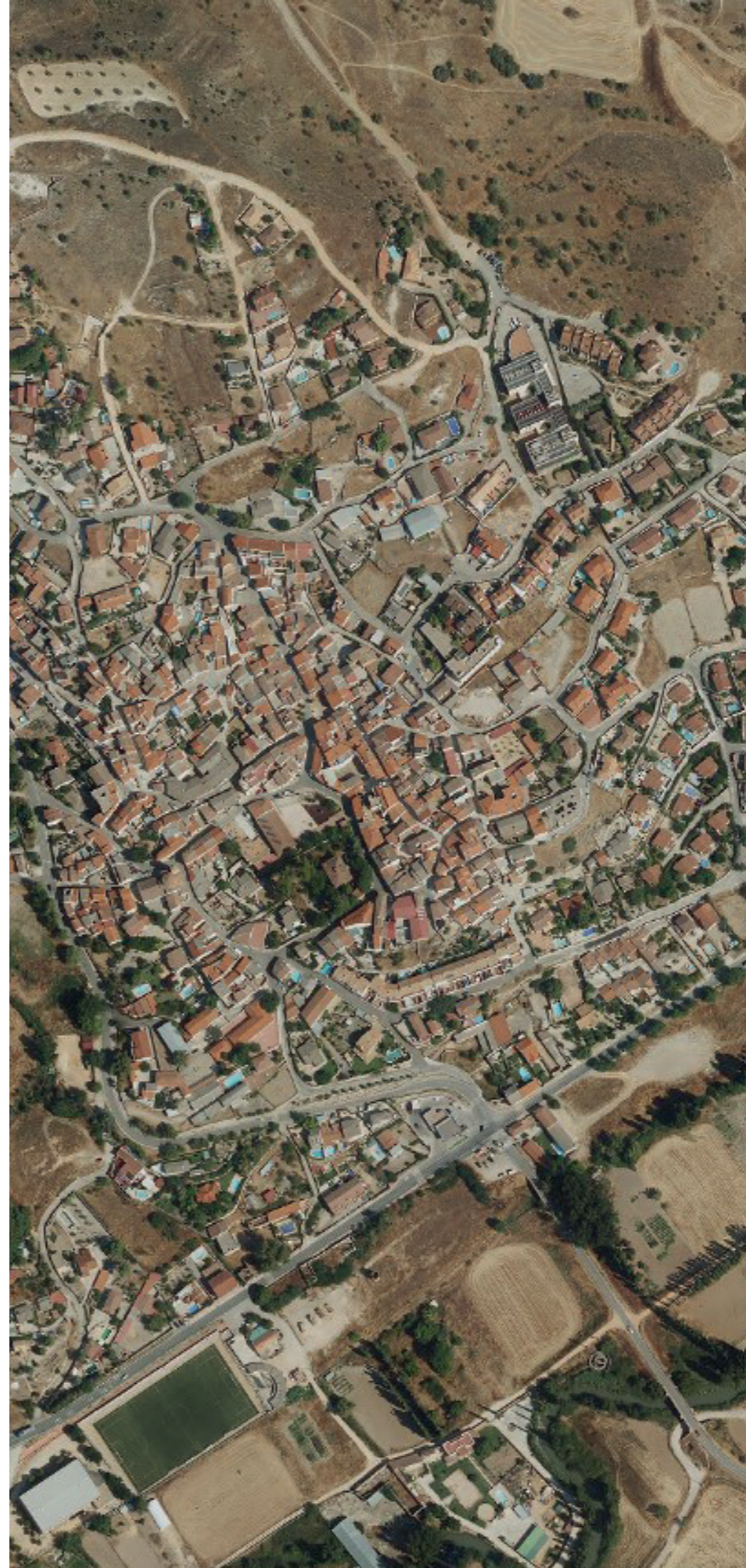
ORUSCO DE TAJUÑA EN 2022. FUENTE: CARTOMADRID