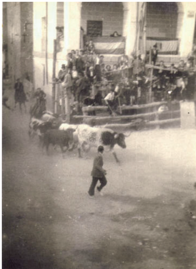
Encierro en la plaza, hacia 1920.