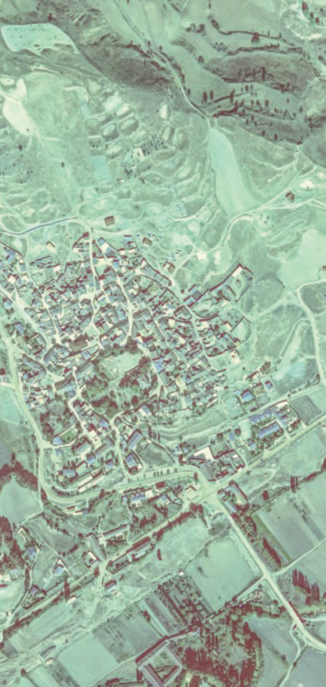
ORUSCO DE TAJUÑA EN 1980.