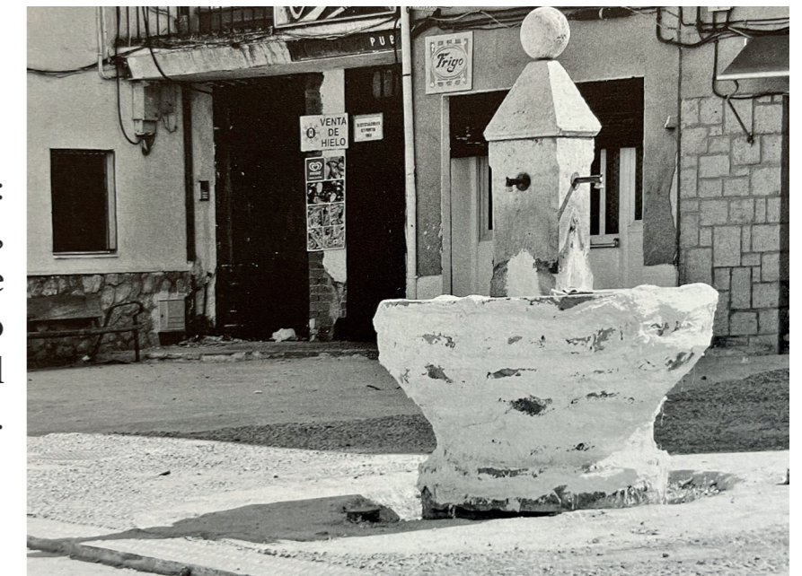
Fuente en la plaza. En: Arquitectura y desarrollo, 2009. Fuente: Centro de Documentación de Medio Ambiente y Ordenación del Territorio.