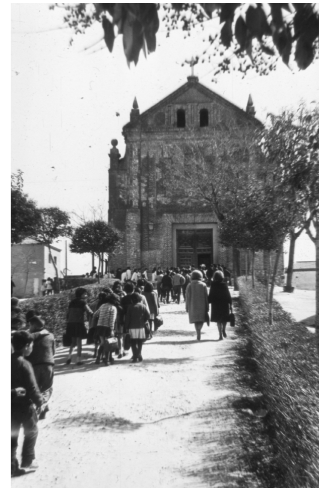
Ermita de Nuestra Señora de los Santos, 1965.