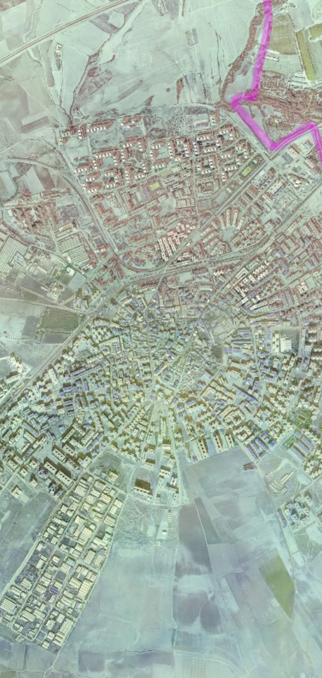
MÓSTOLES EN 1980.