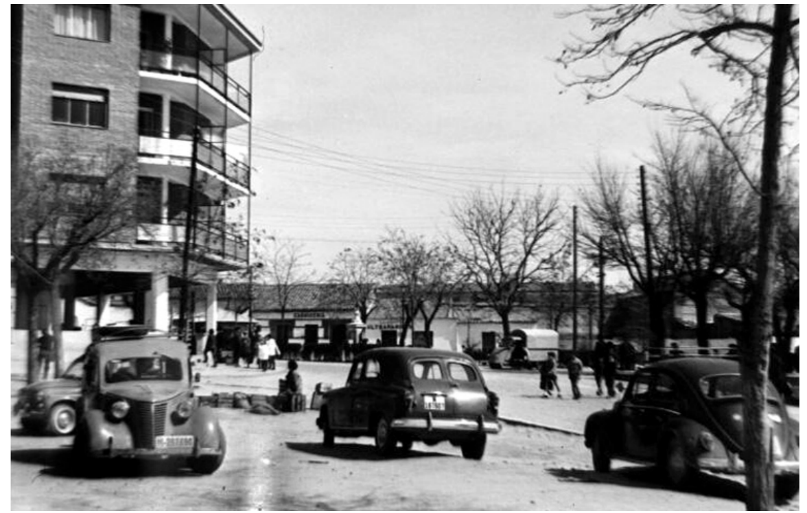
Plaza motorizada, 1960.