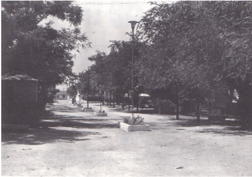
Parque antiguo, hoy plaza Pradillo, 1950.