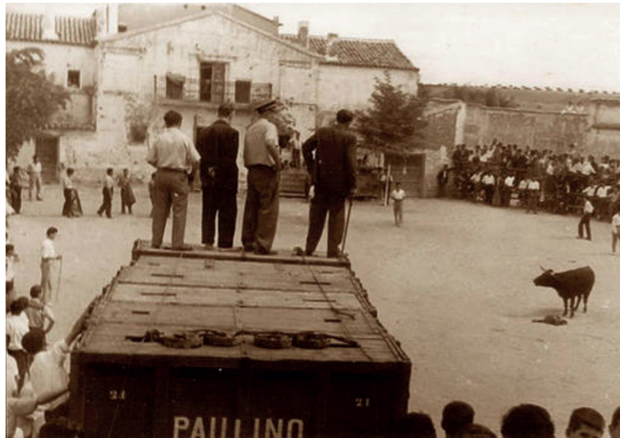
Fiestas en la plaza, 1950.