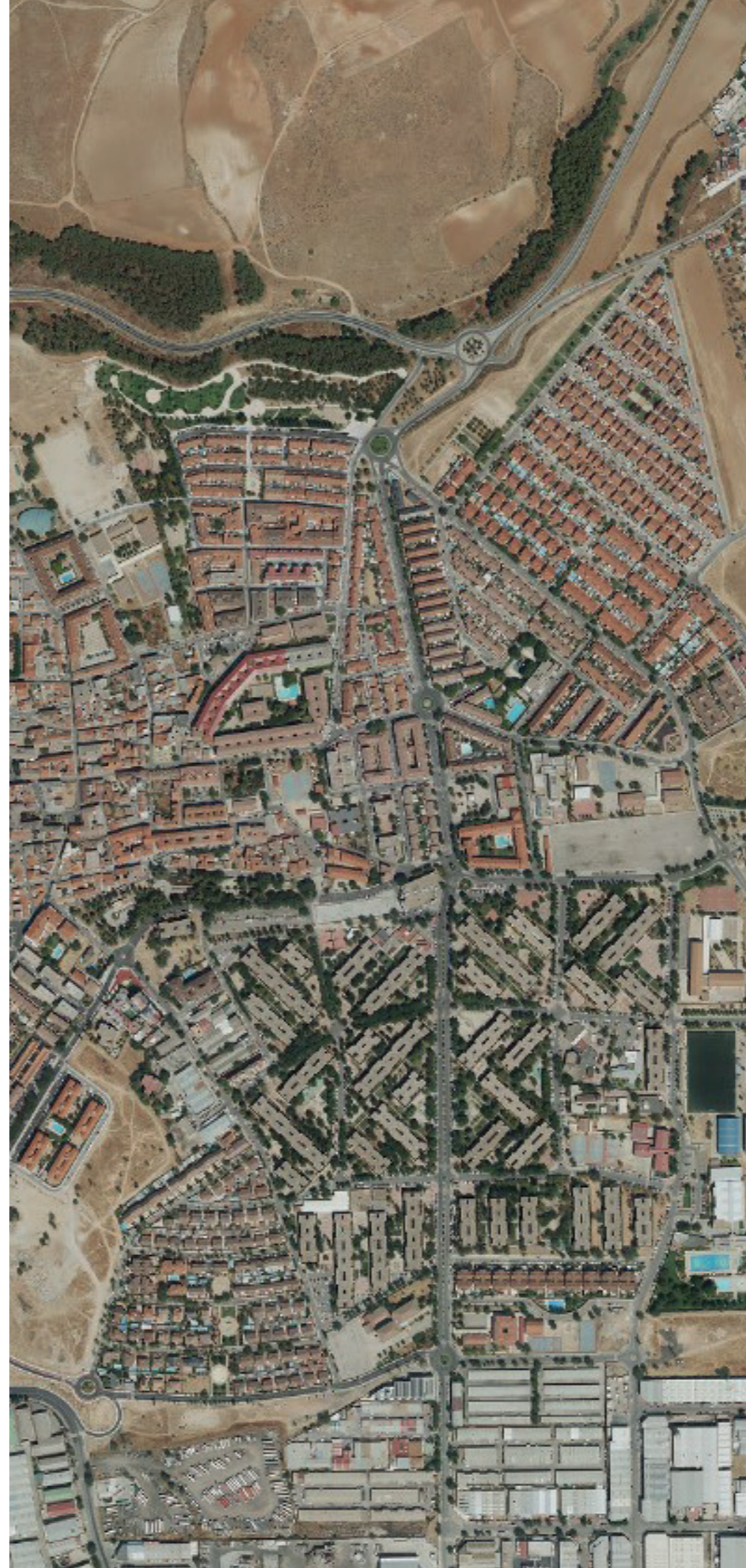
MEJORADA DEL CAMPO EN 2022. FUENTE: CARTOMADRID