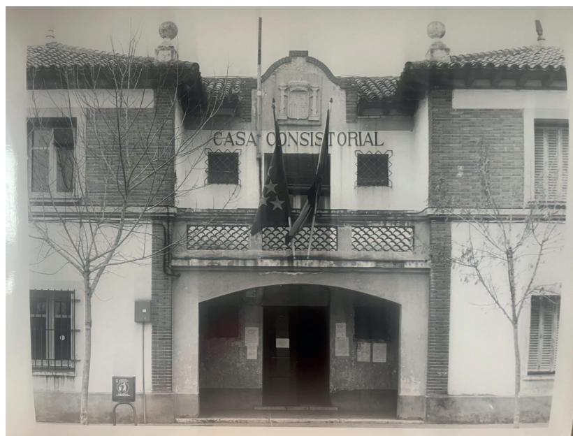
Ayuntamiento, 1991.