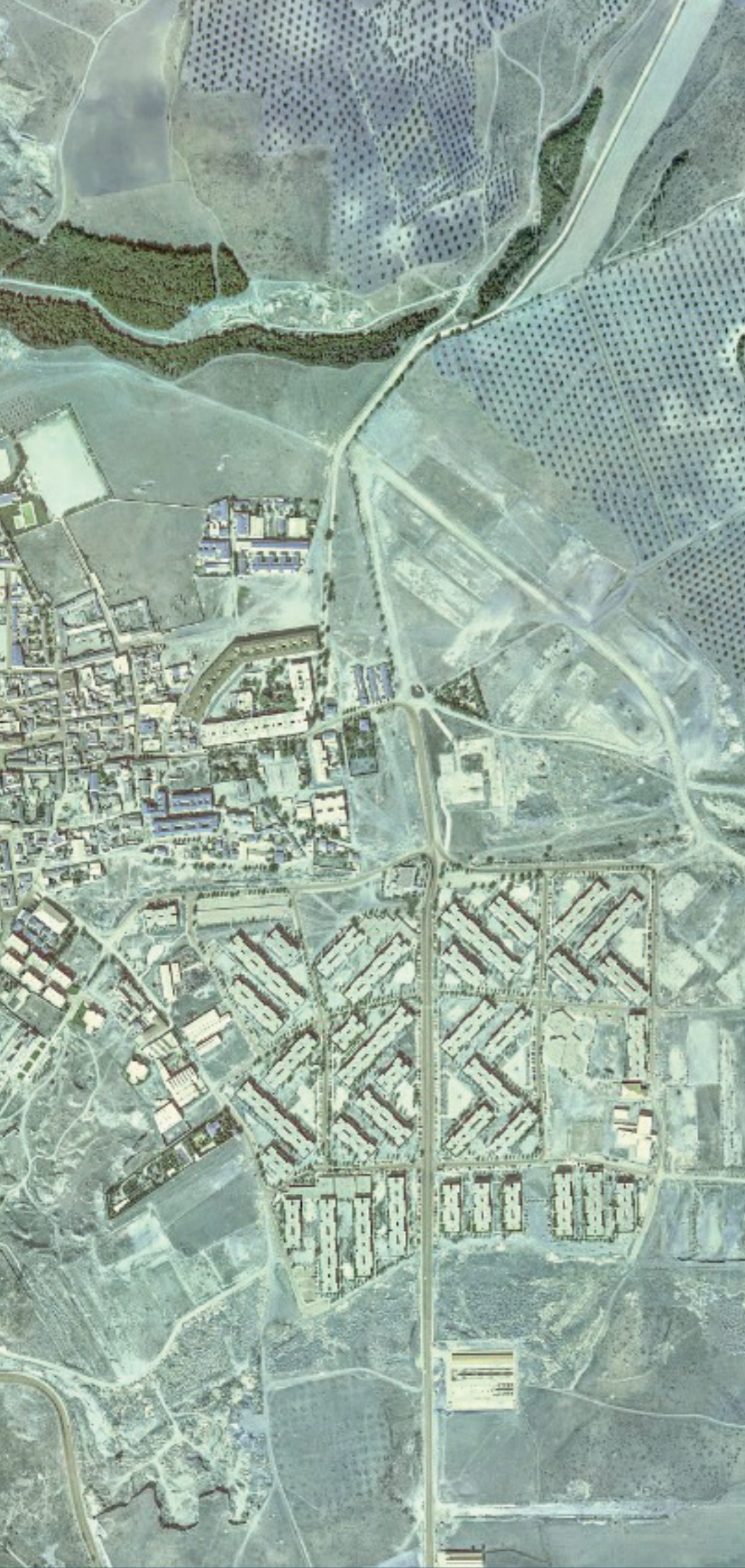
MEJORADA DEL CAMPO EN 1980.