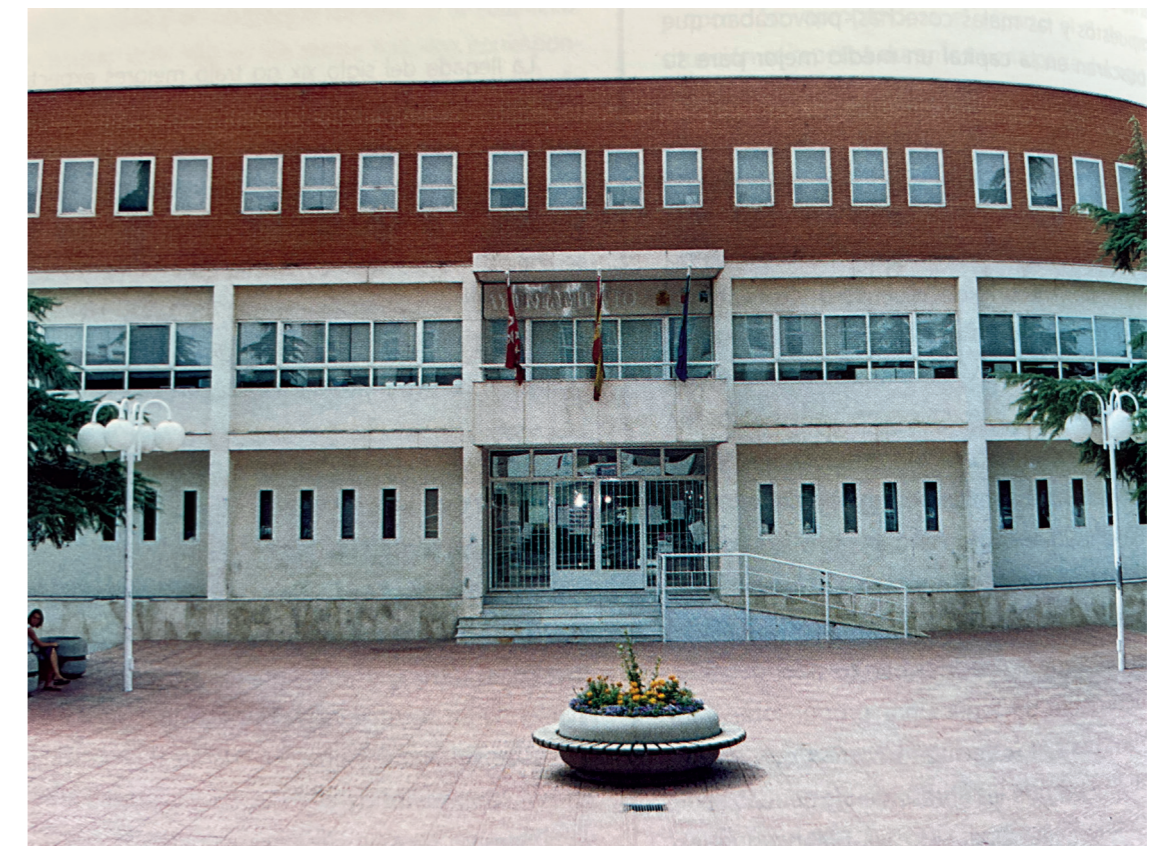
Nuevo Ayuntamiento. En: Plazas con historia, 2004.