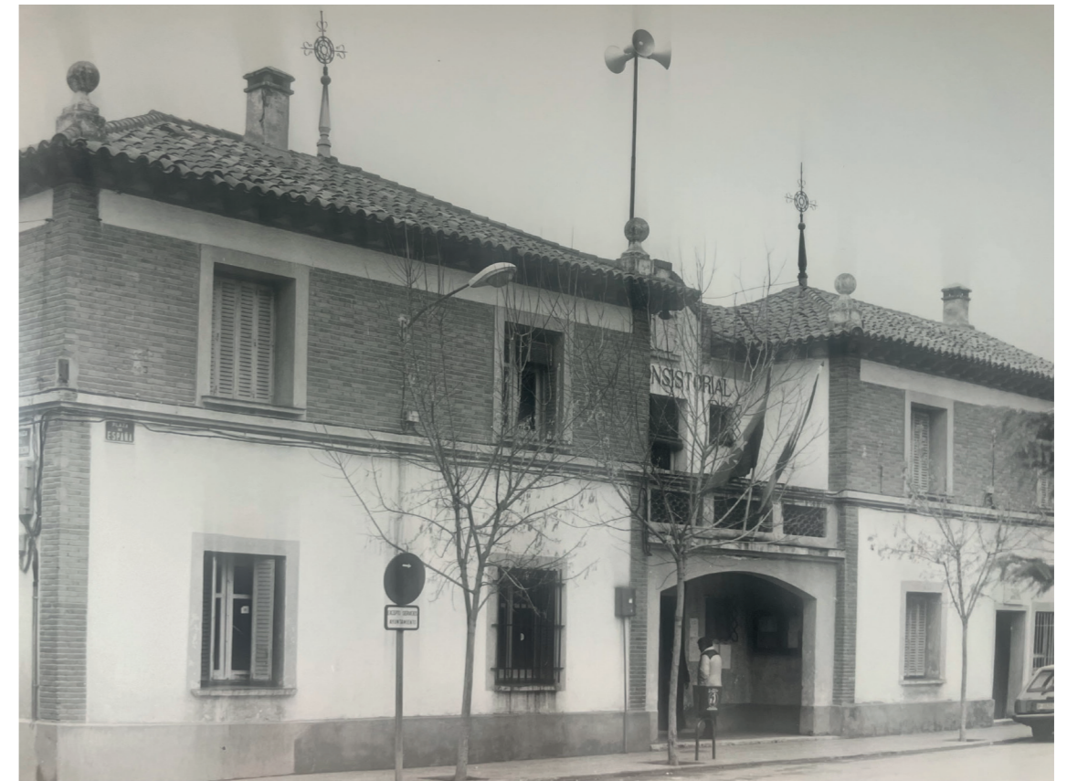
Ayuntamiento, 1991.