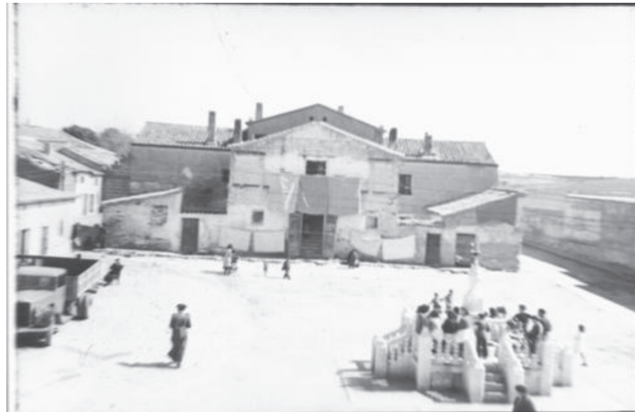
Plaza, sin fecha.