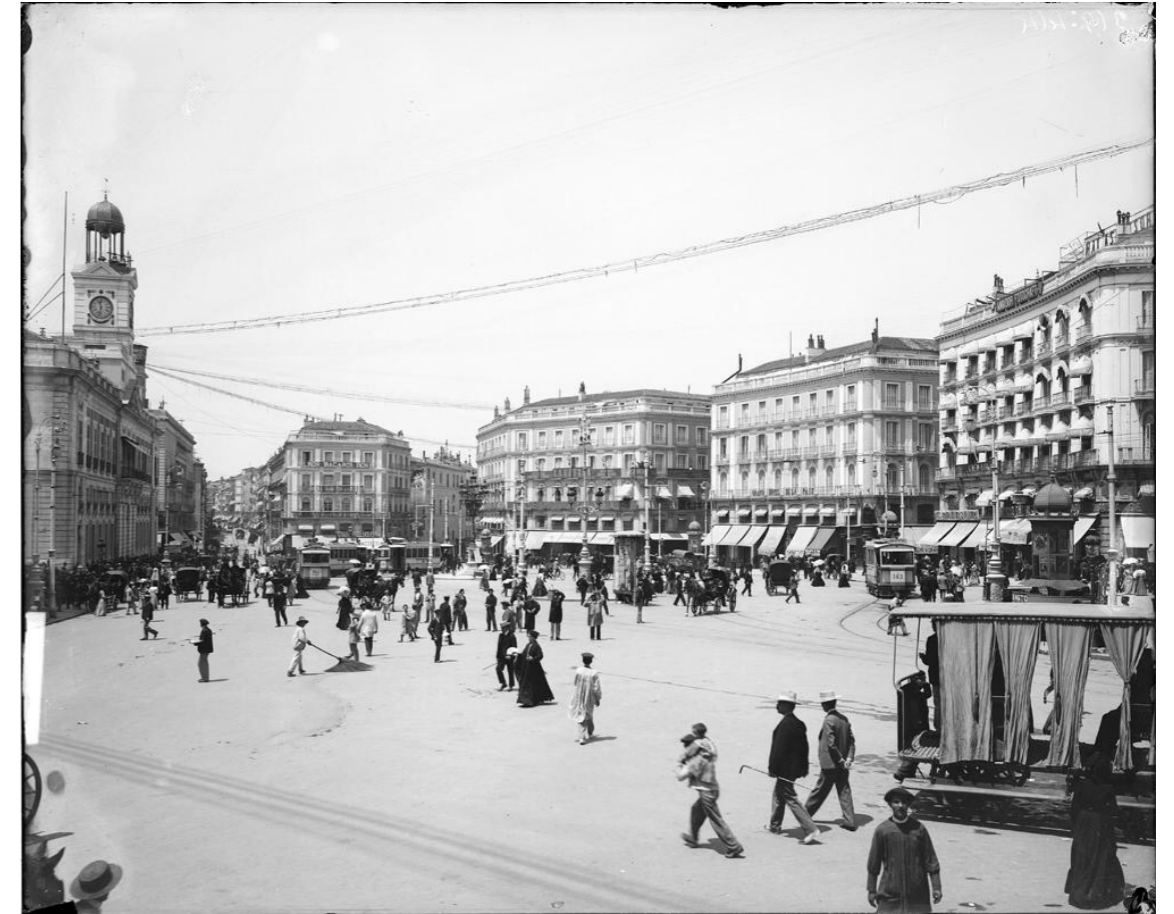
Vista general, 1910.