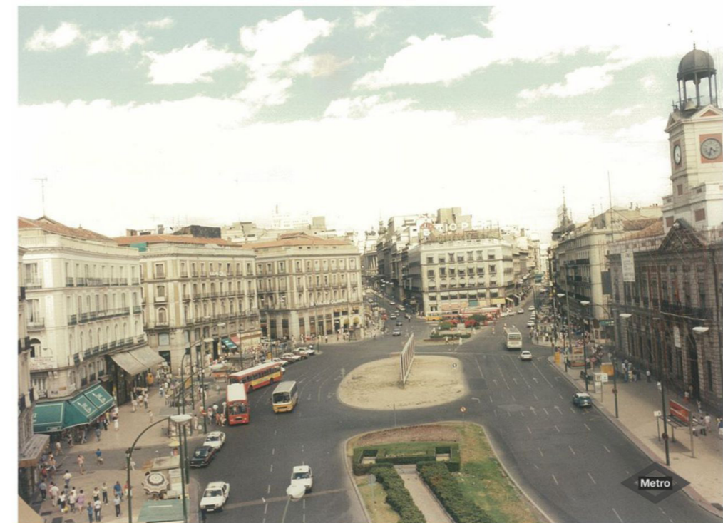
Vista general, 1986. Ayuntamiento de Madrid y Metro de Madrid.