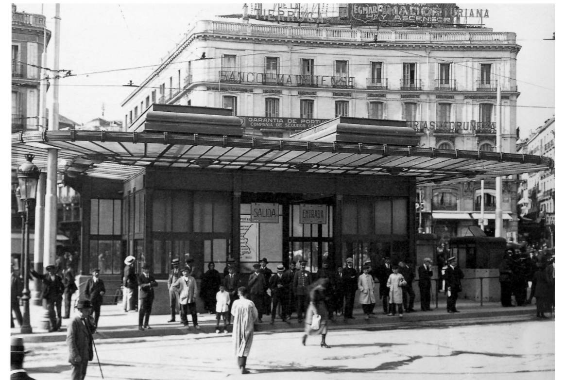
Metro de Madrid en su inicio, 1919.