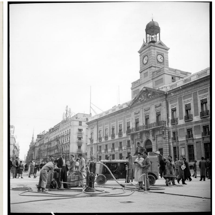
Vista general, 1950.