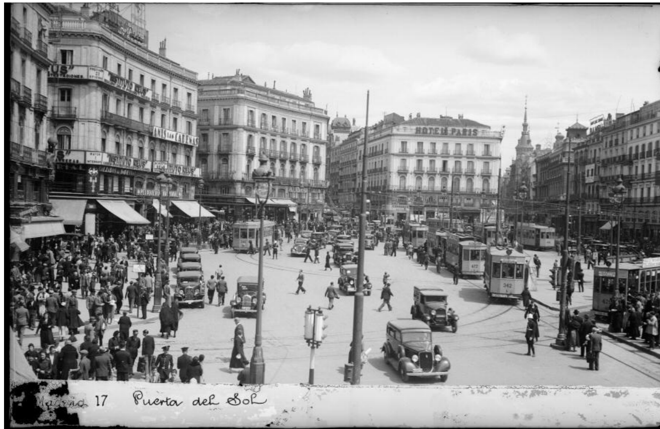
Vista general, entre 1927 y 1936.