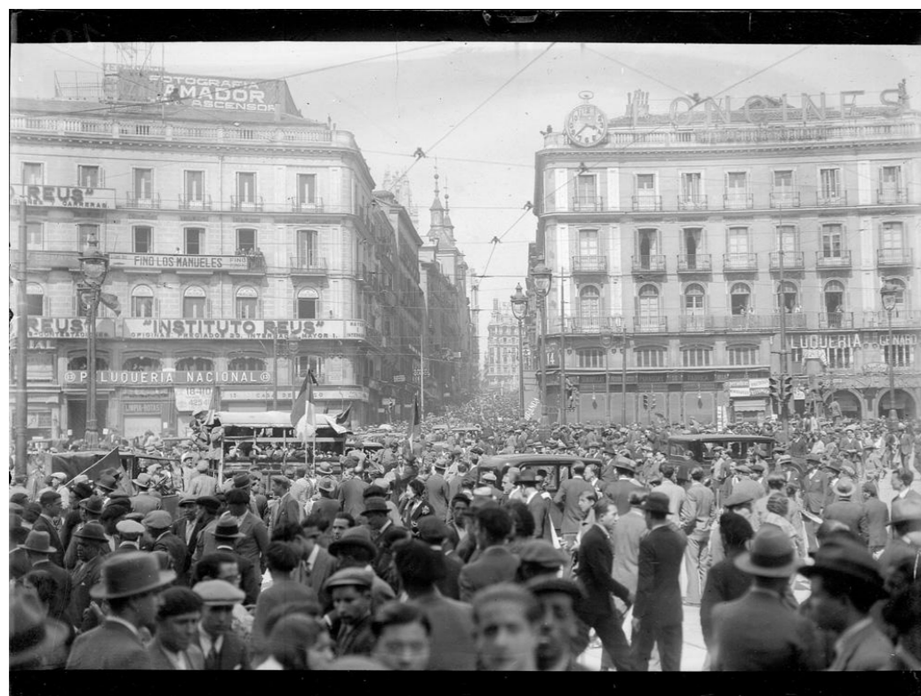
Proclamación de la República, 1931.