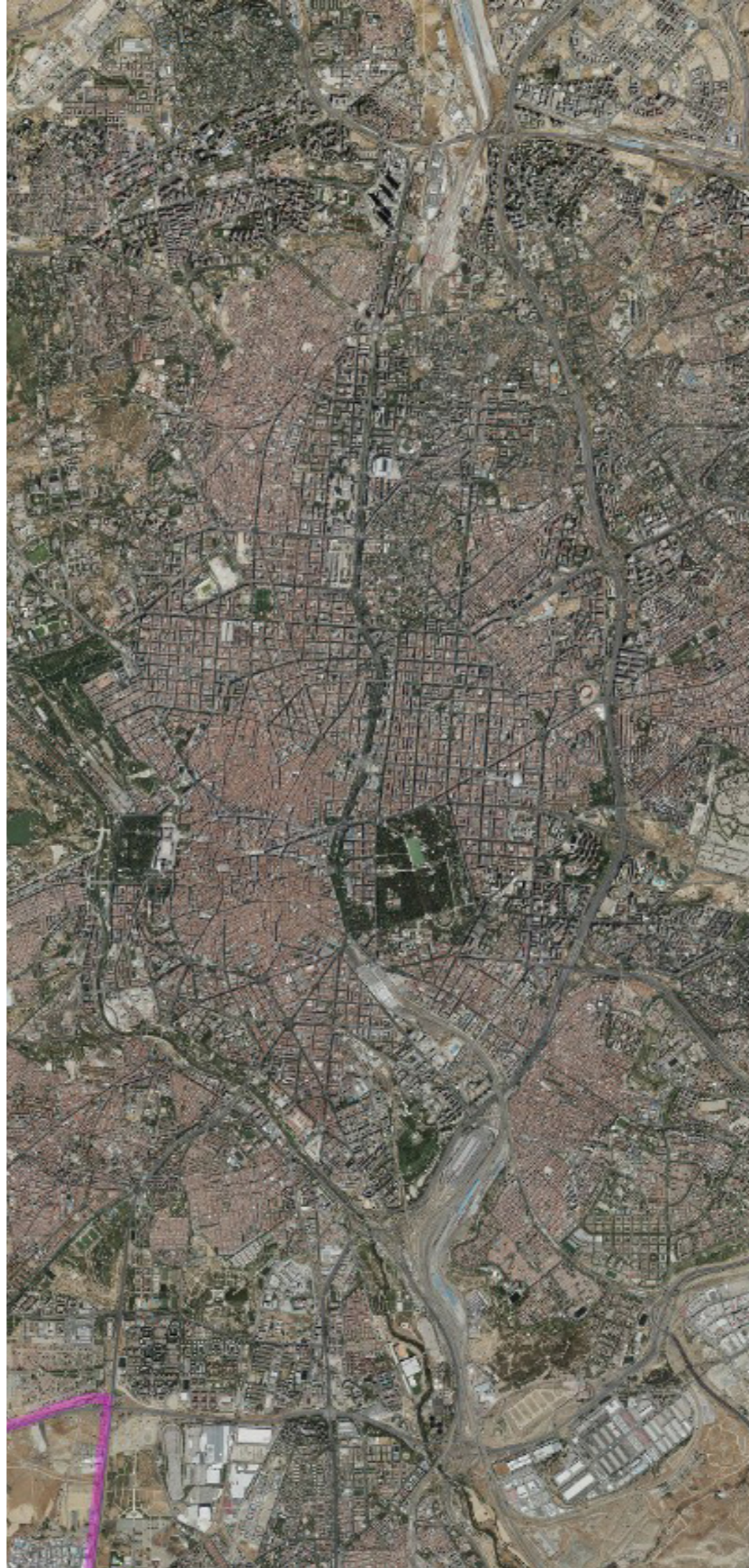
MADRID EN 2022.