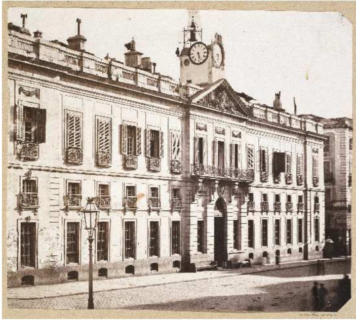
Edificio Real Casa de Correos antes 1860.