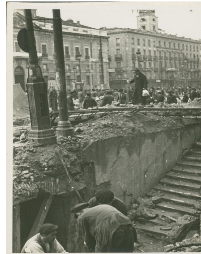
Sol en tiempo de guerra (1936-1939).