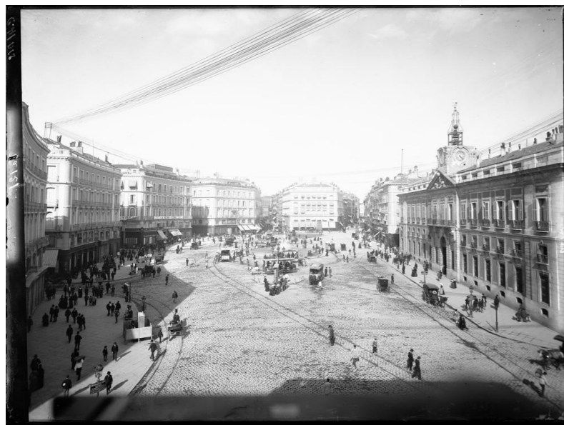
Vista general, hacia 1887.