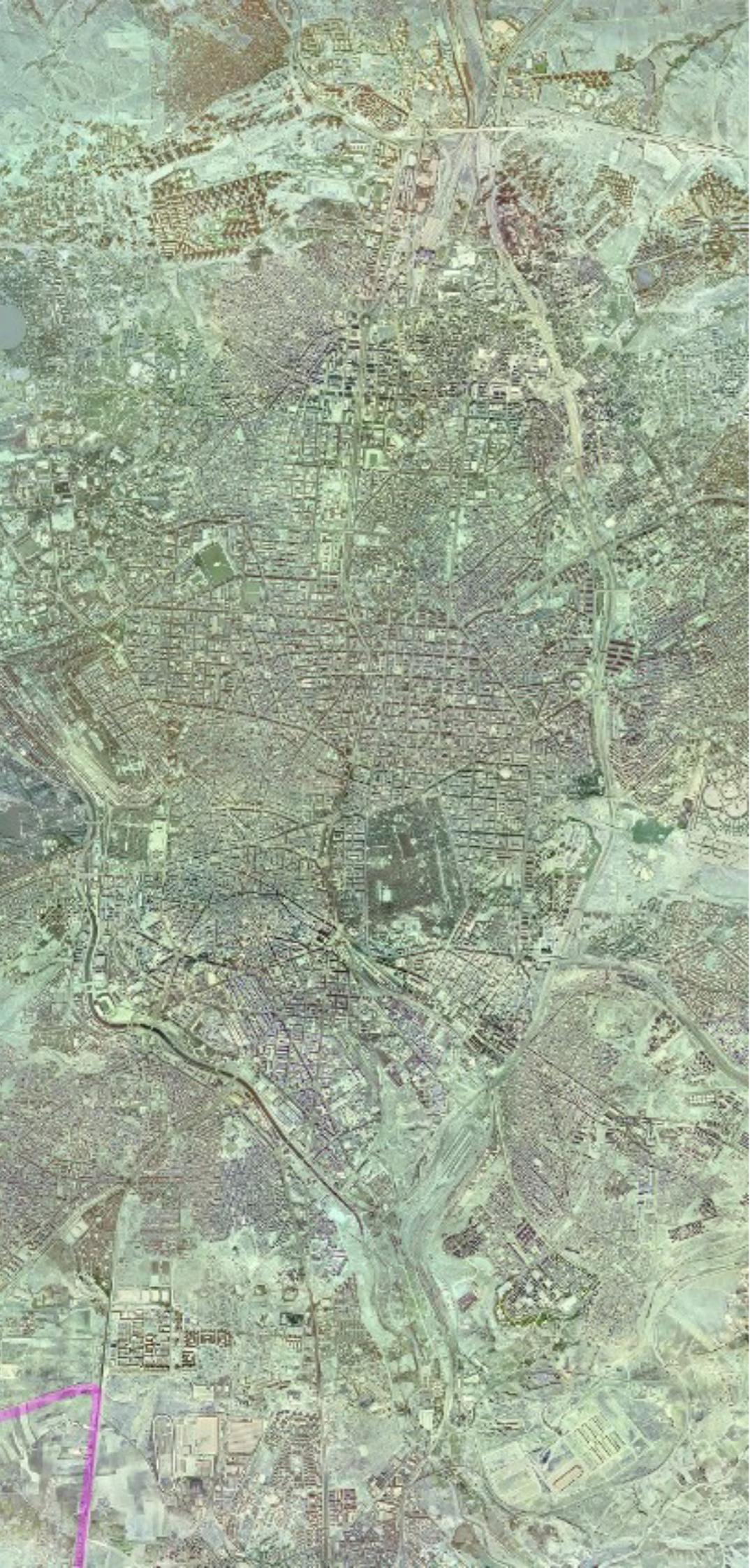
MADRID EN 1980.