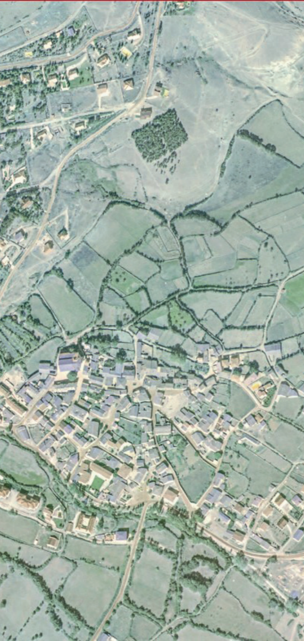
LOZOYA EN 1980. FUENTE: CARTOMADRID