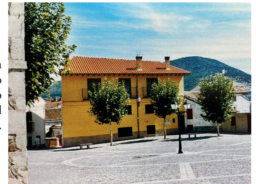
Plaza Mayor. En: Plazas con historia, 2004.