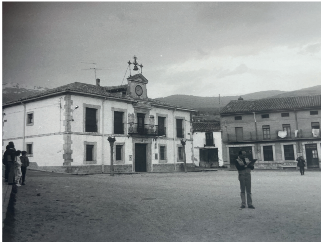
Plaza Mayor. En: Información, clasificación y normativa para los cascos antiguos de la Zona Norte del ámbito de la Comunidad Autónoma de Madrid, 1984.