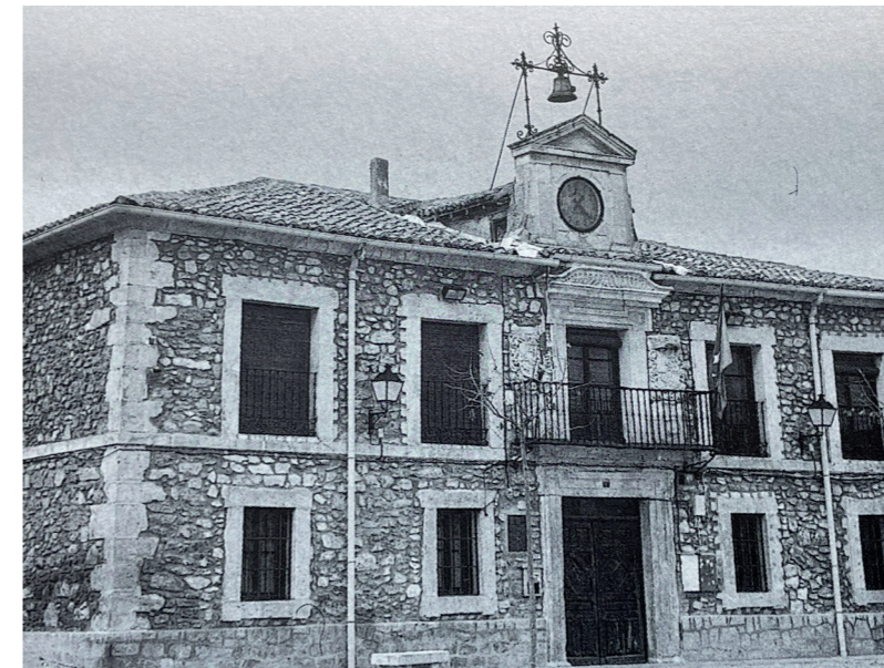
Fachada Ayuntamiento. En: Arquitectura y desarrollo, 1991.