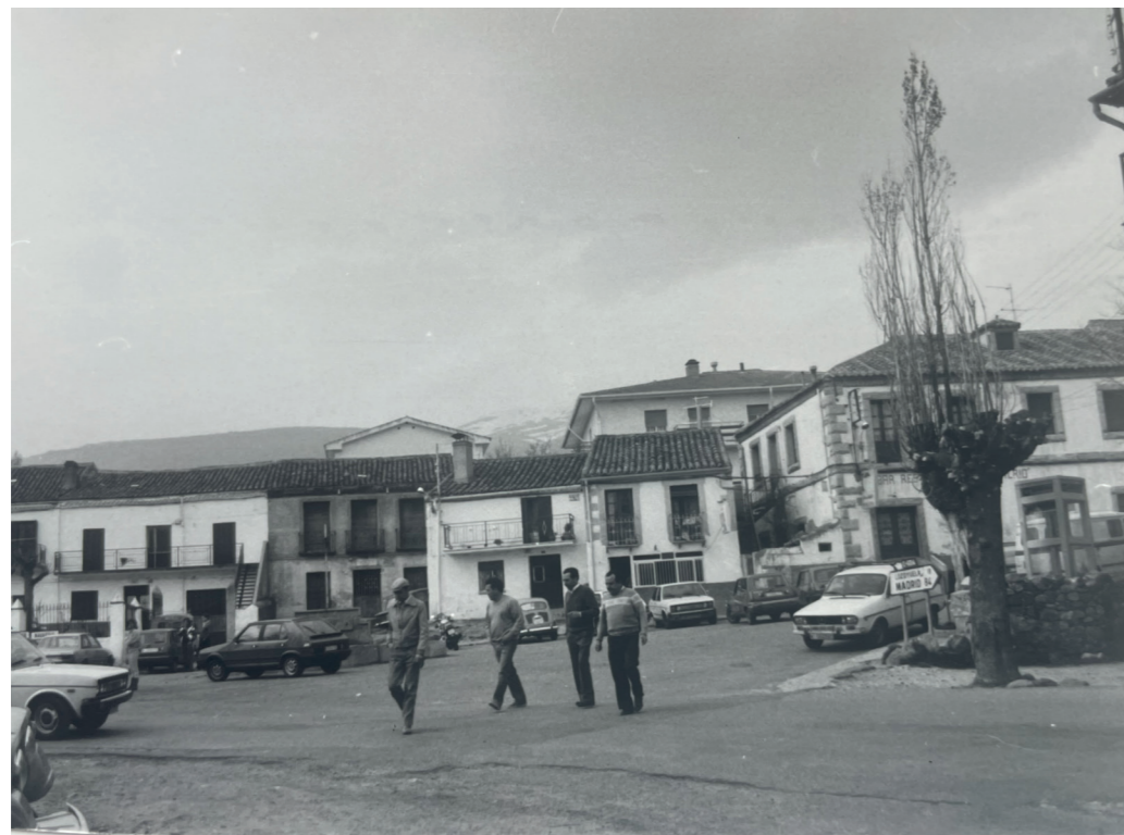
Plaza Mayor. En: Información, clasificación y normativa para los cascos antiguos de la Zona Norte del ámbito de la Comunidad Autónoma de Madrid, 1984.