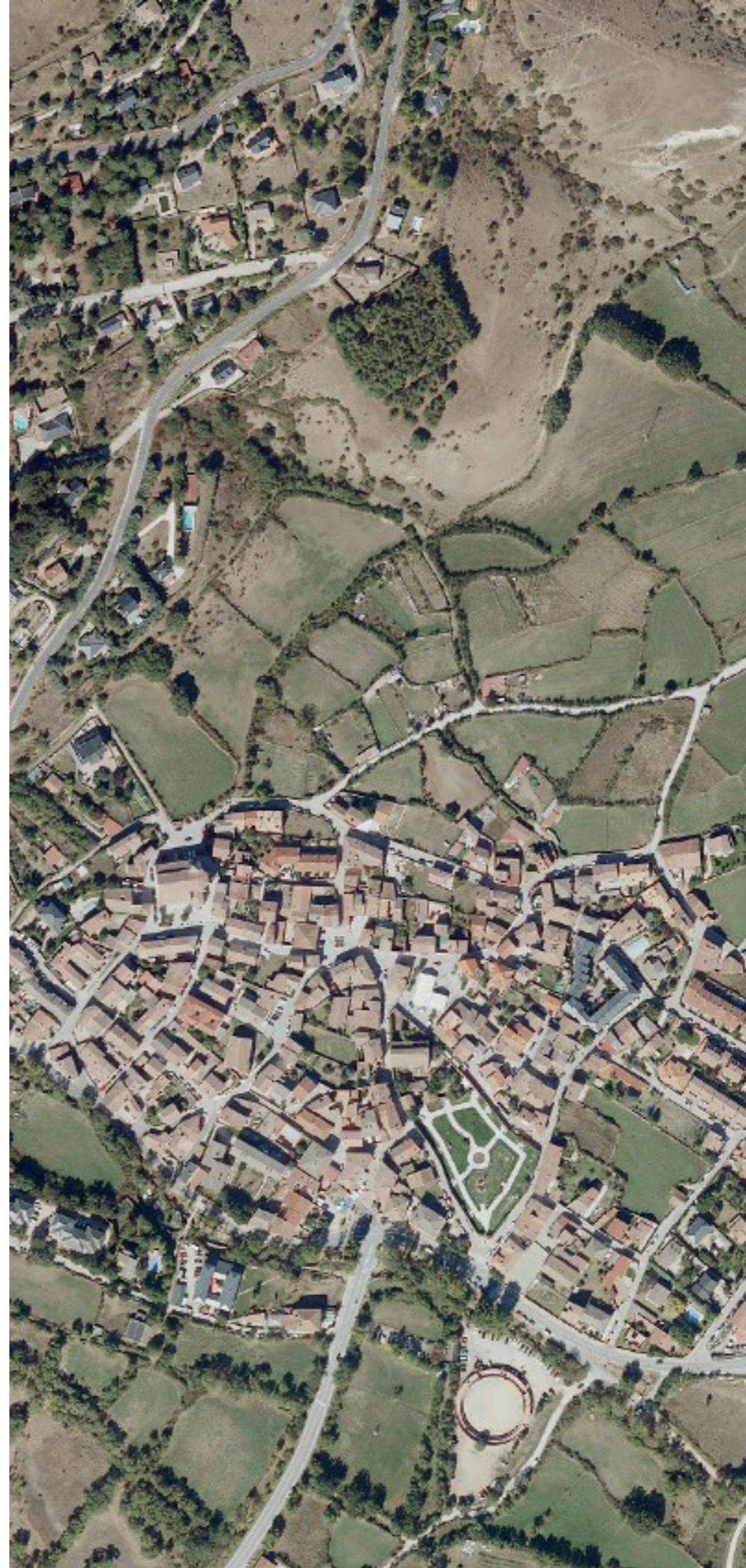
LOZOYA EN 2022. FUENTE: CARTOMADRID