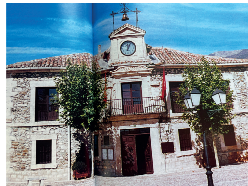
Fachada Ayuntamiento. En: Plazas con historia, 2004.