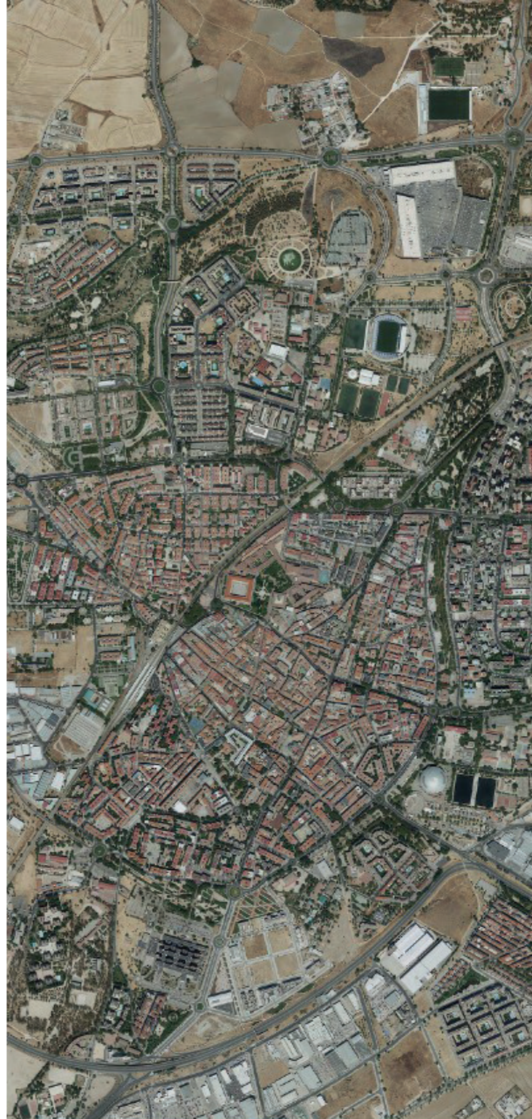
LEGANÉS EN 2022.