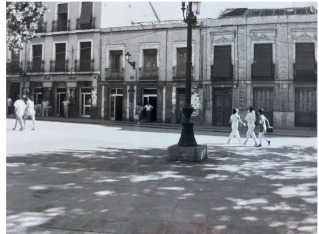
Viviendas. En: Catálogo de municipios de Madrid: Patrimonio edificado y urbano de la Corona Metropolitana de Madrid, 1996.