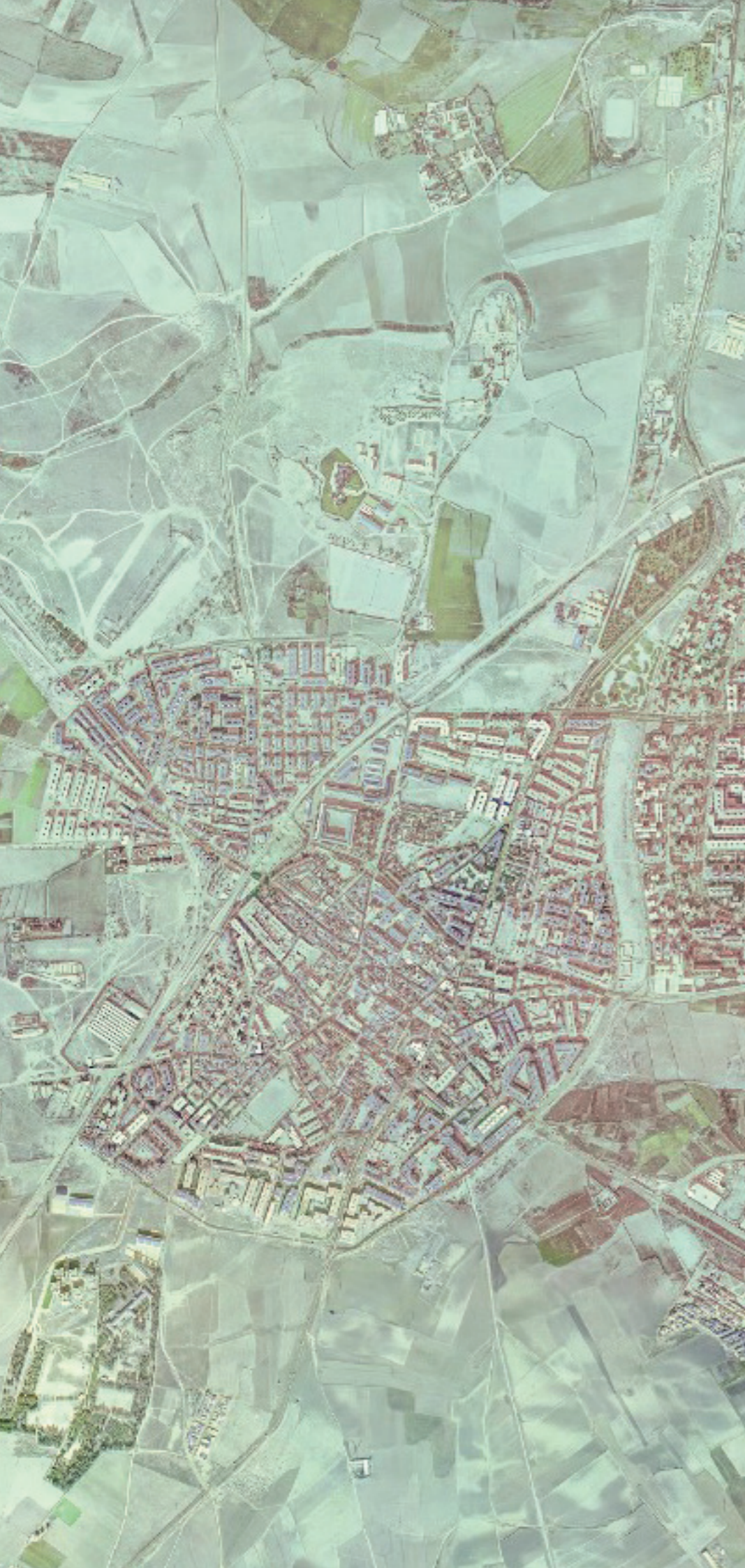
LEGANÉS EN 1980. FUENTE: CARTOMADRID