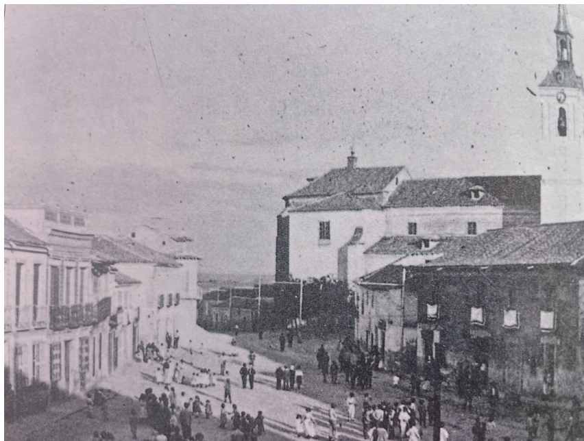
Plaza, finales siglo XIX. En: Arquitectura y desarrollo, 1991.