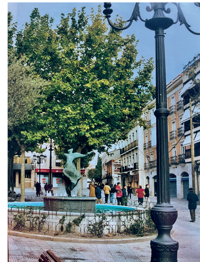
Plaza de España.