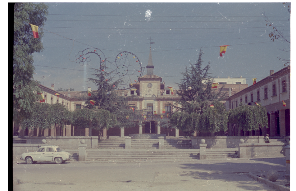
Ayuntamiento y plaza, 1974.