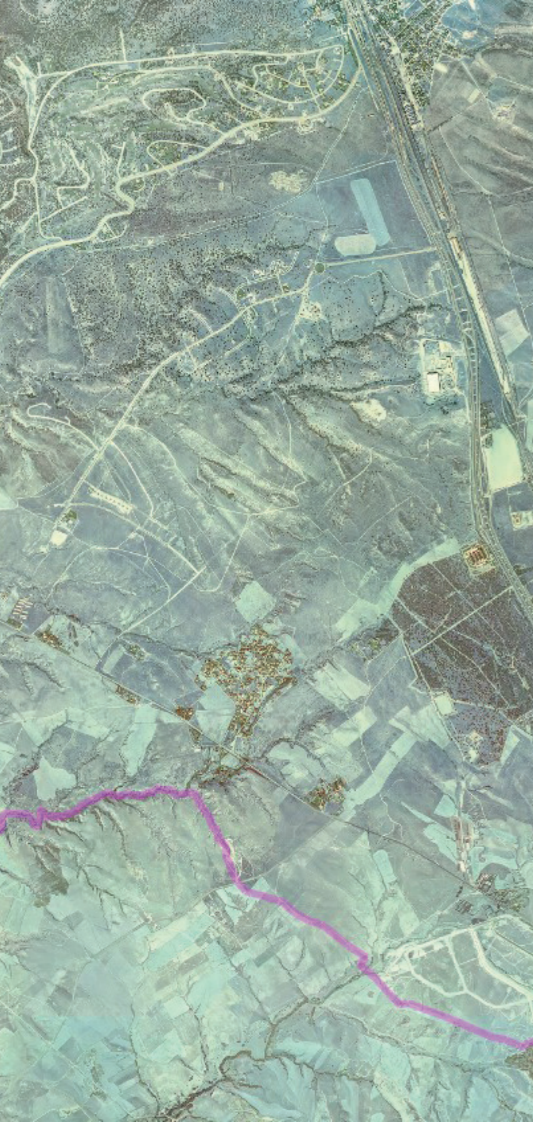
LAS ROZAS DE MADRID EN 1980. FUENTE: CARTOMADRID