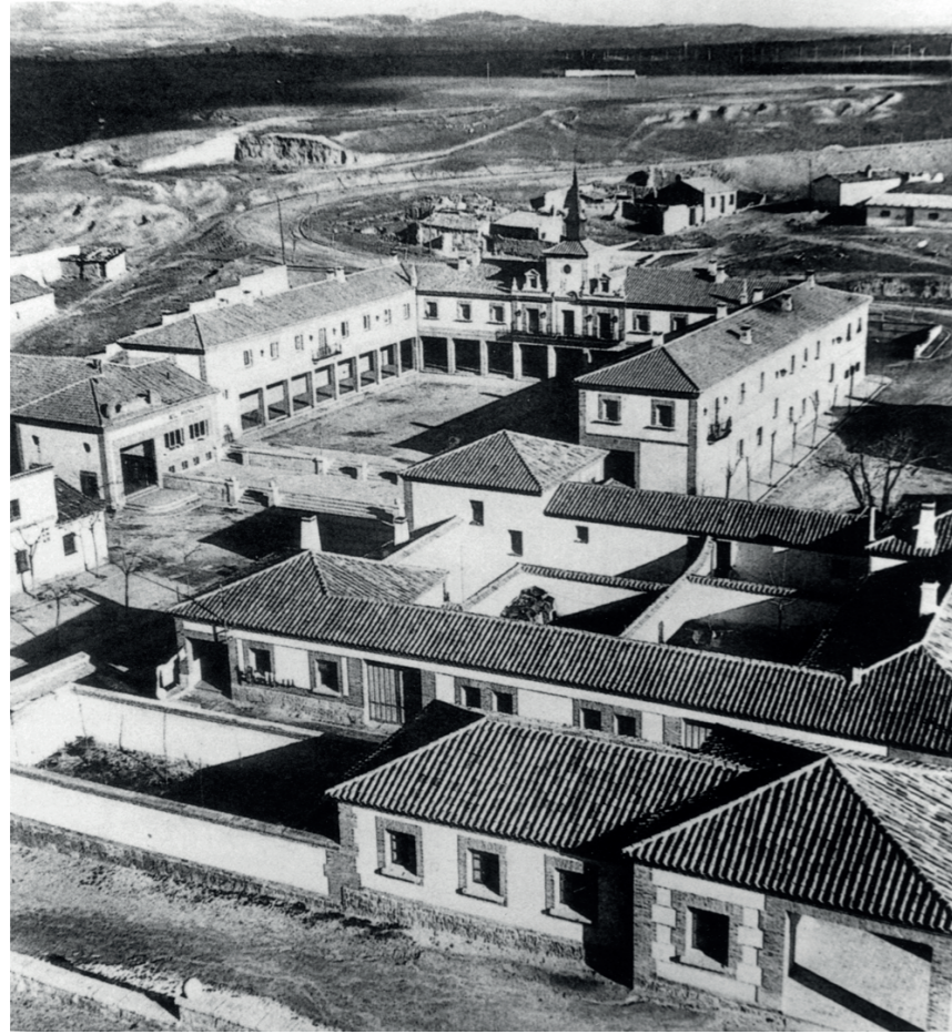
Vista de la plaza, años 50.