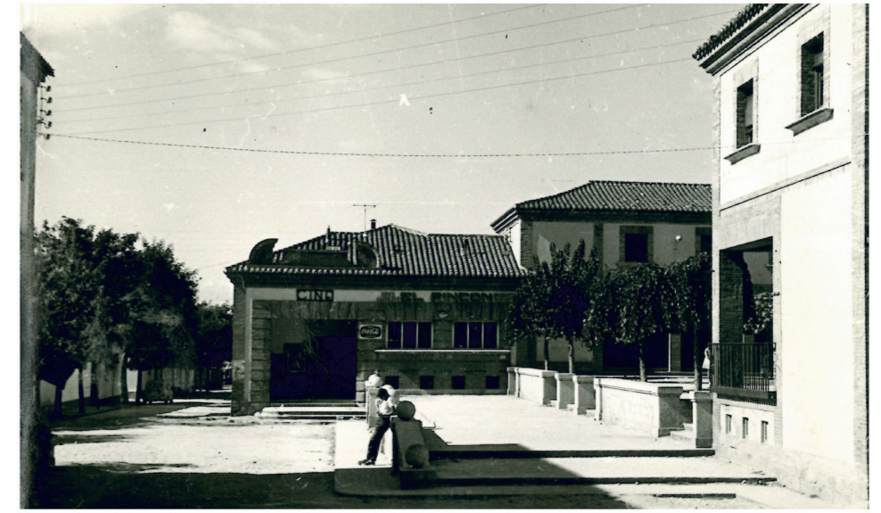
Cine en la plaza, años 50.