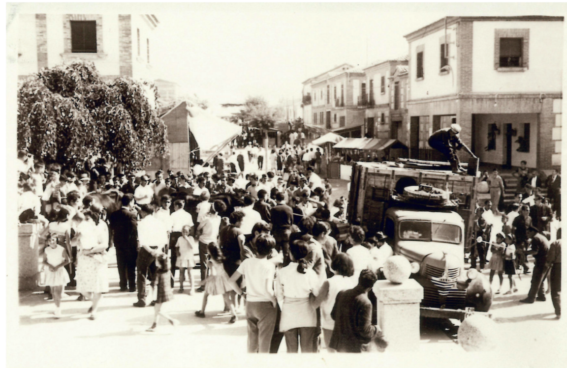
Fiestas de San Miguel, años 50.