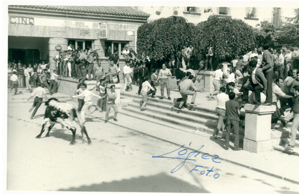
Encierro en la plaza, 1968.