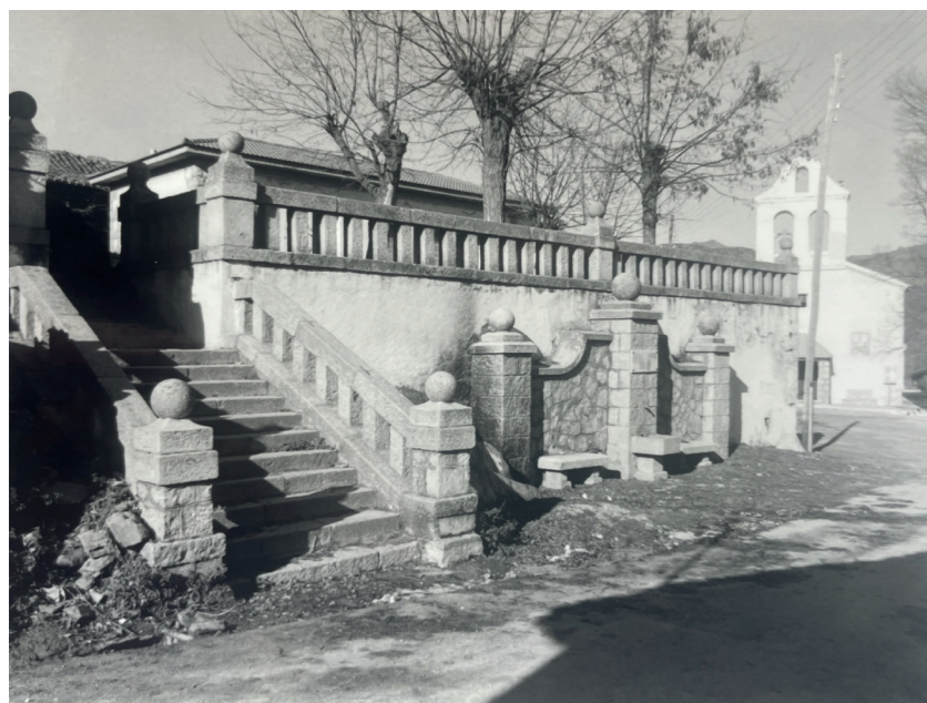
Plaza de la Constitución. En: Información, clasificación y normativa para los cascos antiguos de la Zona Norte del ámbito de la Comunidad Autónoma de Madrid, 1984.