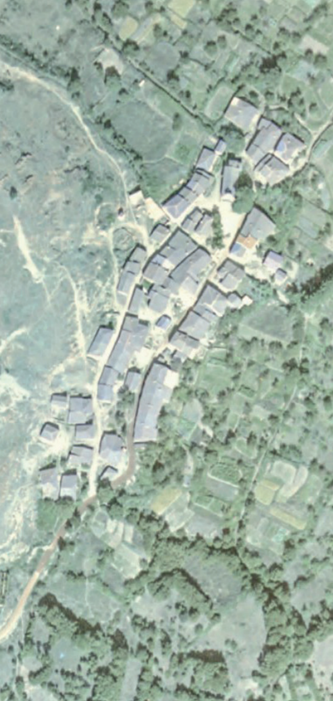
LA HIRUELA EN 1980.