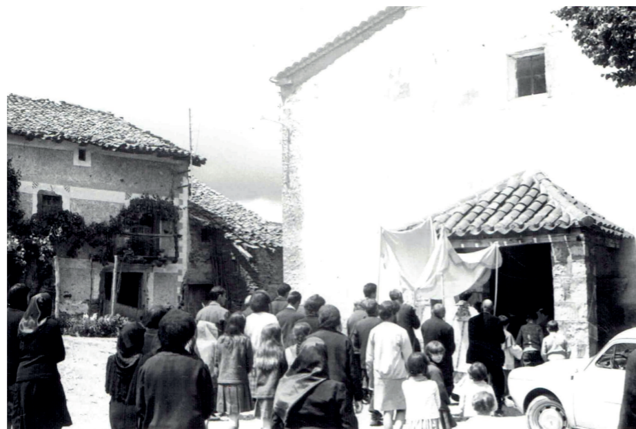
Plaza de San Miguel, años 50.