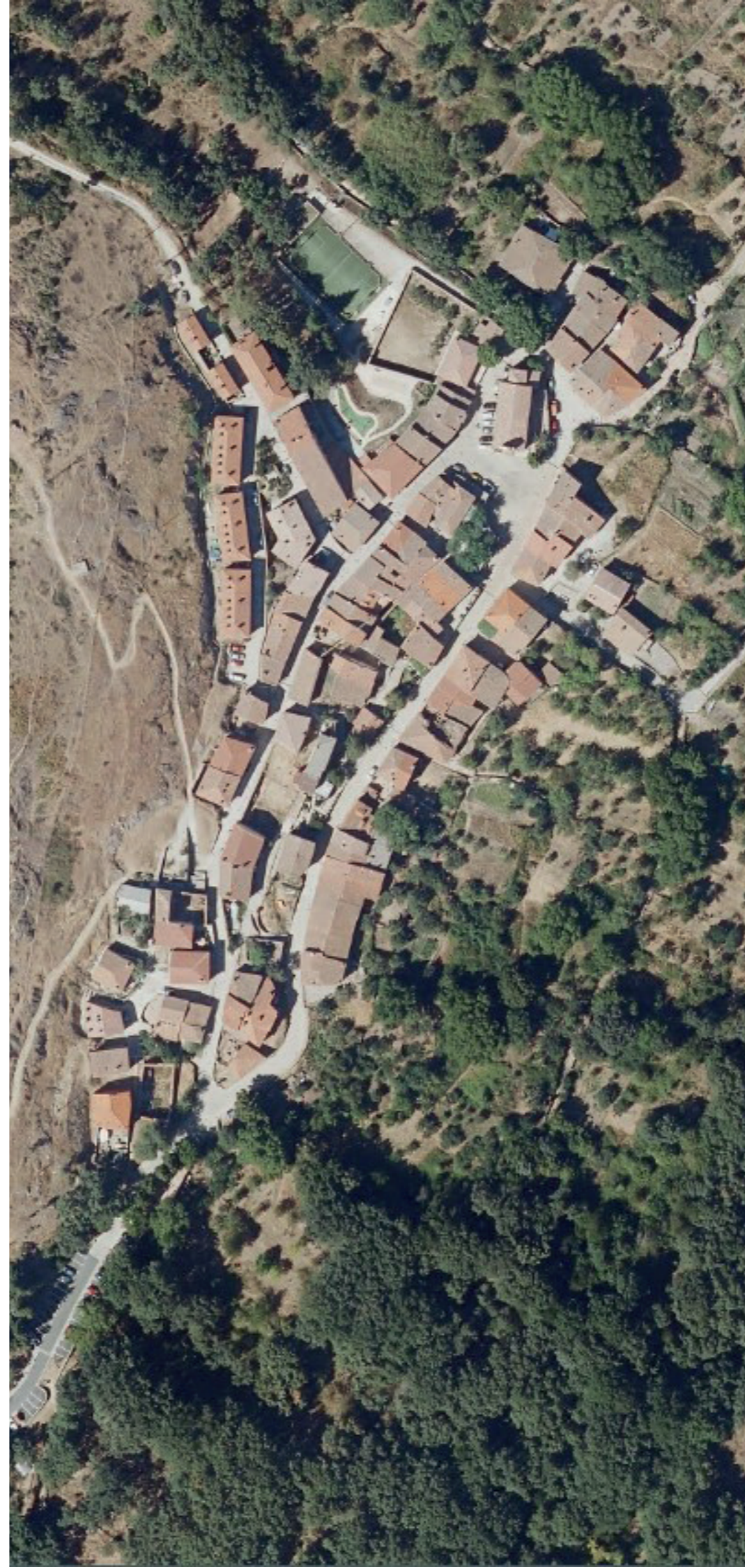
LA HIRUELA EN 2022. FUENTE: CARTOMADRID