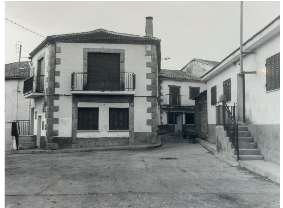
Plaza de la Constitución. En: Información, clasificación y normativa para los cascos antiguos de la Zona Norte del ámbito de la Comunidad Autónoma de Madrid, 1984.