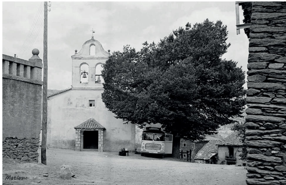
Plaza de San Miguel, años 50.