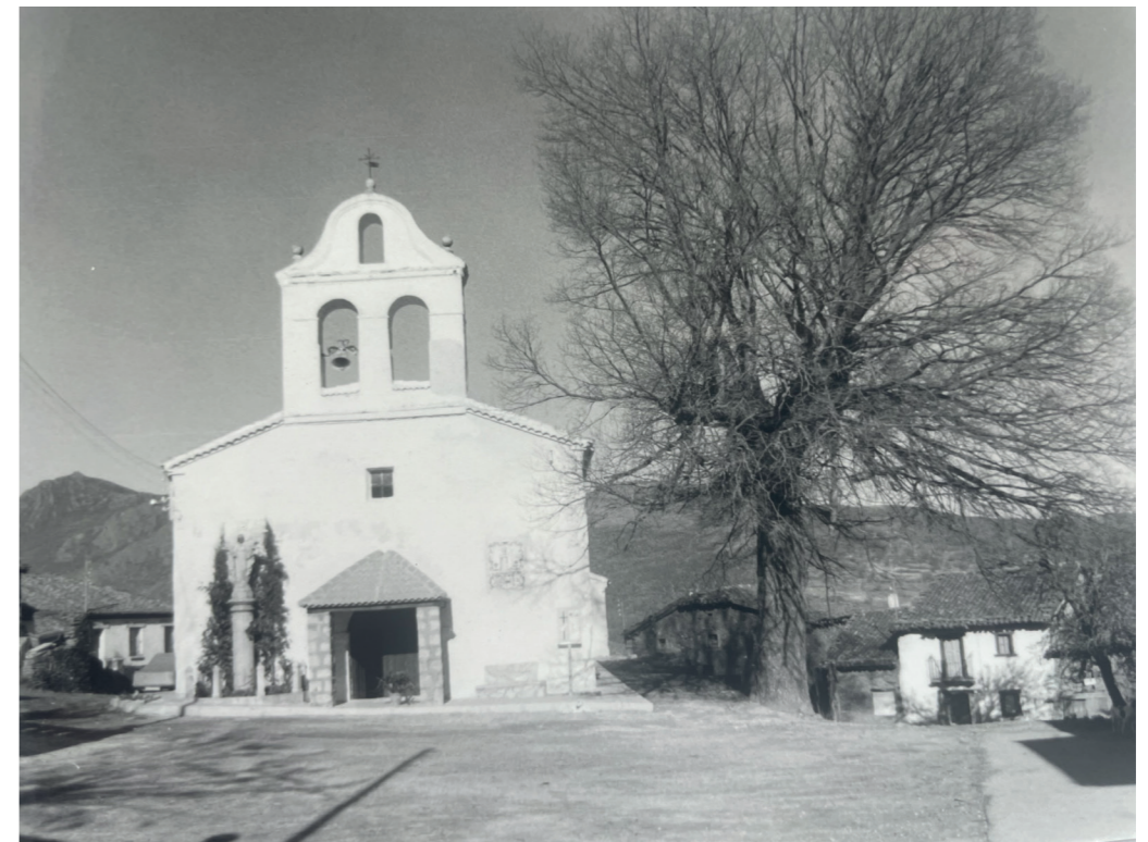
Plaza de la Constitución. En: Información, clasificación y normativa para los cascos antiguos de la Zona Norte del ámbito de la Comunidad Autónoma de Madrid, 1984. Fuente: Centro de Documentación de Medio Ambiente y Ordenación del Territorio.