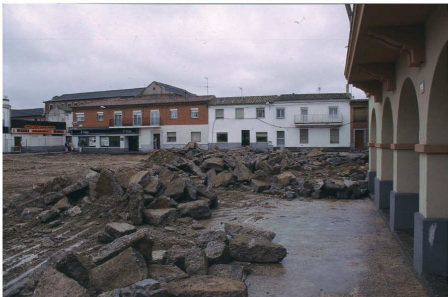
Remodelación Plaza Mayor, 1996.