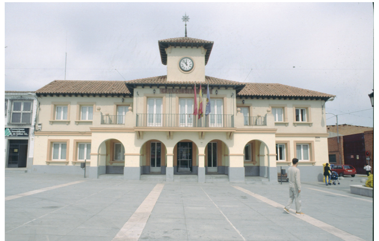
Ayuntamiento, año 2000.