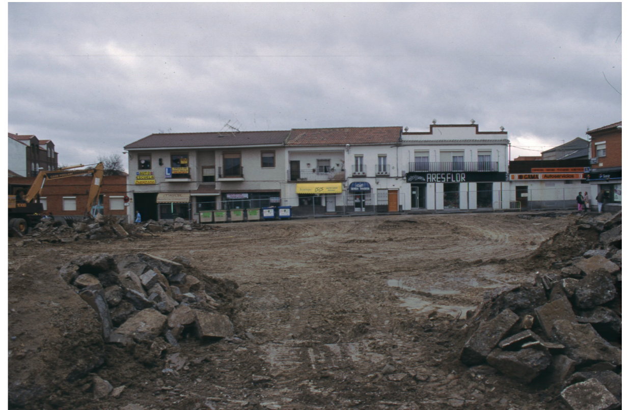
Remodelación Plaza Mayor, 1996.