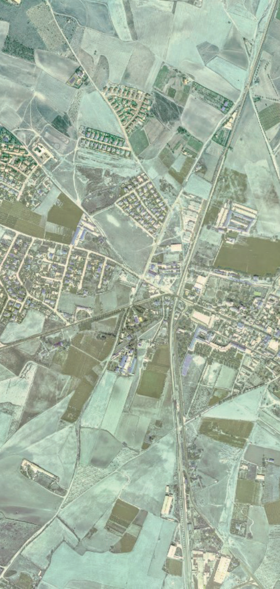
GRÍÑÓN EN 1980. FUENTE: CARTOMADRID