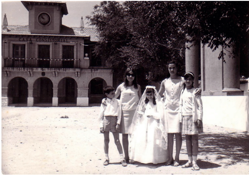
Plaza Mayor, 1987.