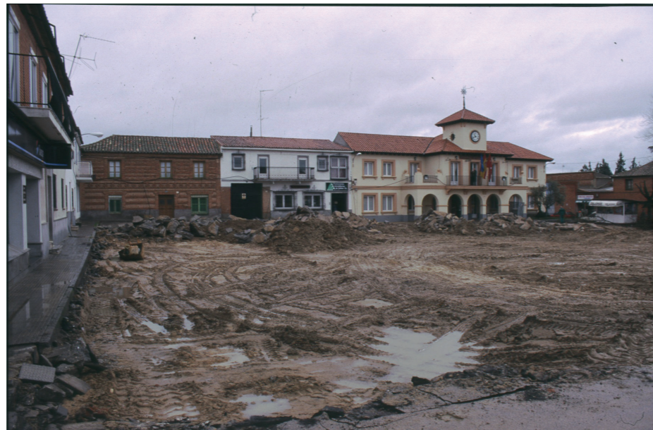
Remodelación Plaza Mayor, 1996.