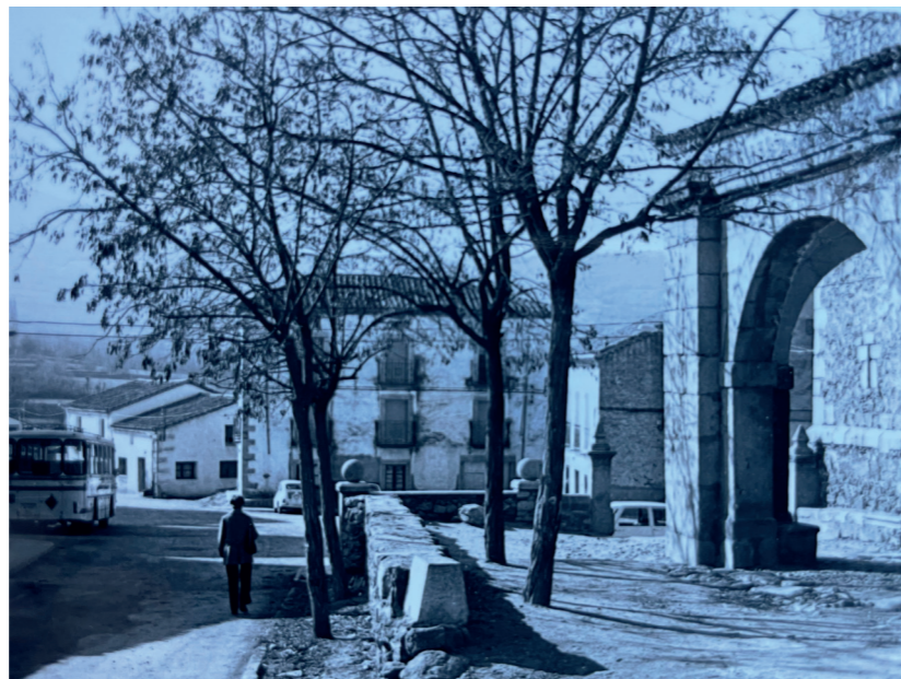
Vista arco entrada Iglesia San Pedro Apóstol. En: Información urbanística de 36 municipios: zona norte y noreste, 1979.