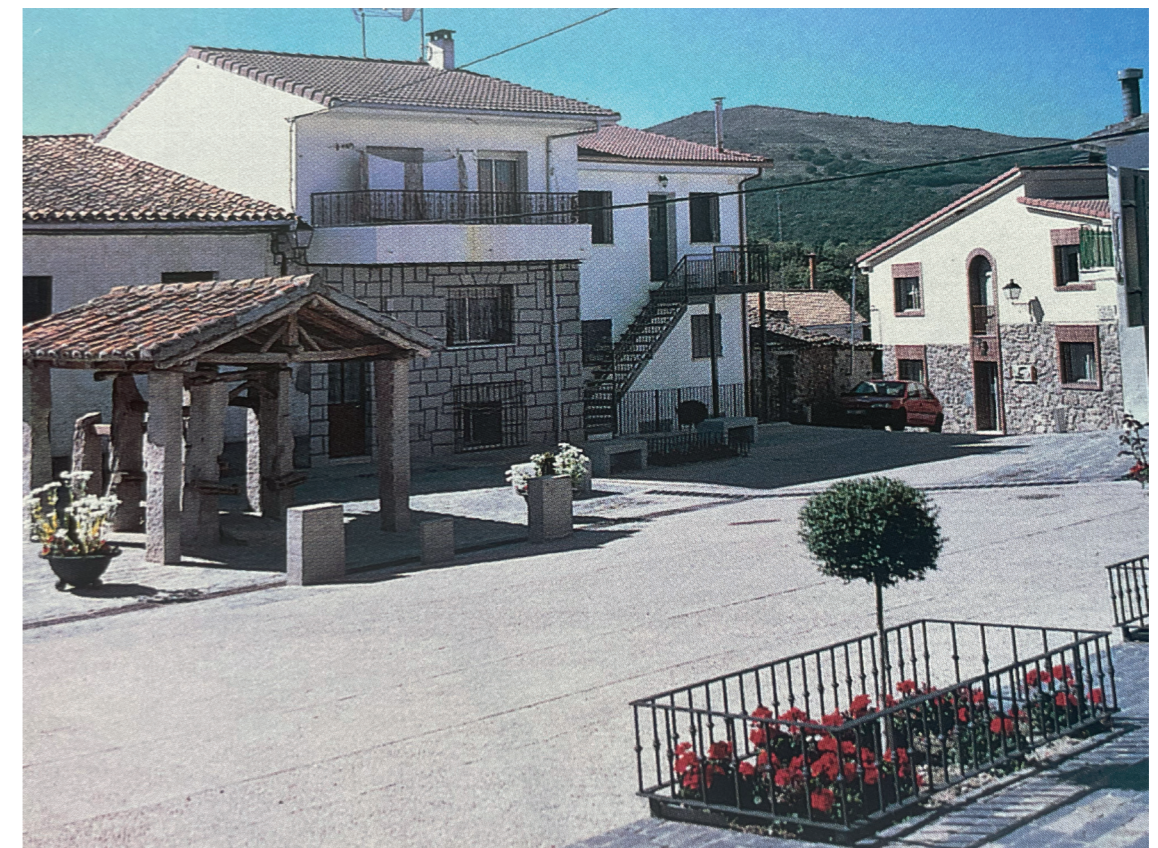
Acondicionamiento Plaza de San Pedro, año 2000.