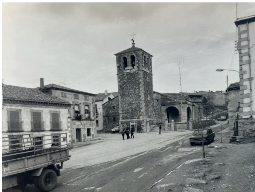
Plaza. En: Información, clasificación y normativa para los cascos antiguos de la Zona Norte del ámbito de la Comunidad Autónoma de Madrid, 1984.