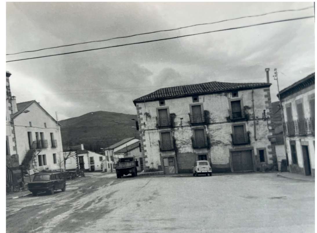
Plaza. En: Información, clasificación y normativa para los cascos antiguos de la Zona Norte del ámbito de la Comunidad Autónoma de Madrid, 1984.