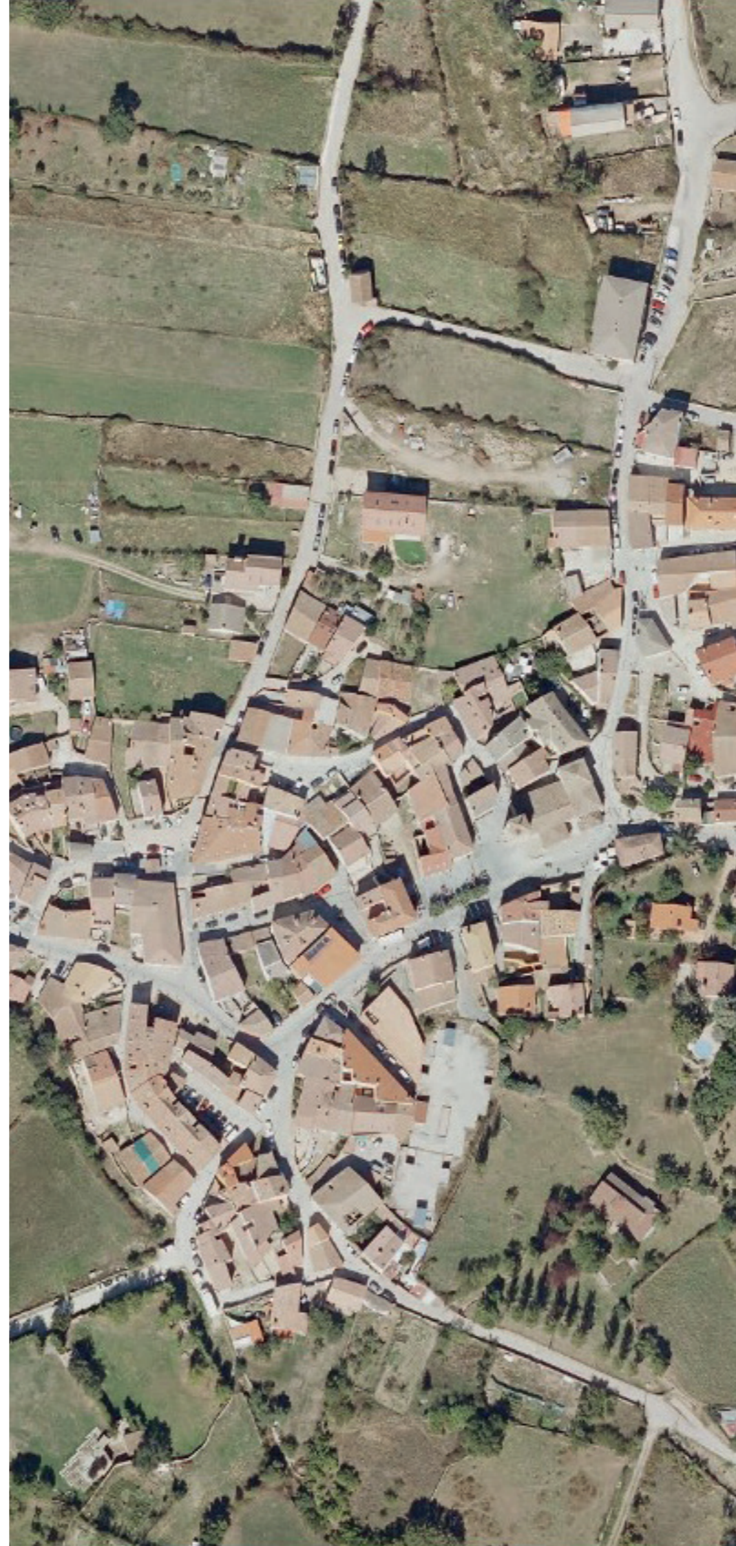
GARGANTA DE LOS MONTES EN 2022. FUENTE: CARTOMADRID