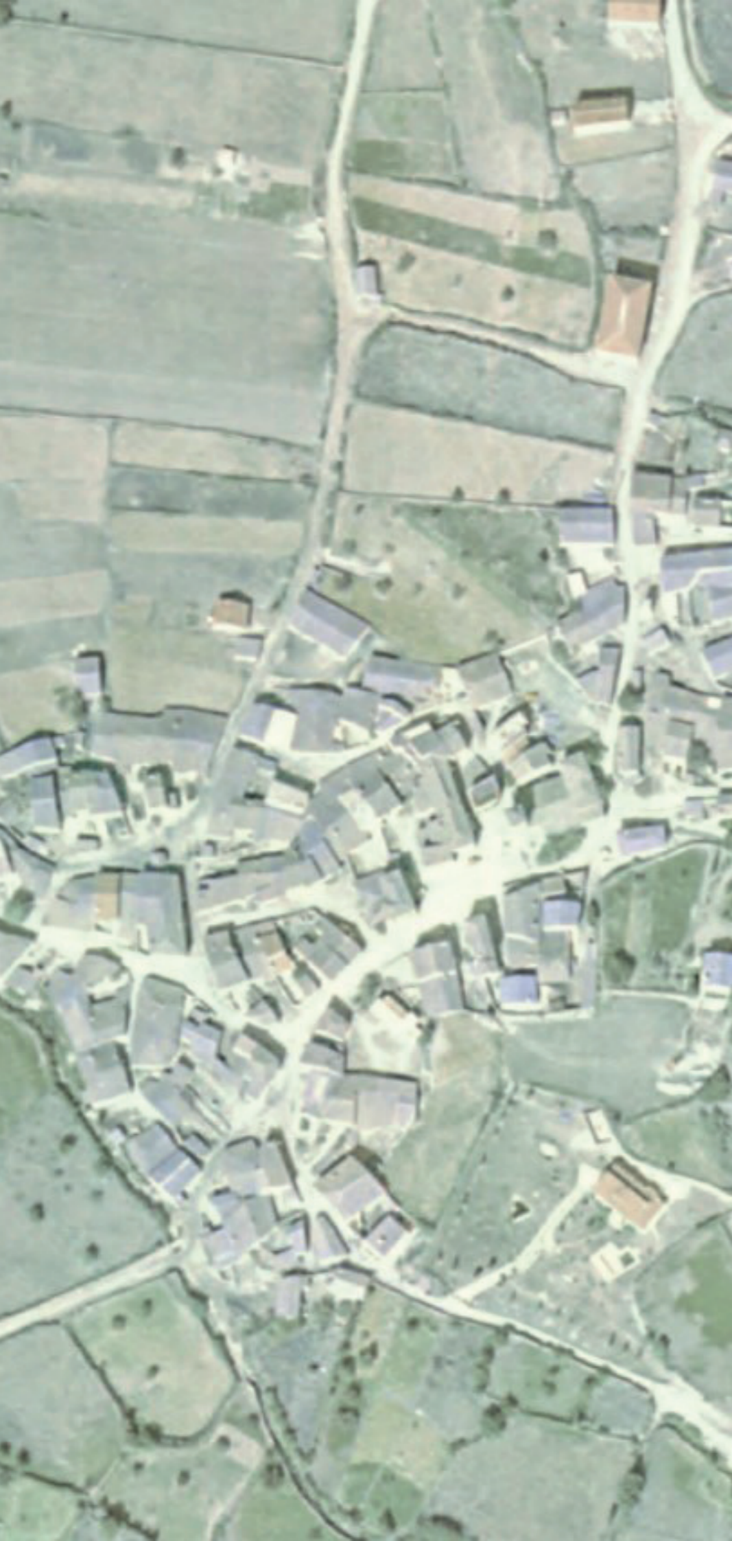
GARGANTA DE LOS MONTES EN 1980.