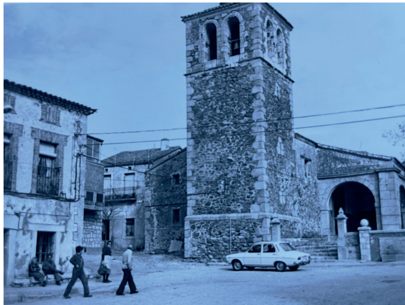
Iglesia de San Pedro Apóstol. En: Información urbanística de 36 municipios : zona norte y noreste, 1979.