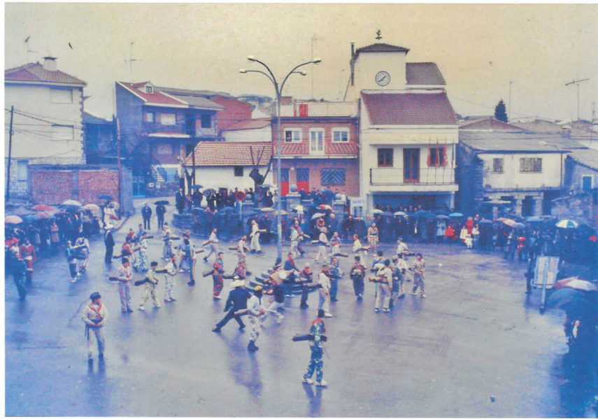
Plaza, 1982-83.