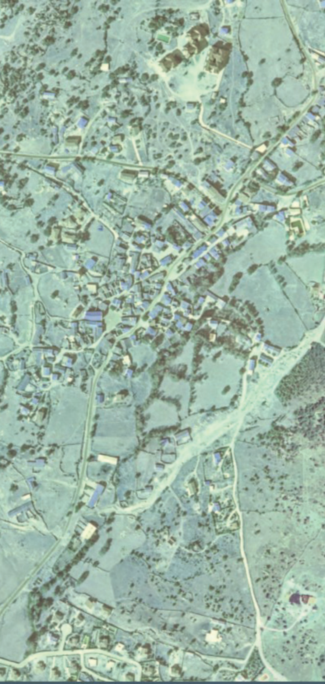
FRESNEDILLAS DE LA OLIVA EN 1980.