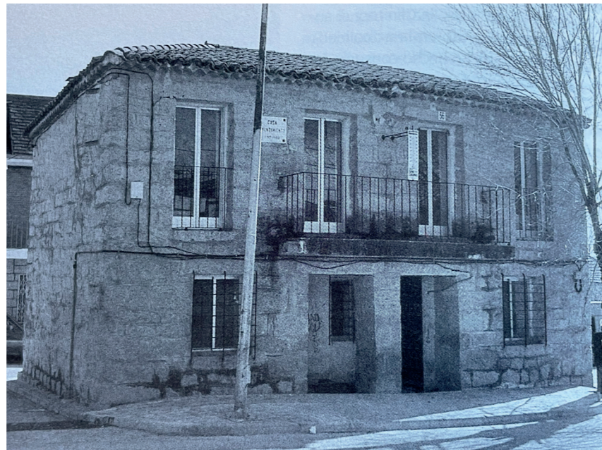
Antiguo Ayuntamiento. Fotografía: Actividades y Servicios Fotográficos. En: Arquitectura y desarrollo 1991. Fuente: Centro de Documentación de Medio Ambiente y Ordenación del Territorio.