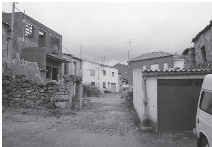
Calles de Fresnedillas, 1999.