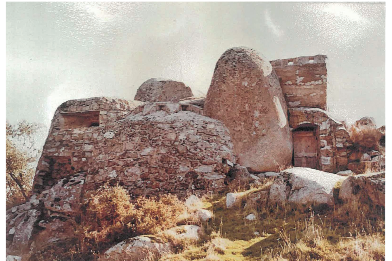
Fortín Los Degollados, hacia 2017.