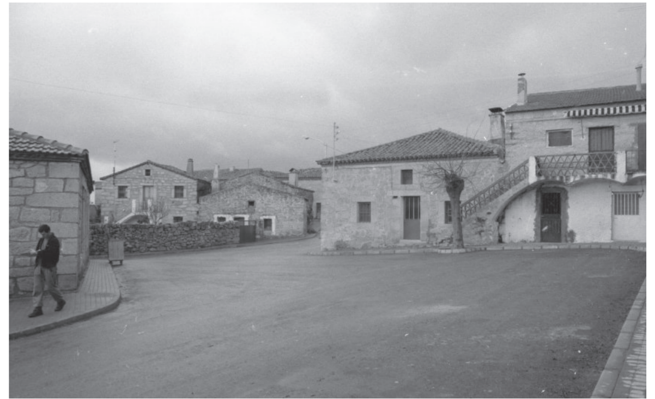
Calles de Fresnedillas, 1999.