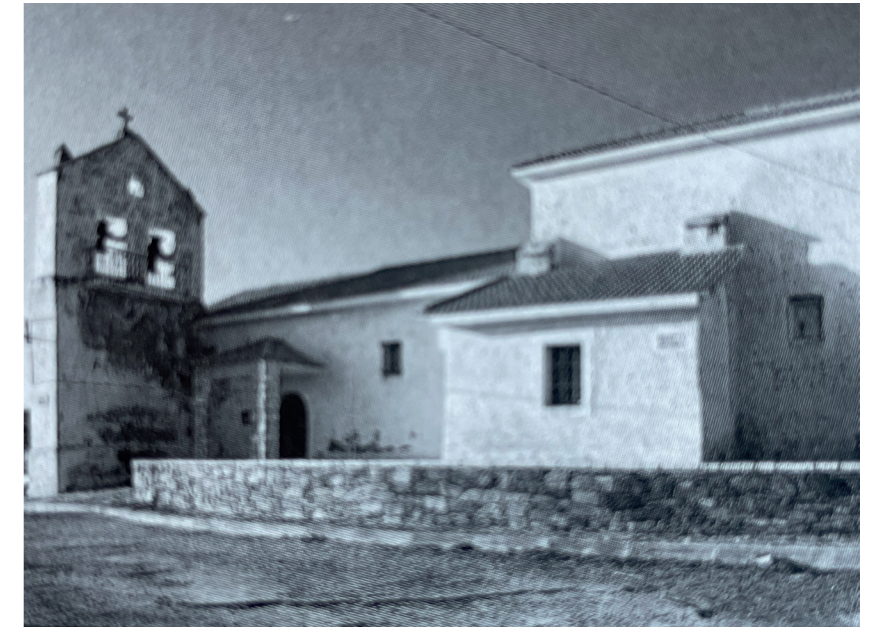
Iglesia de Santa Catalina de Alejandría. En: Arquitectura y desarrollo, 1991.