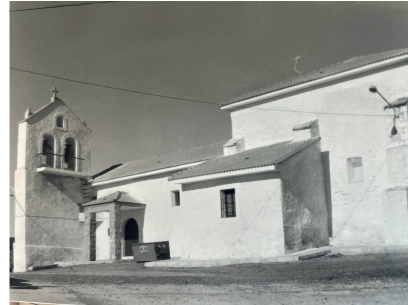
Iglesia de Santa Catalina de Alejandría. En: Información, clasificación y normativa para los cascos antiguos de la Zona Norte del ámbito de la Comunidad Autónoma de Madrid, 1984.