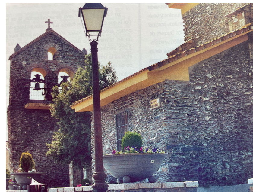
Plaza de la Constitución. En: Plazas con historia, 2002.