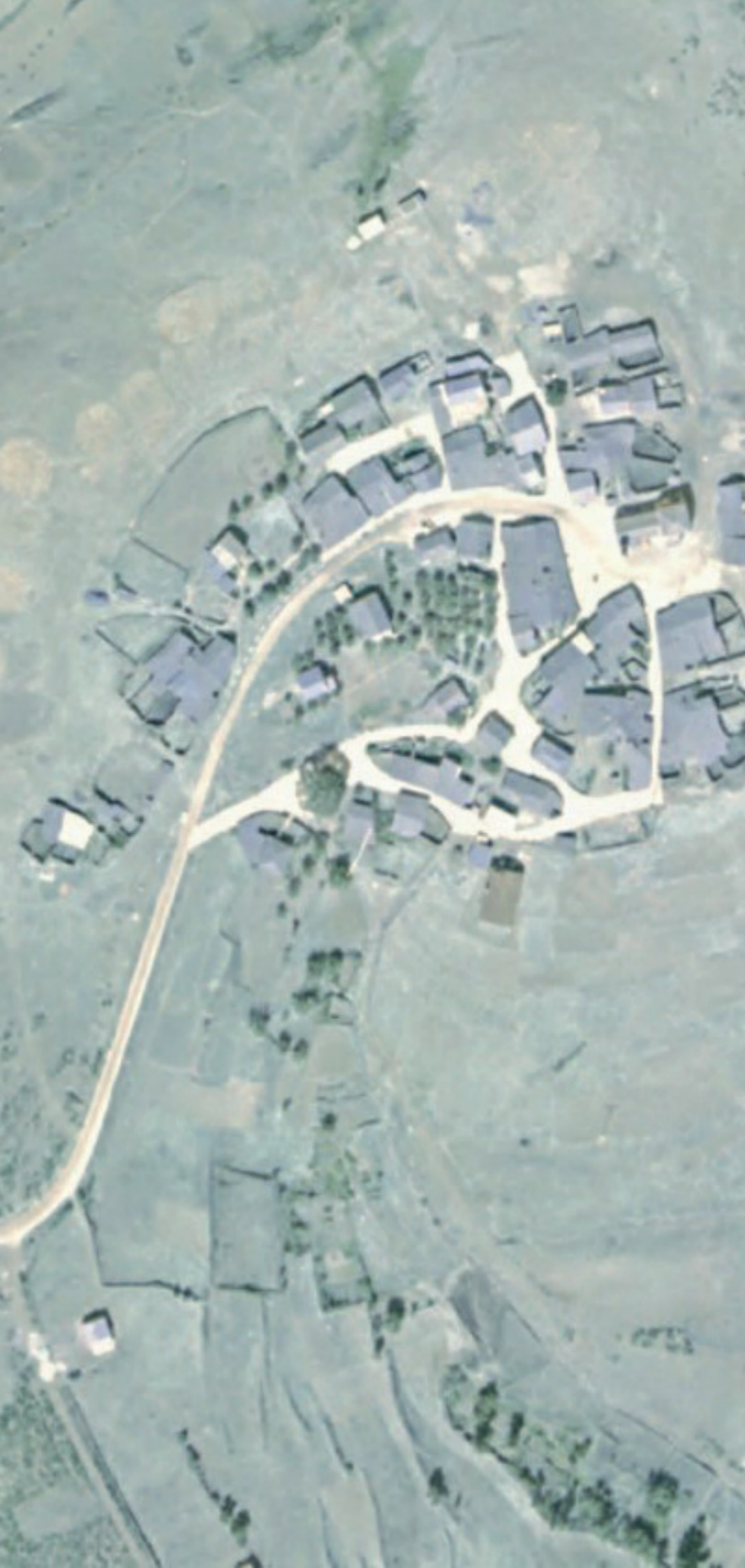
EL ATAZAR EN 1980.