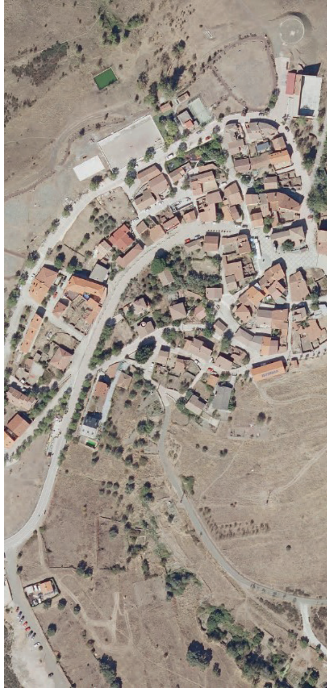
EL ATAZAR EN 2022. FUENTE: CARTOMADRID