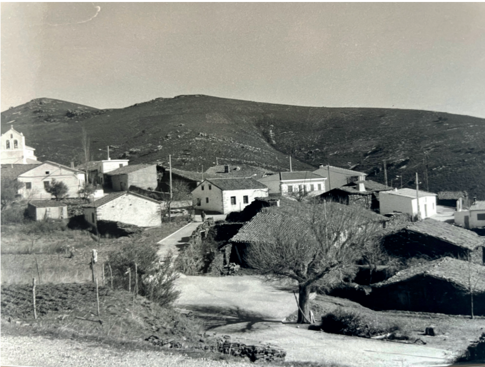
Vista de El Atazar. En: Información, clasificación y normativa para los cascos antiguos de la Zona Norte del ámbito de la Comunidad Autónoma de Madrid, 1984.