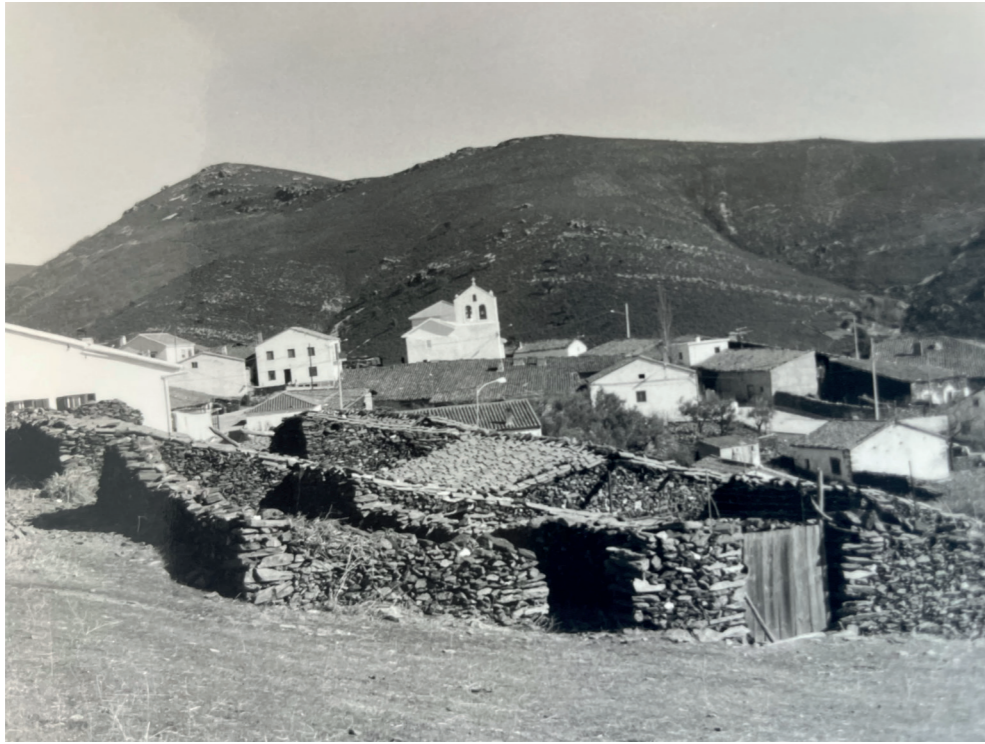
Vista de El Atazar. En: Información, clasificación y normativa para los cascos antiguos de la Zona Norte del ámbito de la Comunidad Autónoma de Madrid, 1984.