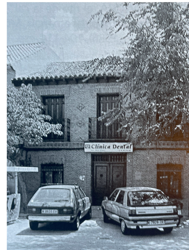
Vivienda neomudéjar protegida, año 2000. Fotografía: José Manuel Ablanado. En: Arquitectura y Desarrollo, 2004. Fuente: Centro de Documentación de Medio Ambiente y Ordenación del Territorio.