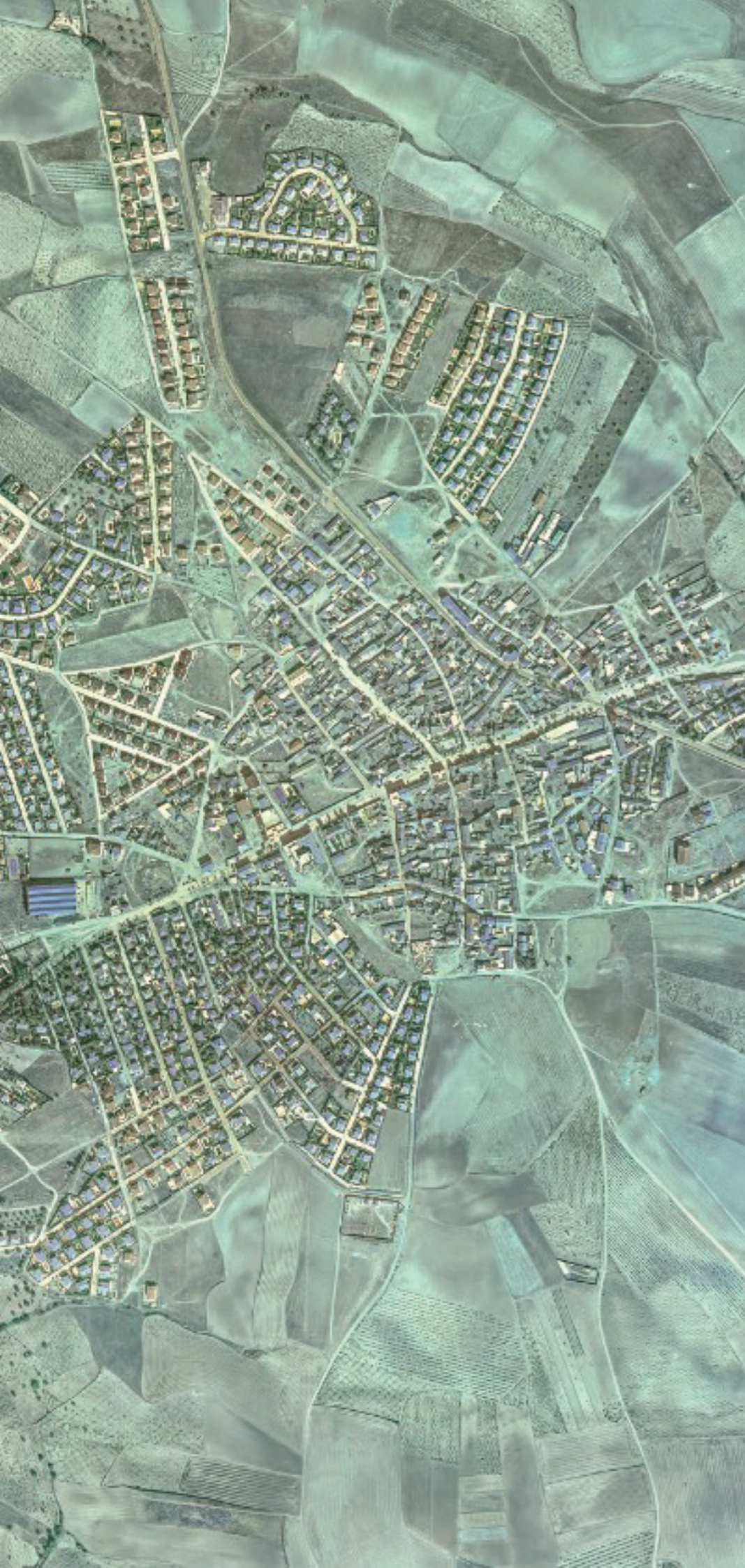
EL ÁLAMO EN 1980.