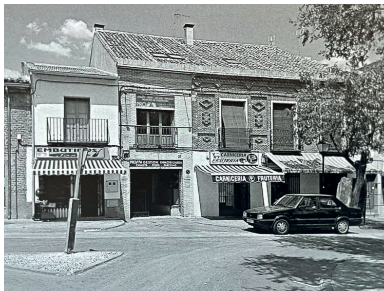
Vivienda neomudéjar protegida, año 2000. Fotografía: José Manuel Ablanado. En: Arquitectura y Desarrollo, 2004. Fuente: Centro de Documentación de Medio Ambiente y Ordenación del Territorio.