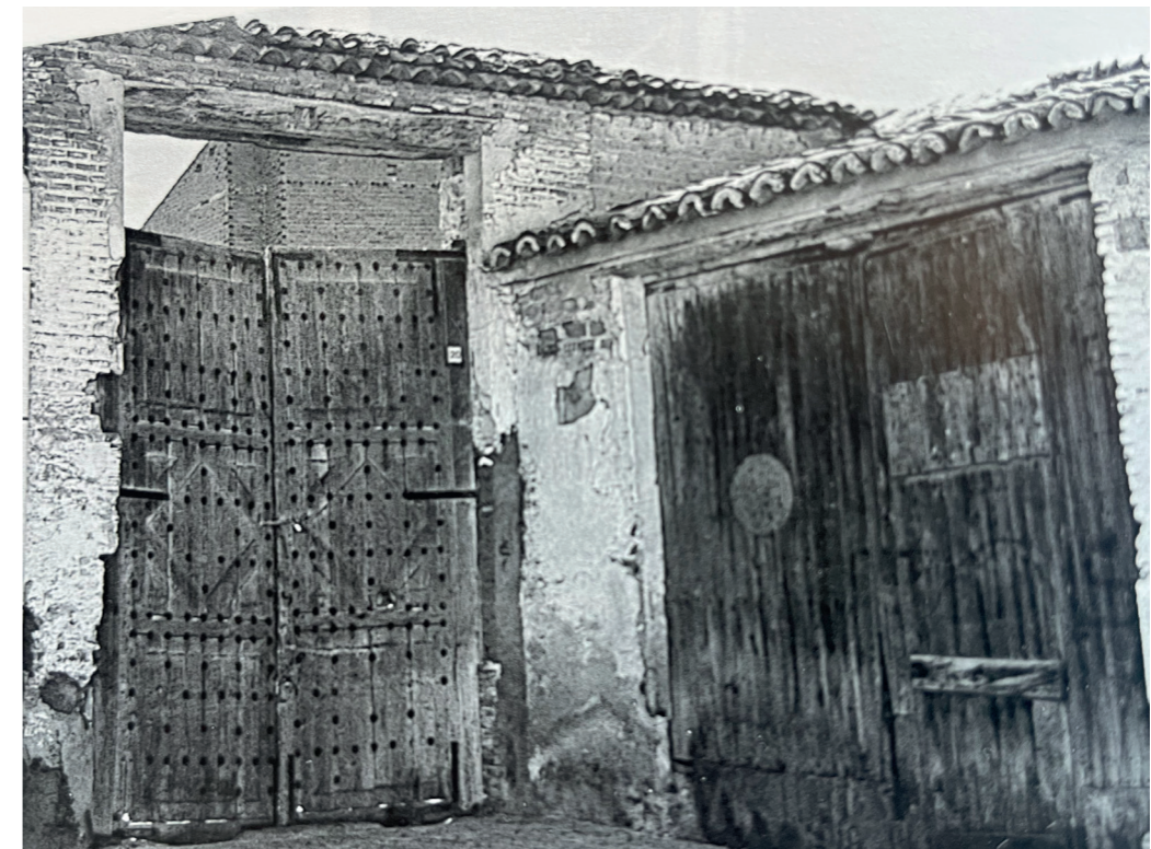
Portalones de la plaza Constitución antes de su destrucción, 1998. Fotografía: Fátima García Lledó. En: Arquitectura y Desarrollo, 2004. Fuente: Centro de Documentación de Medio Ambiente y Ordenación del Territorio.