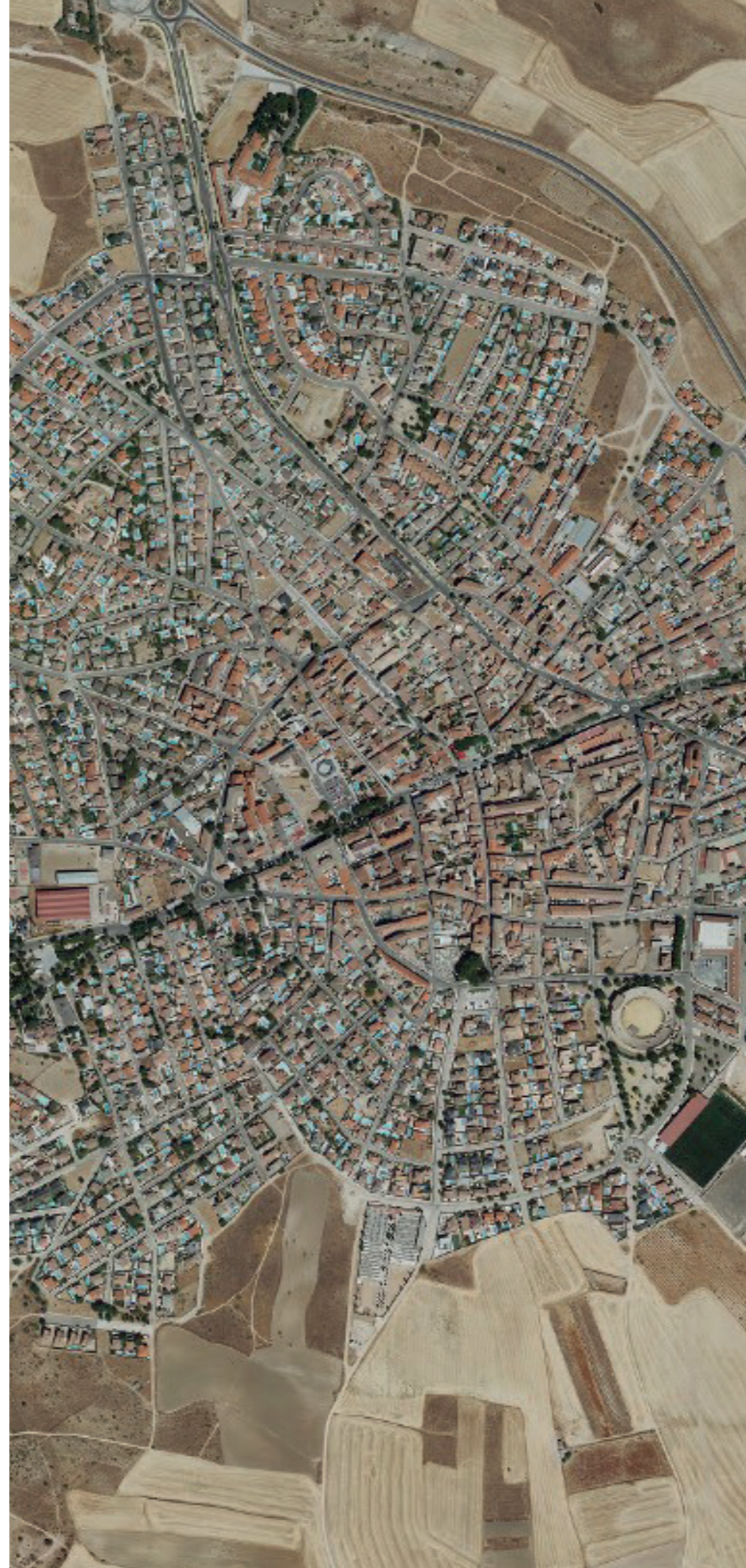
EL ÁLAMO EN 2022. FUENTE: CARTOMADRID