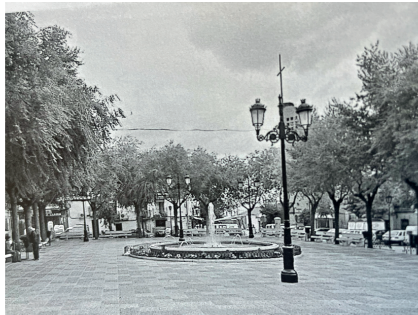
Antiguas farolas en plaza de la Constitución, 1998. En: Arquitectura y Desarrollo, 2004.