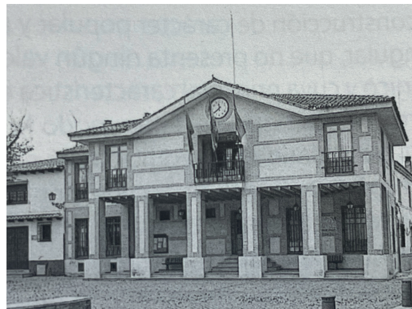
Ayuntamiento de Cubas de la Sagra. Fotografía: José Manuel Ablanado. En: Arquitectura y Desarrollo, 2000. Fuente: Centro de Documentación de Medio Ambiente y Ordenación del Territorio