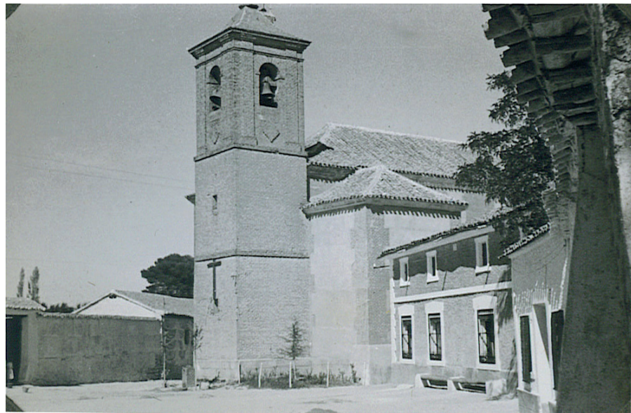
Plaza de la Constitución, 1935.