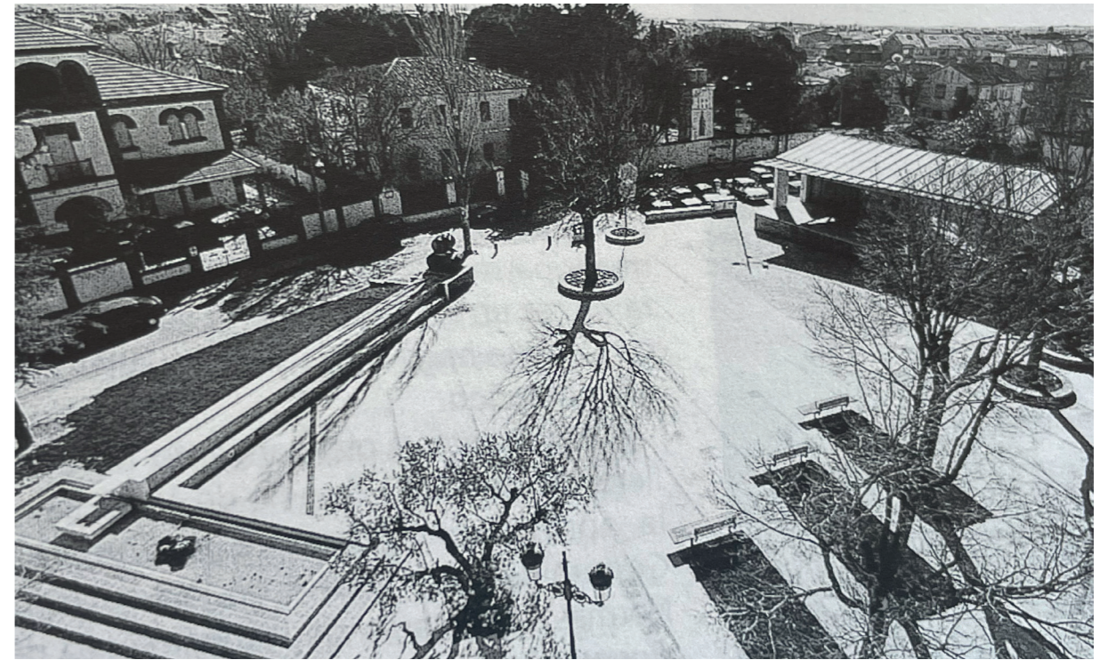
Plaza de la Constitución tras rehabilitación. En: Arquitectura y desarrollo, 2000.