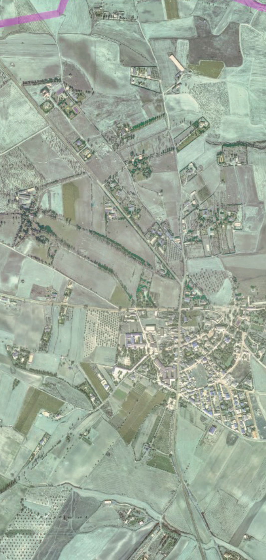
CUBAS DE LA SAGRA EN 1980.