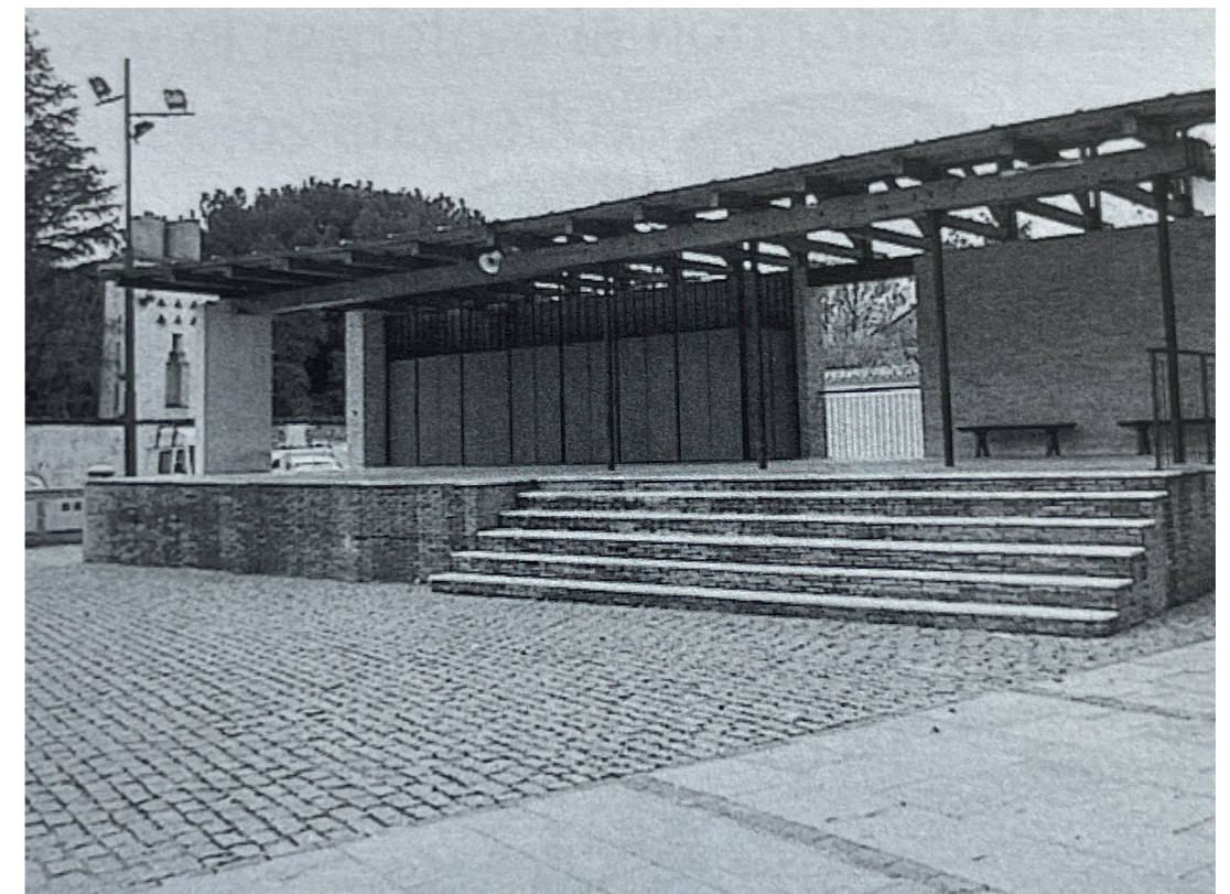
Plaza de la Constitución, templete. En: Arquitectura y desarrollo, 2000.