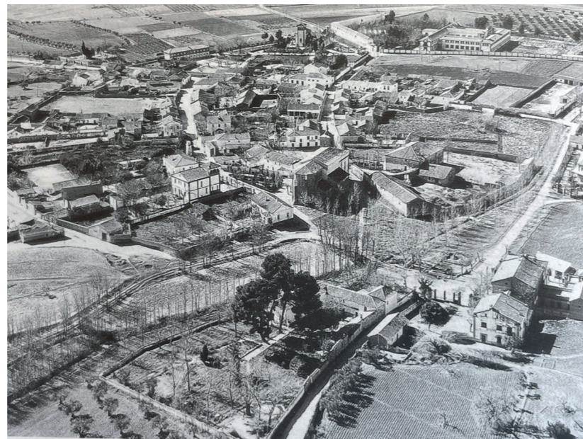
Vista aérea de Cubas de la Sagra. Fotografía: Paisajes Españoles. En: Arquitectura y Desarrollo, 2000. Fuente: Centro de Documentación de Medio Ambiente y Ordenación del Territorio.