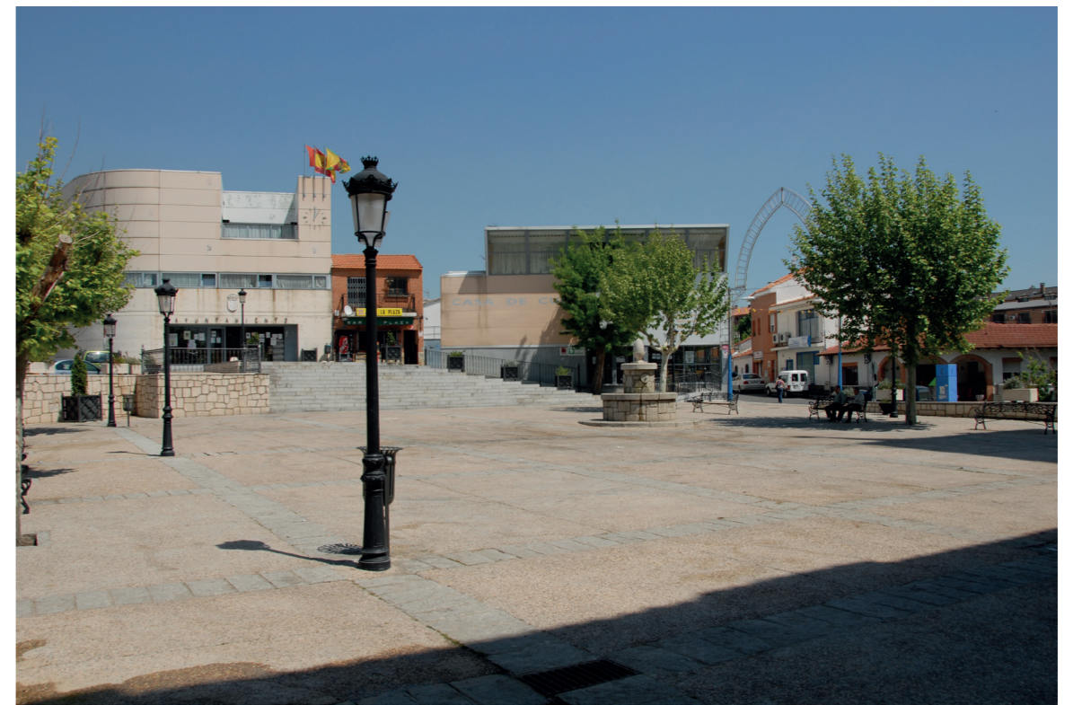
Plaza de la Villa, 2007.