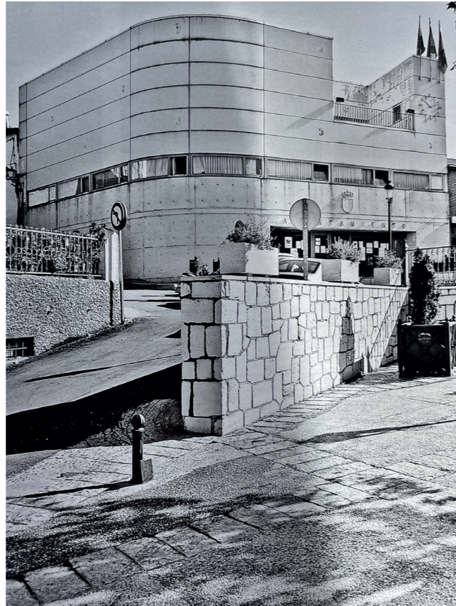
Ayuntamiento, 2006. Fotografía: José Manuel Ablanado. En: Arquitectura y desarrollo, 2009. Fuente: Centro de Documentación de Medio Ambiente y Ordenación del Territorio.