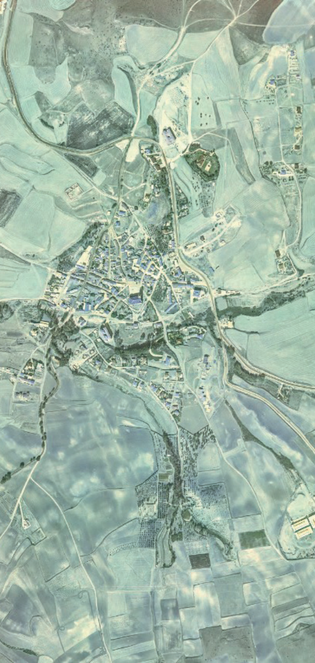
COBEÑA EN 1980. FUENTE: CARTOMADRID