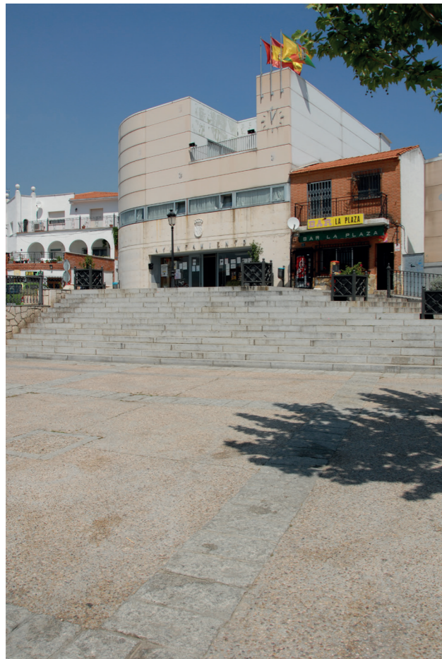
Ayuntamiento, 2007.