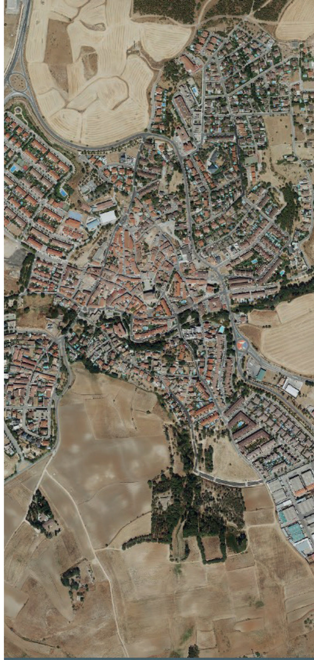
COBEÑA EN 2022.