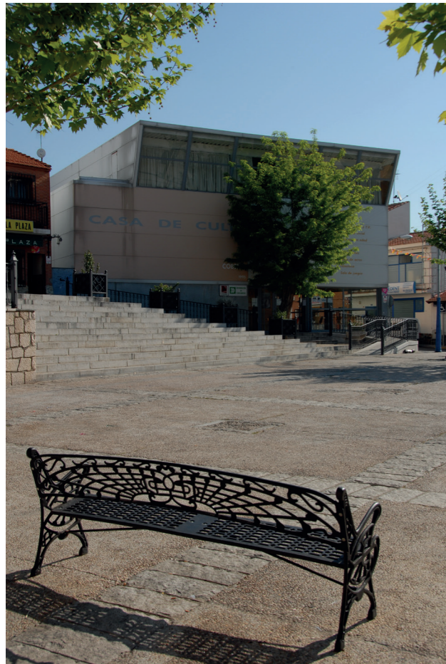
Casa de Cultura, 2007.