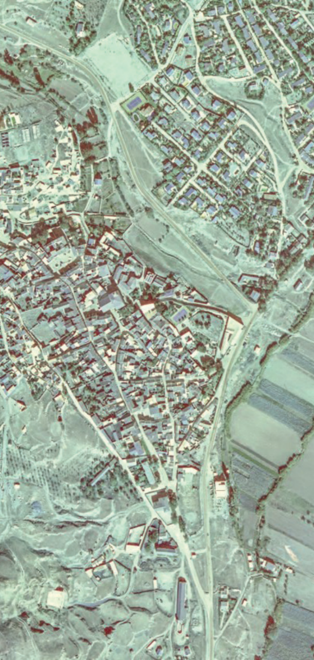
CARABAÑA EN 1980.