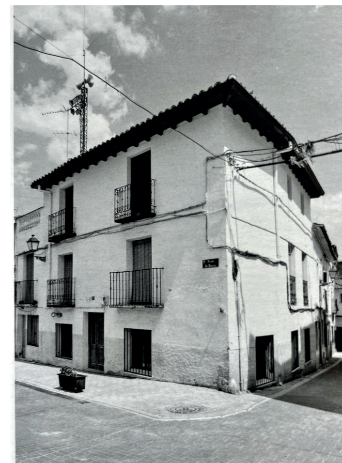
Plaza de España esquina con calle Real. En: Arquitectura y desarrollo, 2009.