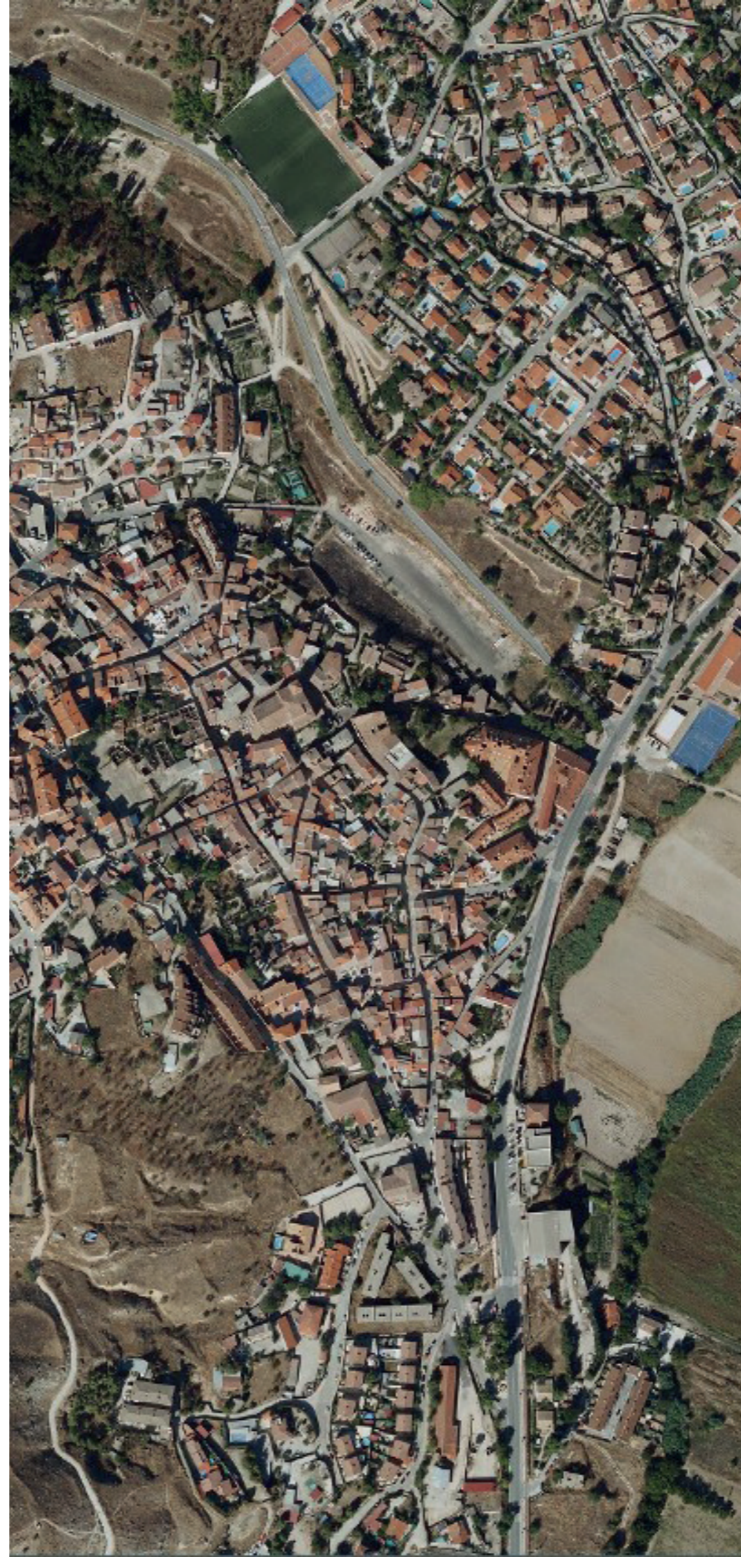
CARABAÑA EN 2022.