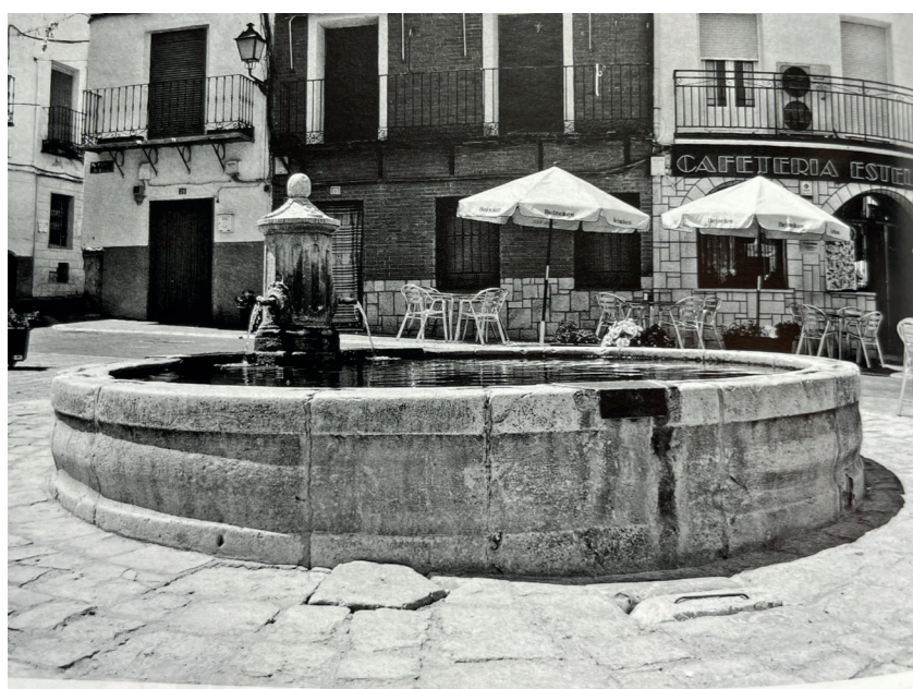
Fuente neoclásica en Plaza de España. En: Arquitectura y desarrollo, 2009. Fuente: Centro de Documentación de Medio Ambiente y Ordenación del Territorio.