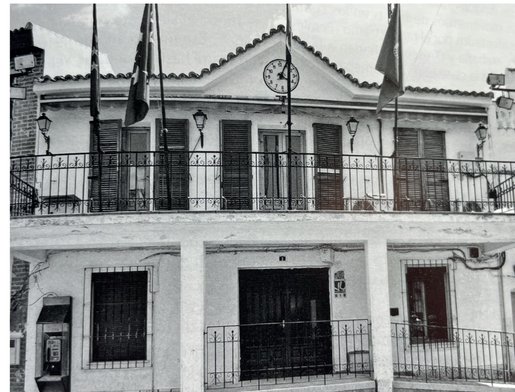
Ayuntamiento. En: Arquitectura y desarrollo, 2009.