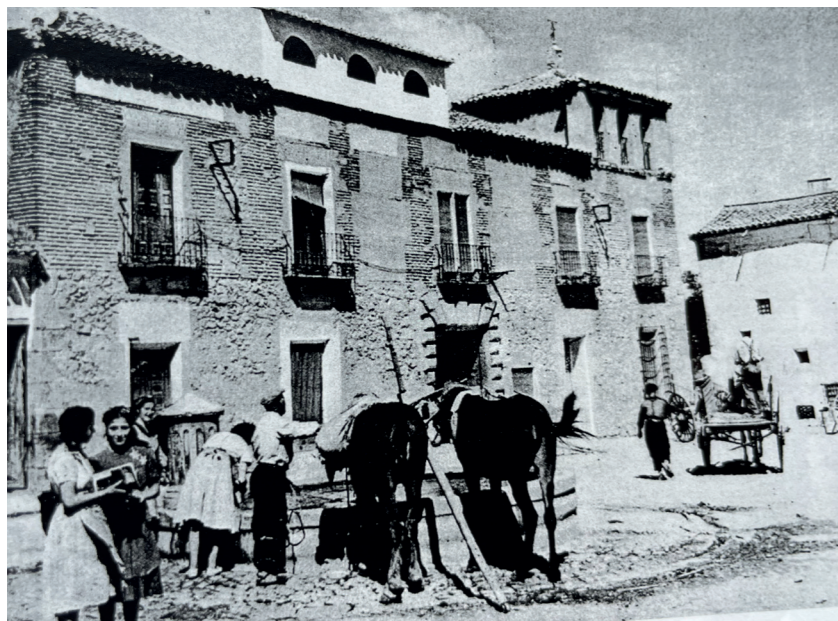
Palacio hacia 1952. Fotografía: Loygorri. En: Arquitectura y desarrollo, 2009. Fuente: Centro de Documentación de Medio Ambiente y Ordenación del Territorio.