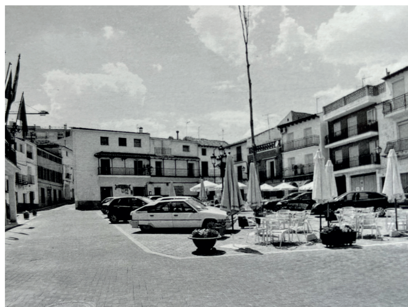
Plaza de España. En: Arquitectura y desarrollo, 2009.