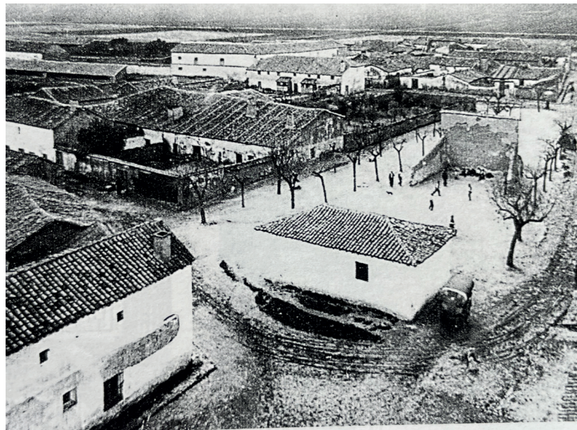
Vista aérea, años 30. En: Arquitectura y desarrollo, 1991.