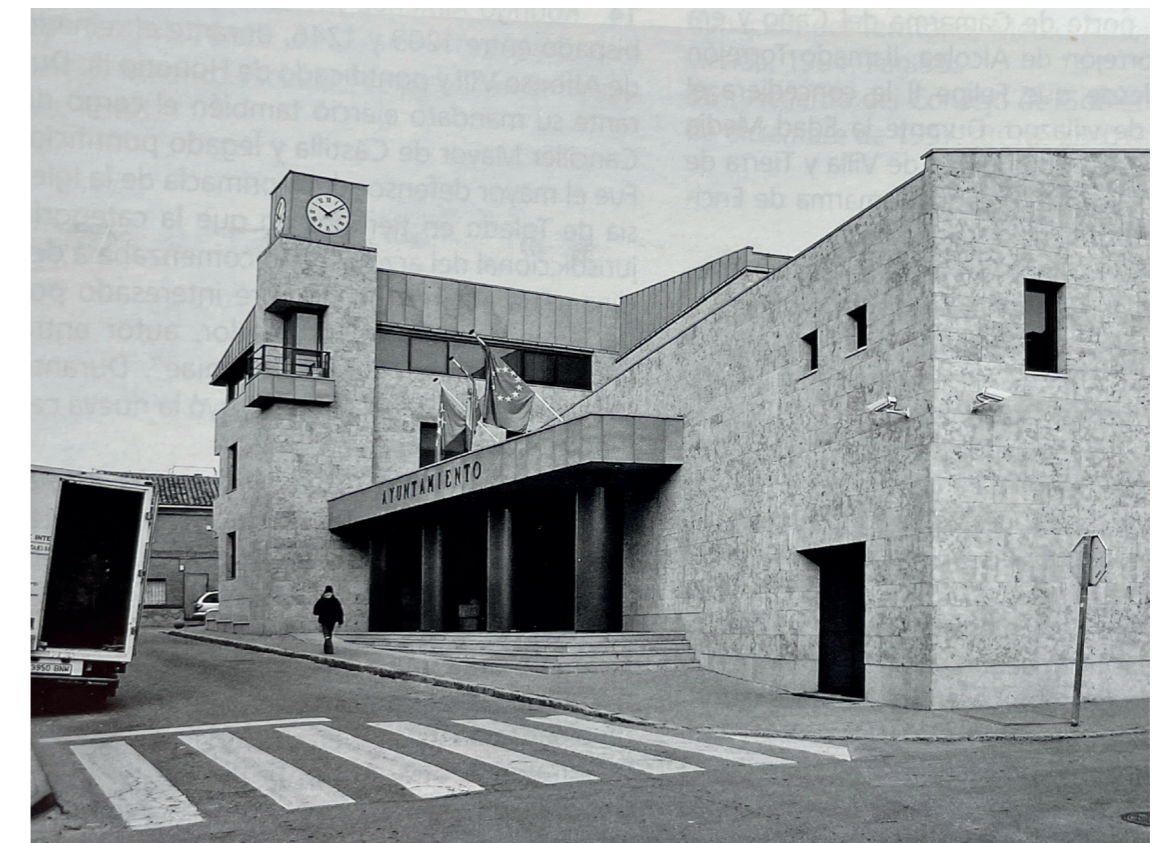
Nuevo edificio Consistorial. En: Arquitectura y desarrollo, 2009.