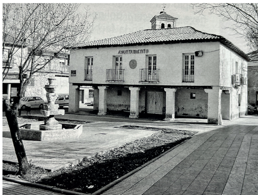
Ayuntamiento y plaza. Fotografía: José Manuel Ablanedo. En: Arquitectura y desarrollo, 2009. Fuente: Centro de Documentación de Medio Ambiente y Ordenación del Territorio.