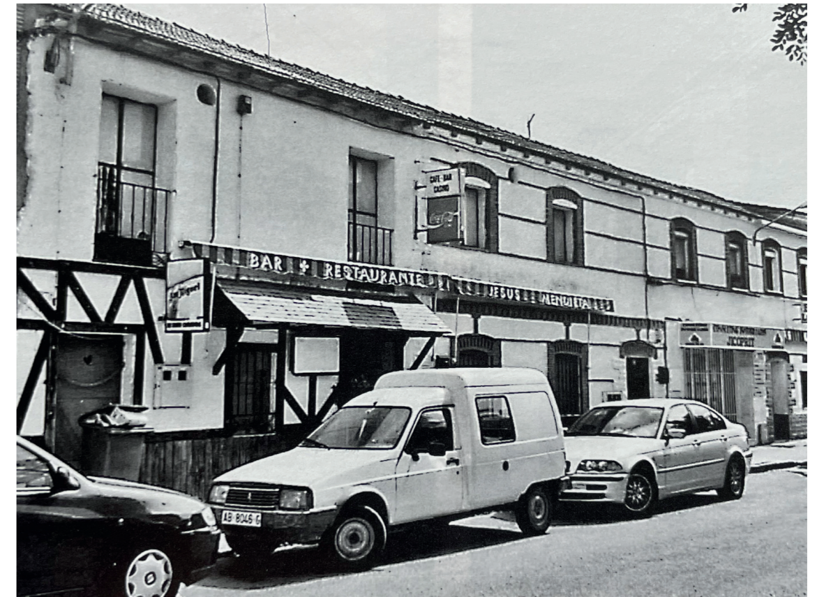
Edificios en Plaza del Paseo. En: Arquitectura y desarrollo, 2009.