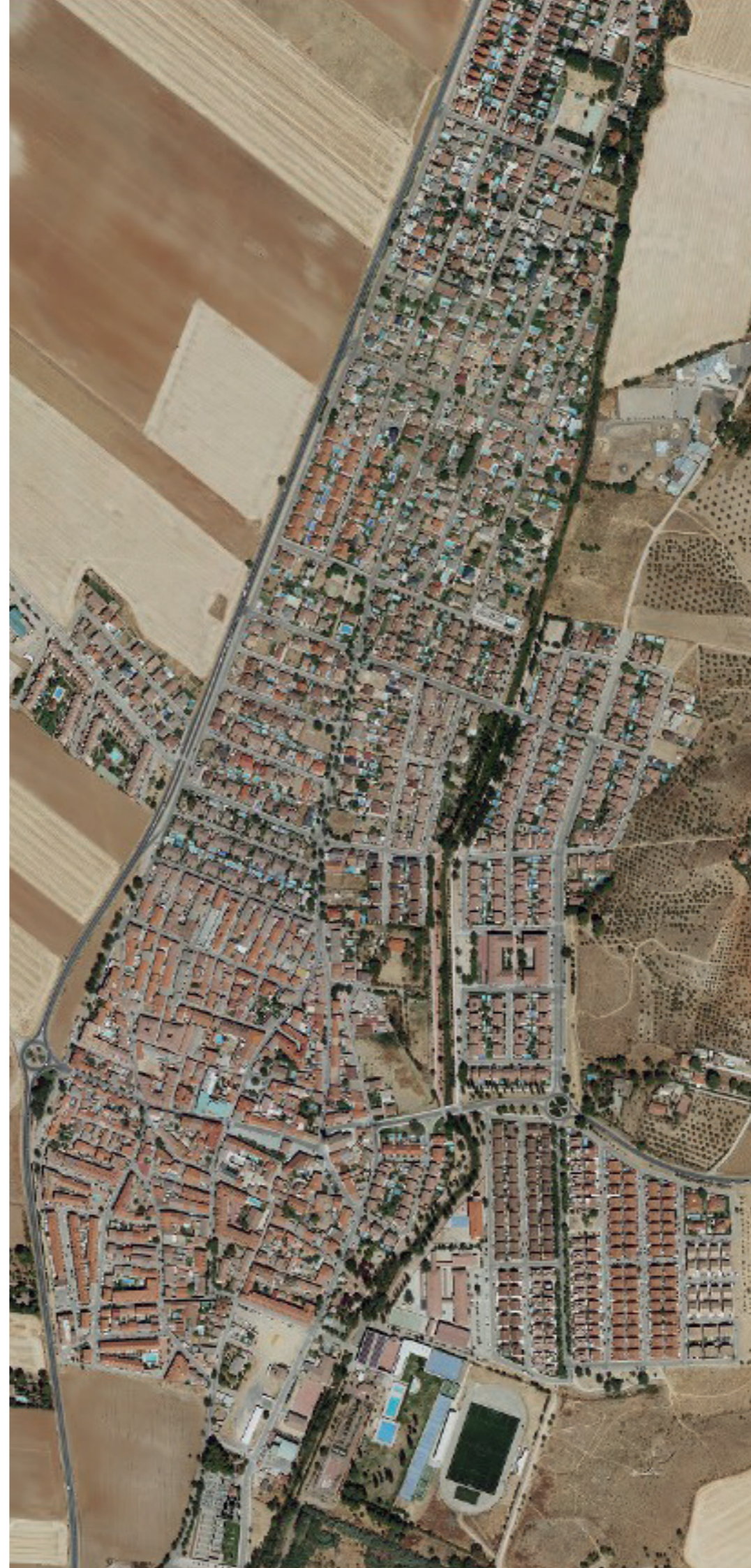
CAMARMA DE ESTERUELAS EN 2022. FUENTE: CARTOMADRID