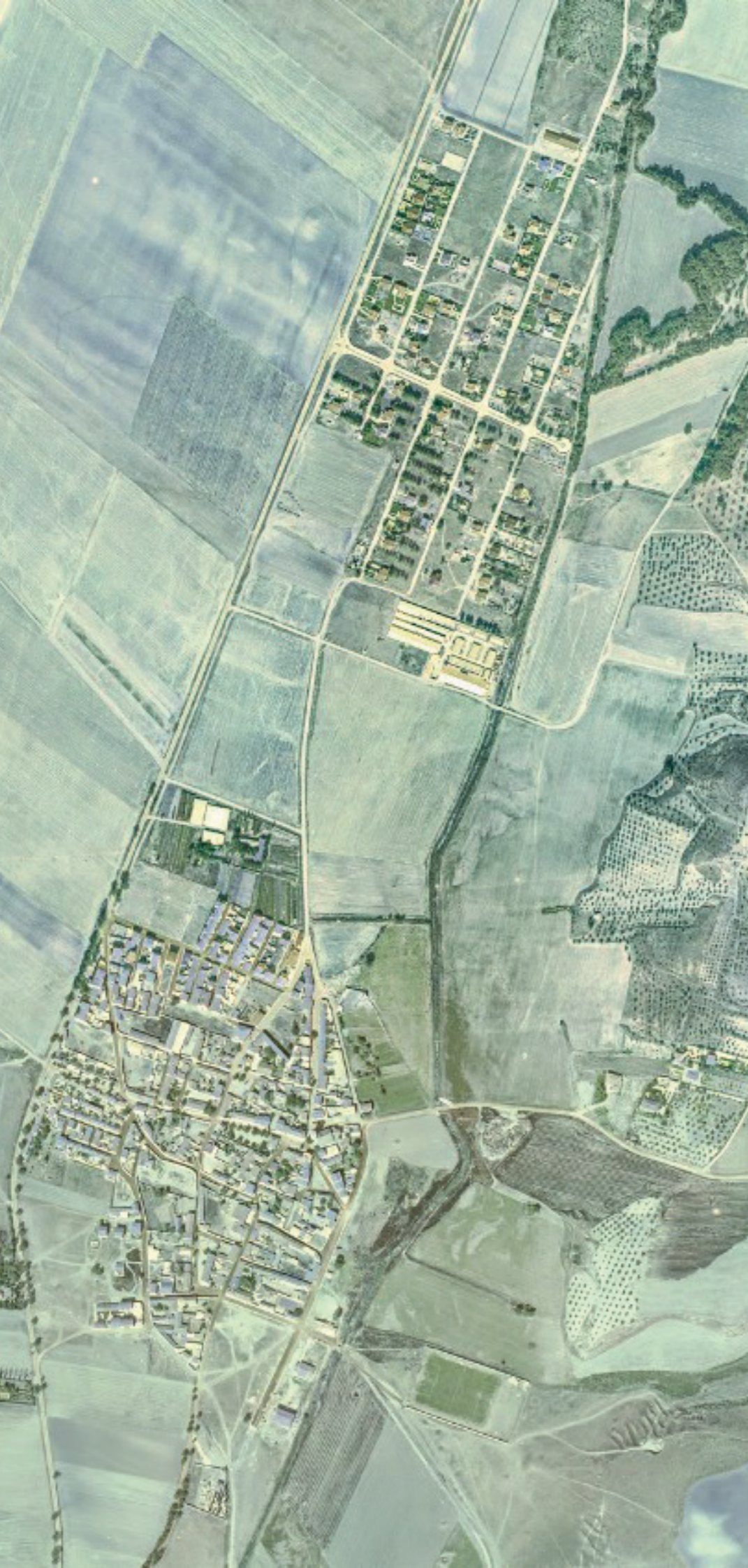
CAMARMA DE ESTERUELAS EN 1980.