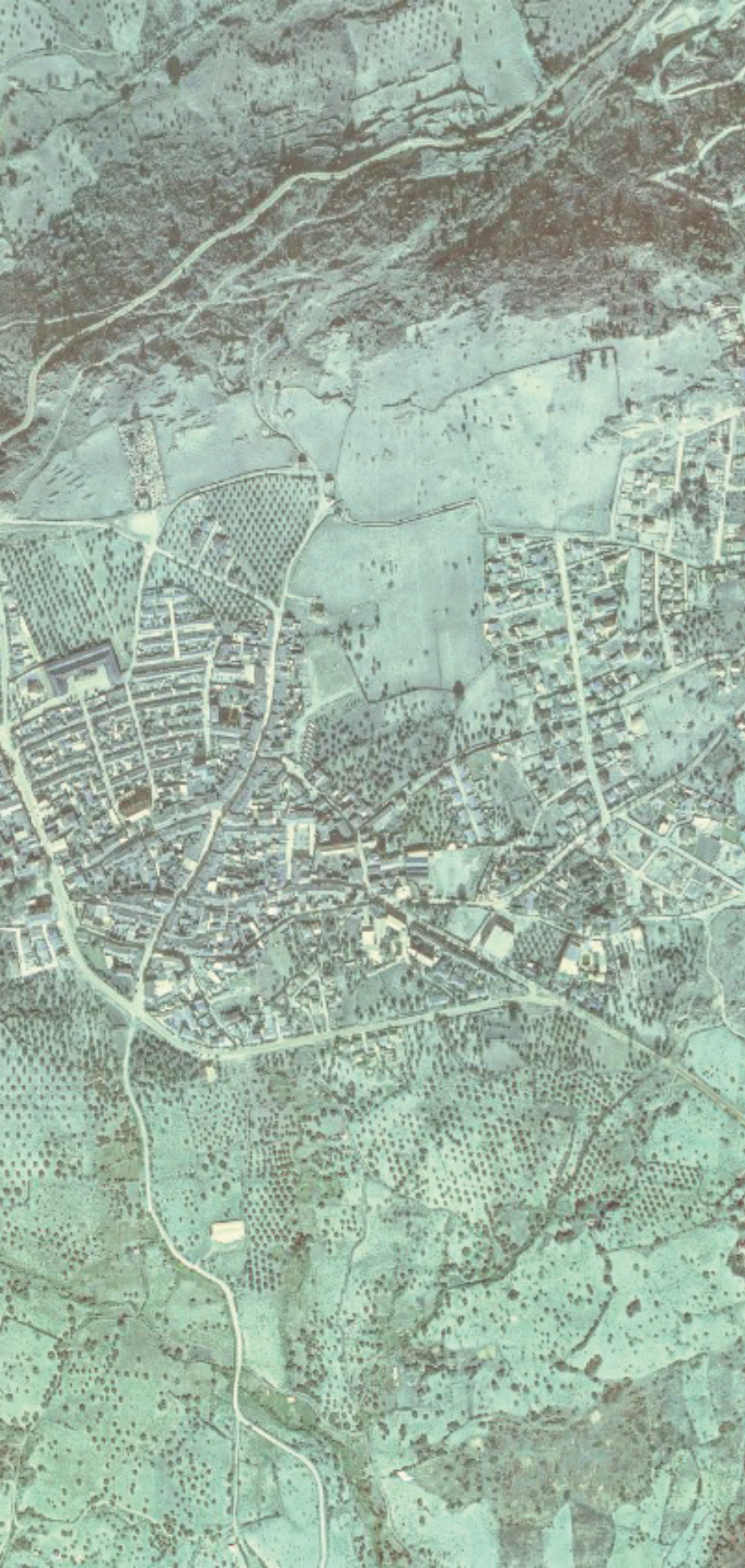
CADALSO DE LOS VIDRIOS EN 1980.