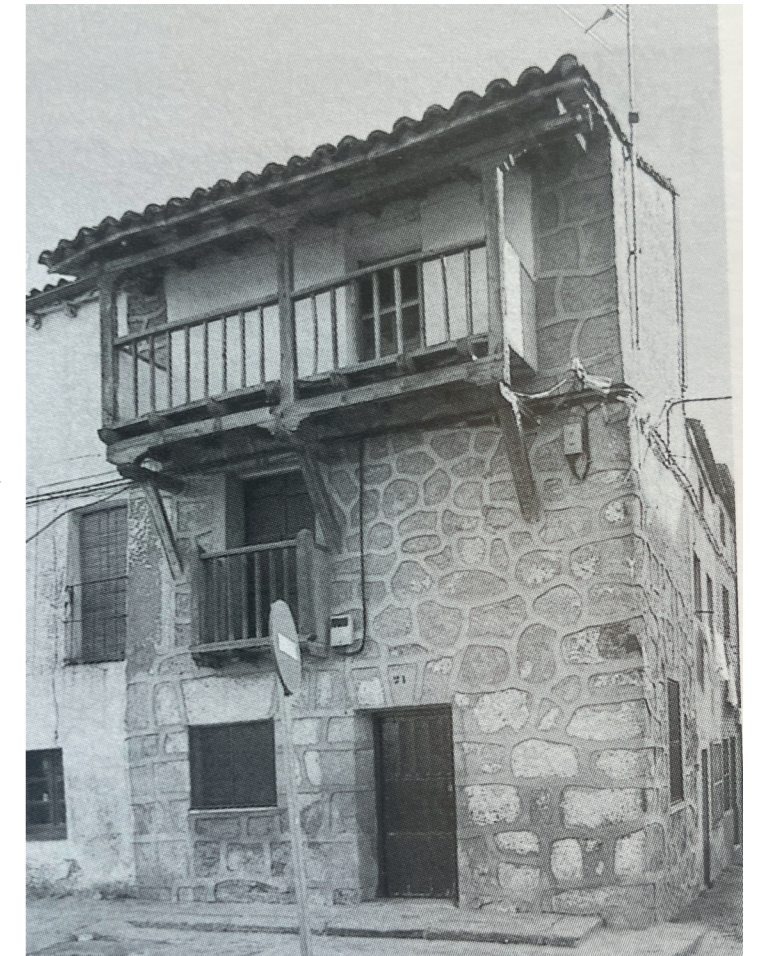
Vivienda, plaza de la Corredera. Fotografía: Actividades y Servicios Fotográficos. En: Arquitectura y desarrollo, 1999. Fuente: Centro de Documentación de Medio Ambiente y Ordenación del Territorio.