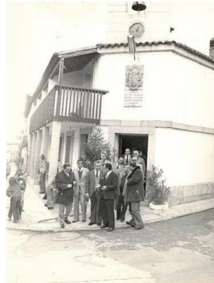
Ayuntamiento, 1960.