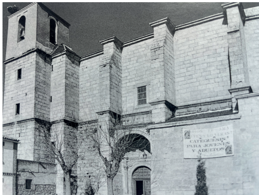
Iglesia parroquial de la Asunción. Fotografía: Actividades y Servicios Fotográficos. En: Arquitectura y desarrollo, 1999. Fuente: Centro de Documentación de Medio Ambiente y Ordenación del Territorio.