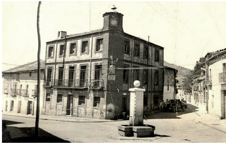
Ayuntamiento, 1950.