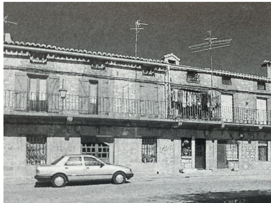
Plaza de la Corredera.