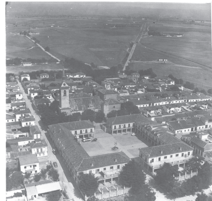
Plaza Mayor, vista aérea, 1977. Comisión Planeamiento y Coordinación Área metropolitana de Madrid.