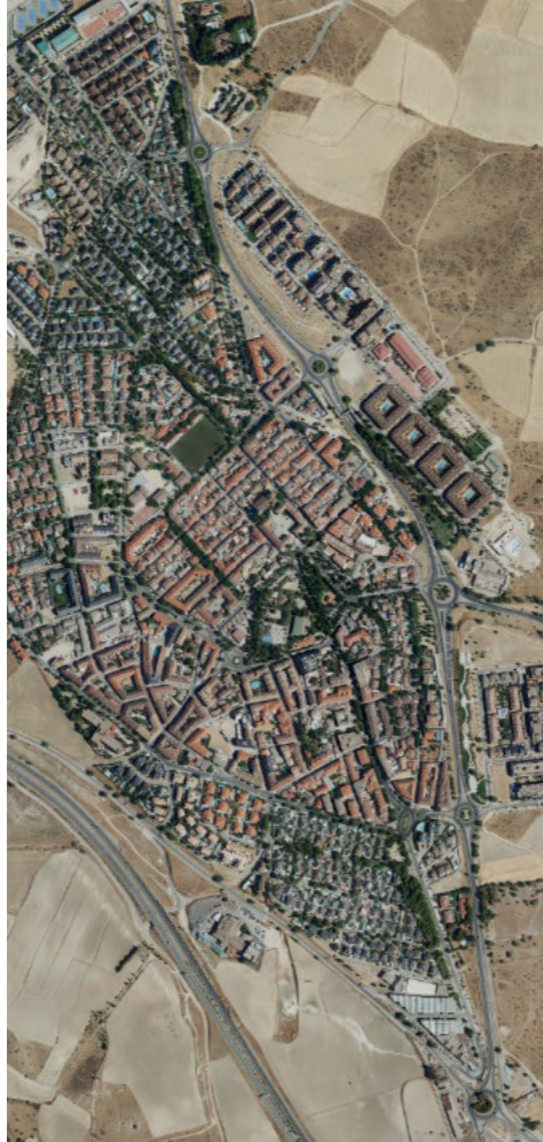
BRUNETE EN 2022. FUENTE: CARTOMADRID