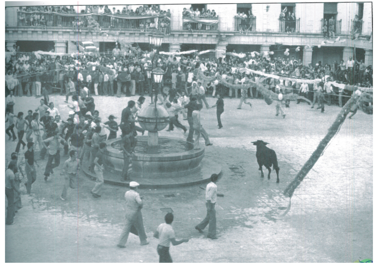
Plaza Mayor, toreo en la plaza, años 50.