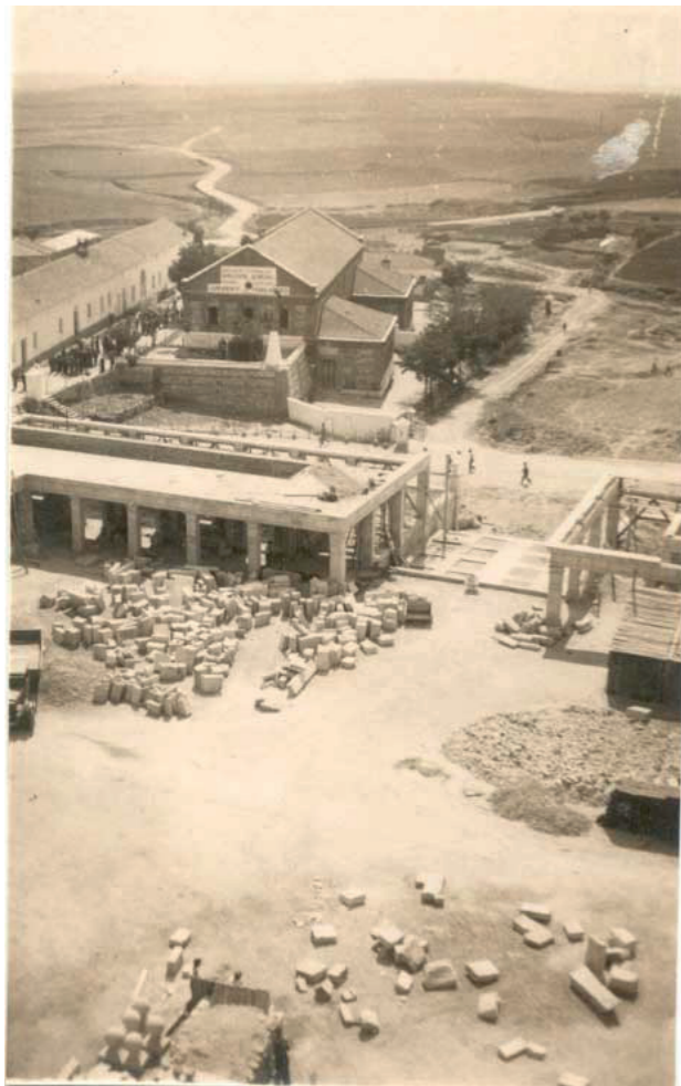
Plaza Mayor, construcción de la plaza, principios años 40.