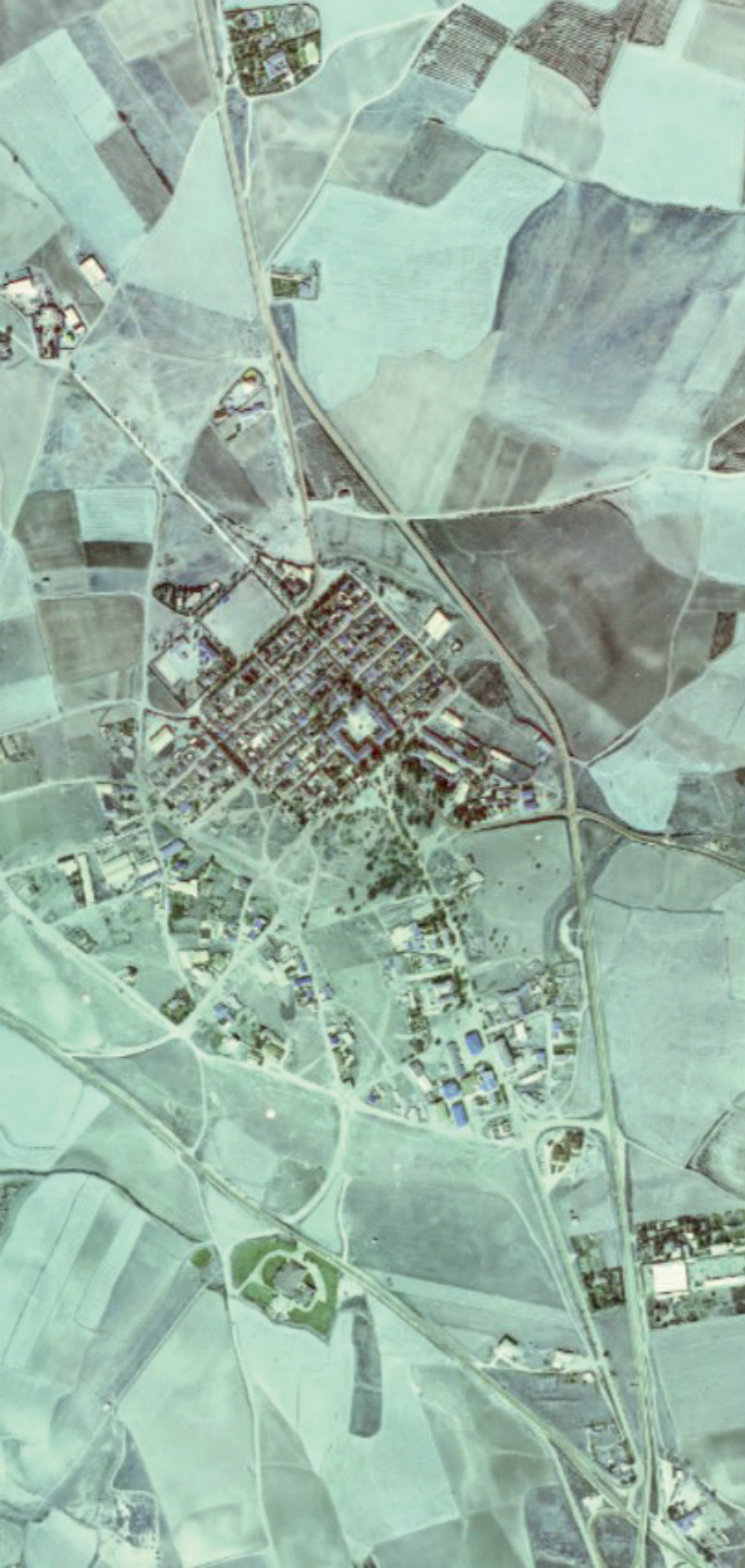
BRUNETE EN 1980.