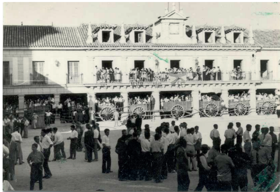
Plaza Mayor, carros y fiestas, años 50 .