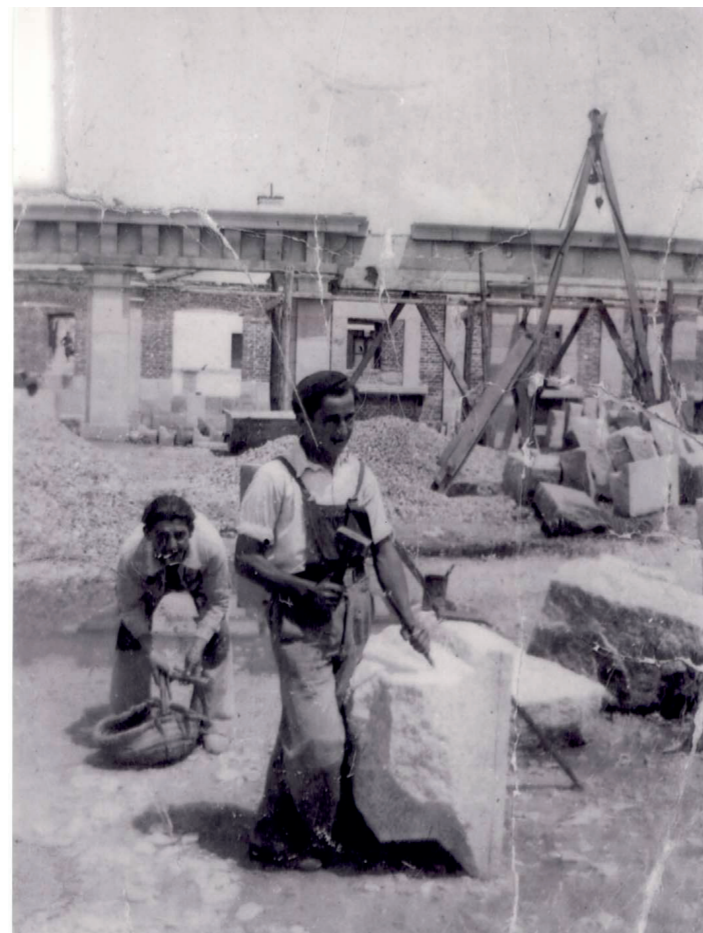
Plaza Mayor, construcción de la plaza, principios años 40.