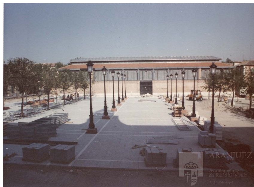
Obras de reforma de la plaza de la Constitución, 1991.