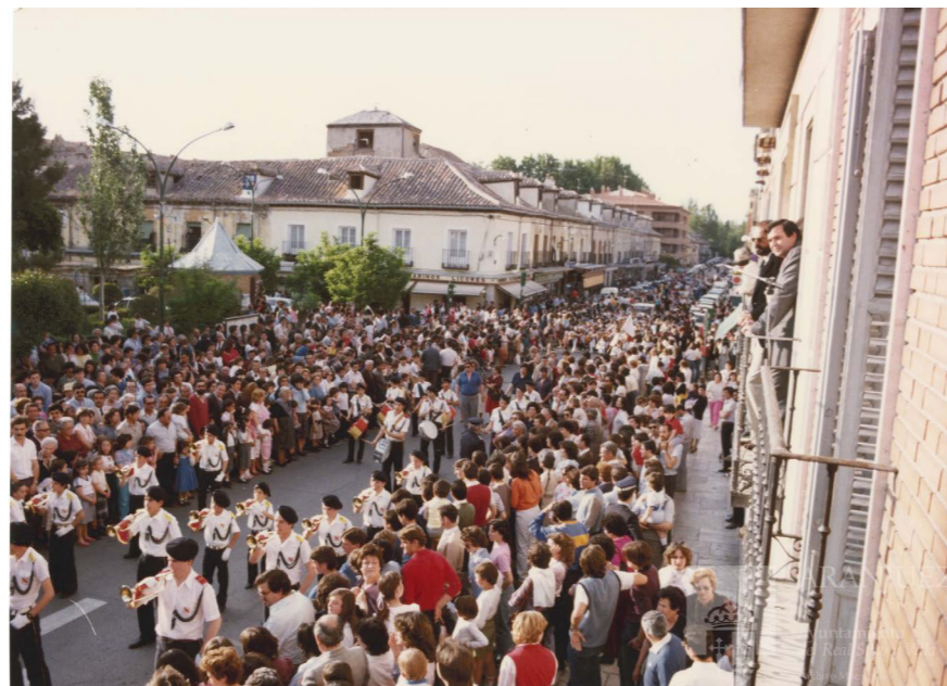
Pasacalles de las fiestas de San Fernando, 1983. El alcalde de Aranjuez en el balcón de la Casa Consistorial.