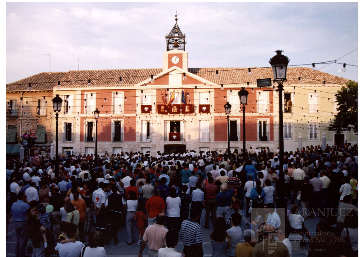
Pregón de las fiestas desde la Casa Consistorial, 1998.