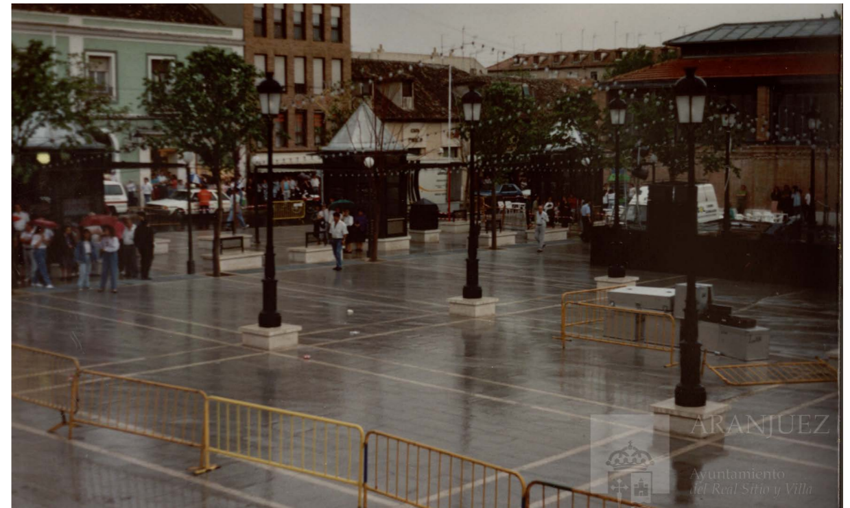
Plaza de la Constitución bajo la lluvia, 1992.