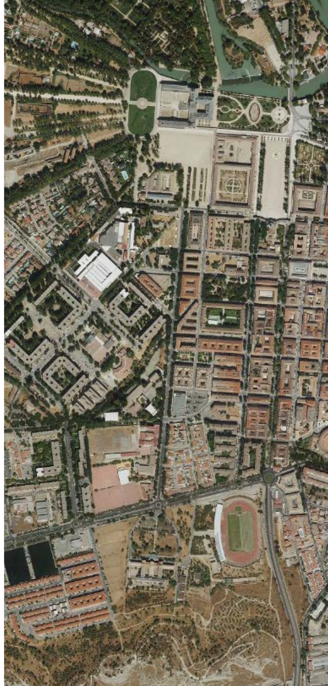
ARANJUEZ EN 2022. FUENTE: CARTOMADRID