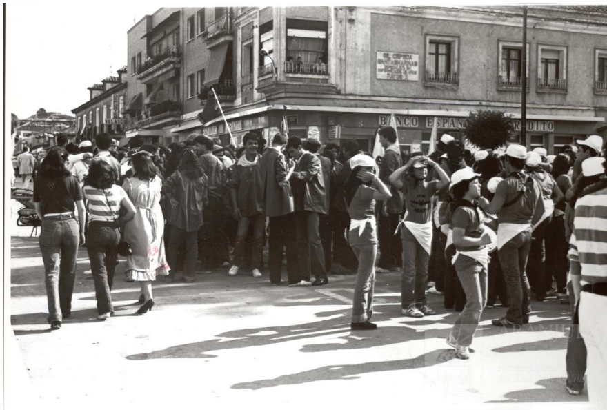
Fiestas de San Fernando en la plaza de la Constitución.