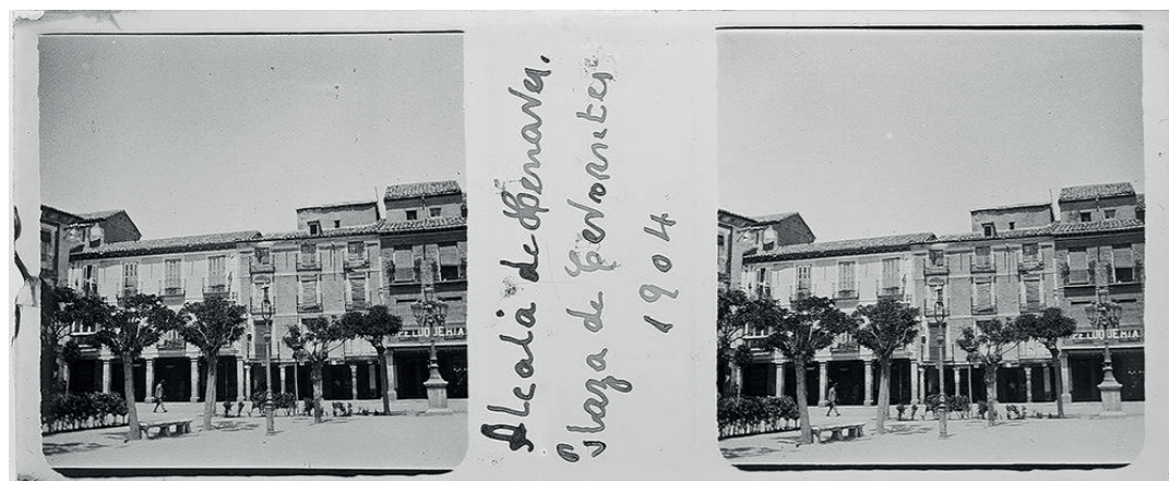
Soportales de la plaza de Cervantes. Archivo Augusto Arcimís, 1904. Fuente: Fototeca del Instituto del Patrimonio Cultural de España. Ministerio de Cultura y Deporte. Signatura: ARC-0049_P