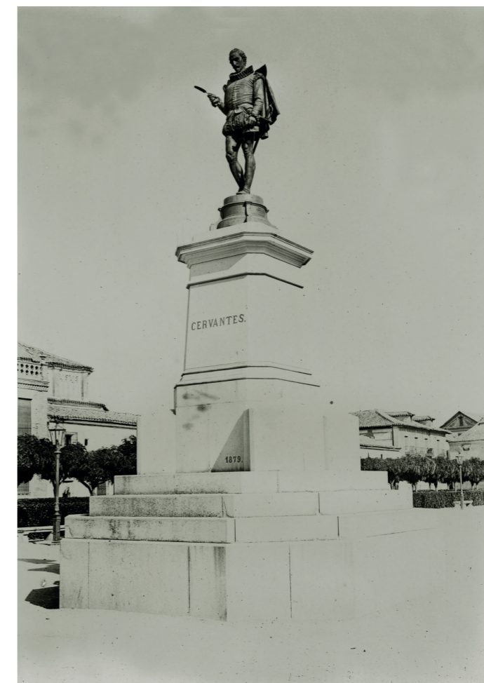
Estatua de Cervantes.