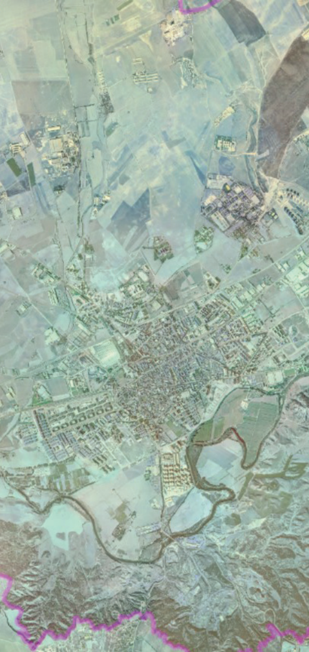
ALCALÁ DE HENARES EN 1980.