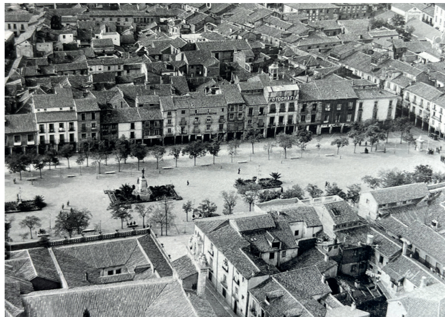
Plaza de Cervantes, 1935.