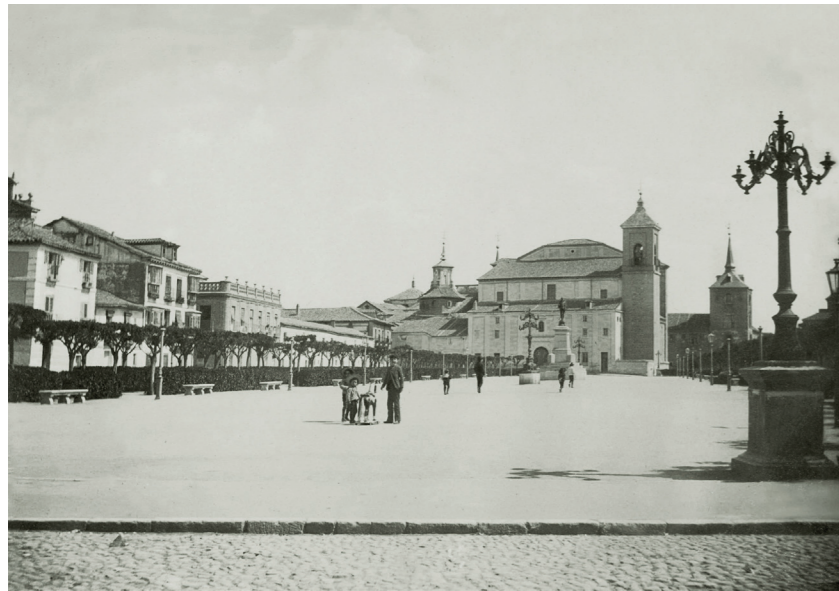
Plaza de Cervantes, 1880.