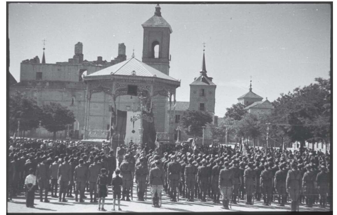
Plaza de Cervantes. Martín Santos Yubero, sin fecha. Fuente: Archivo Regional de la Comunidad de Madrid, fondo Santos Yubero.