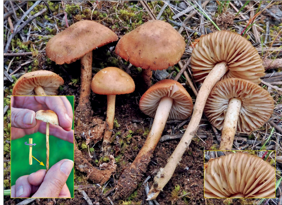
© Javier Marcos y Miguel Ángel Ribes