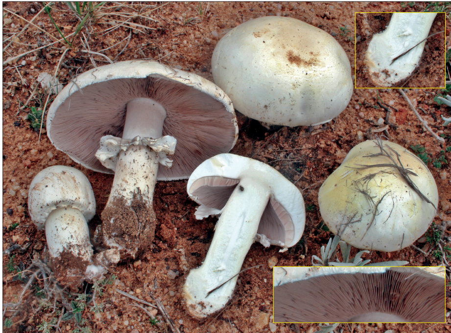
Bola de nieve, champiñón anisado