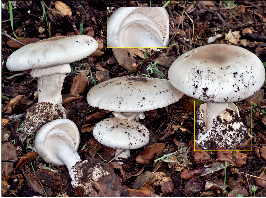
Cicuta blanca, oronja blanca