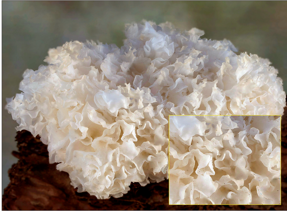
Hongo de nieve