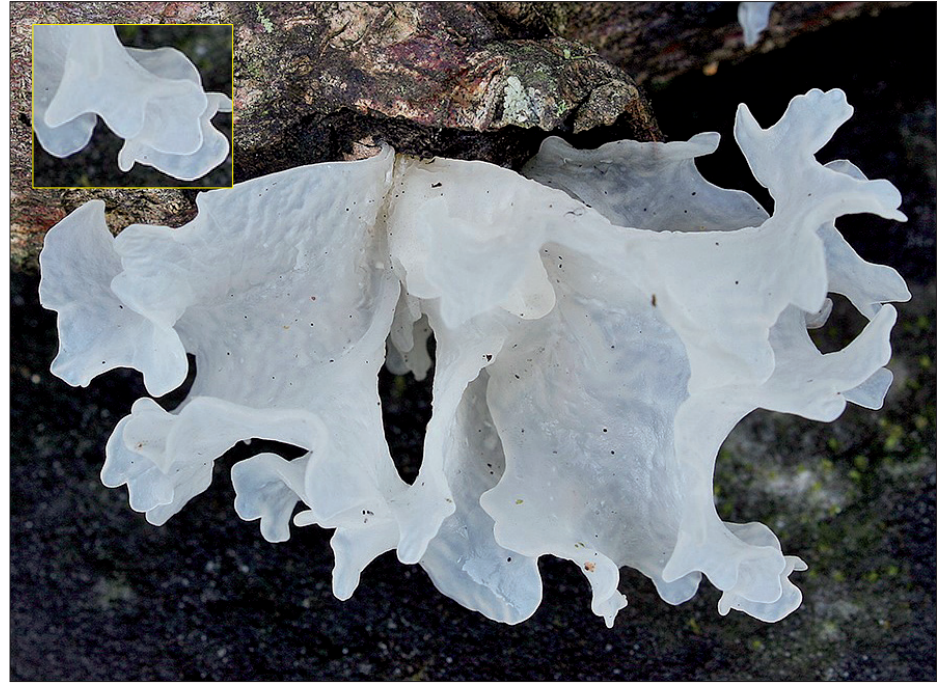
Hongo de nieve