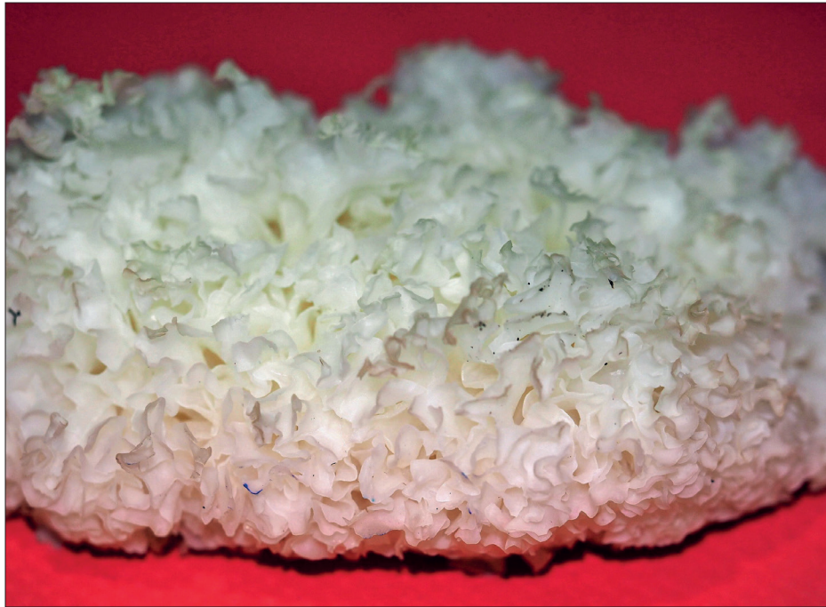
Hongo de nieve