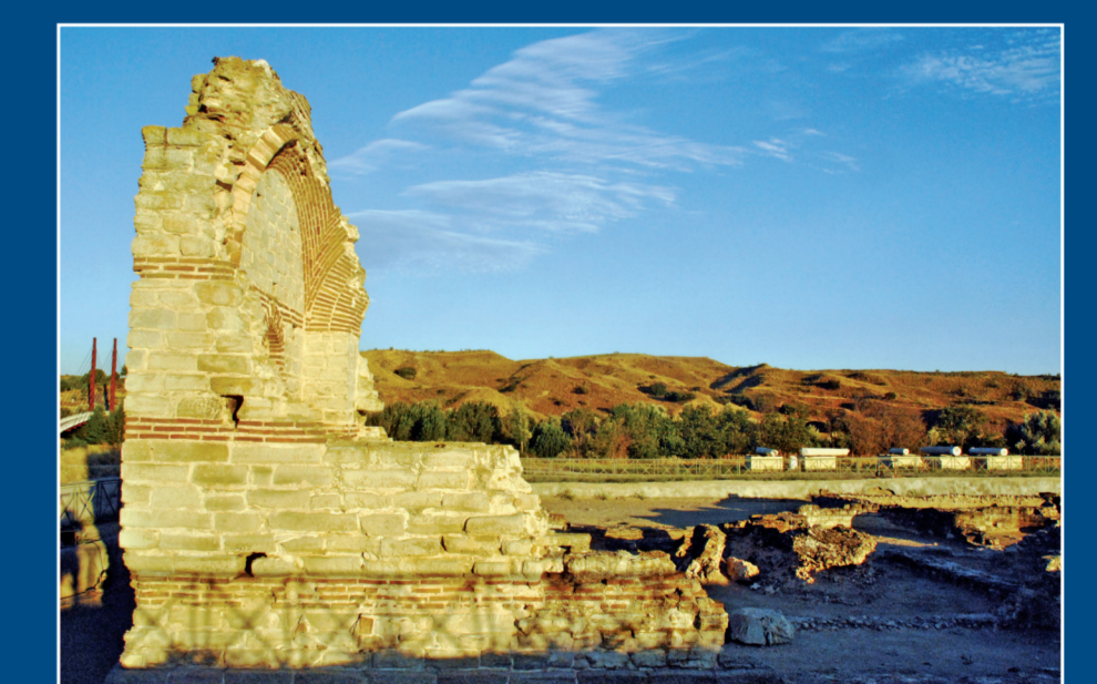
Restos de la llamada Basílica de Carranque.