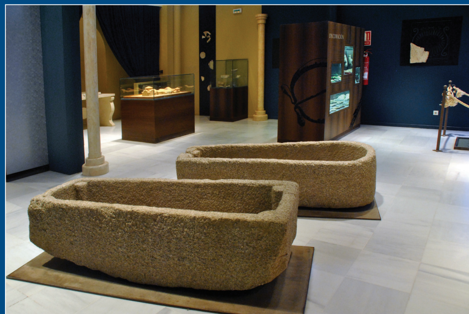
Interior del centro de interpretación.

A poca distancia de aquí, en la otra orilla del río Guadarrama, que se atraviesa por una pasarela de madera, se encuentra el Parque Arqueológico de Carranque, perteneciente a la red de parques arqueológicos de la Junta de Comunidades de Castilla la Mancha. A partir del año 1983, en el que se descubrió casualmente un mosaico al arar el terreno, se han realizado excavaciones ininterrumpidas, que han descubierto un gran conjunto monumental perteneciente fundamentalmente a la época romana.