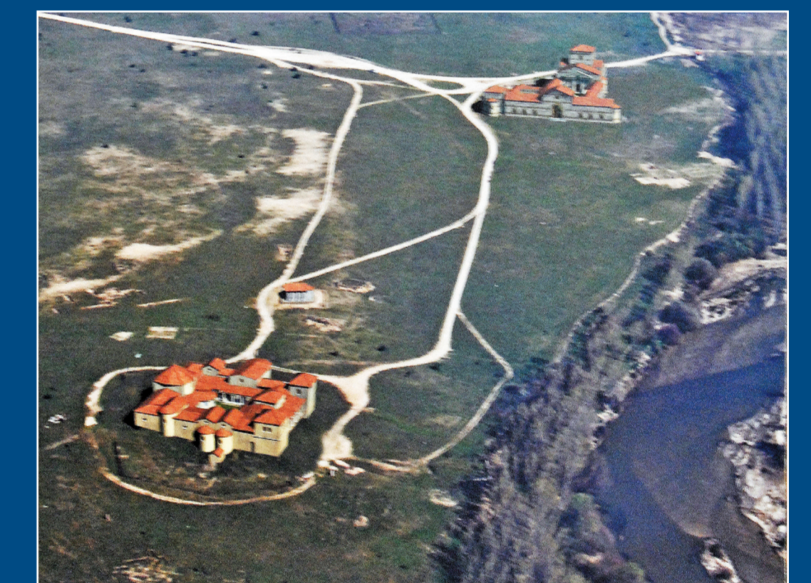
Posible aspecto del conjunto de Carranque a fines del s. IV d.C..