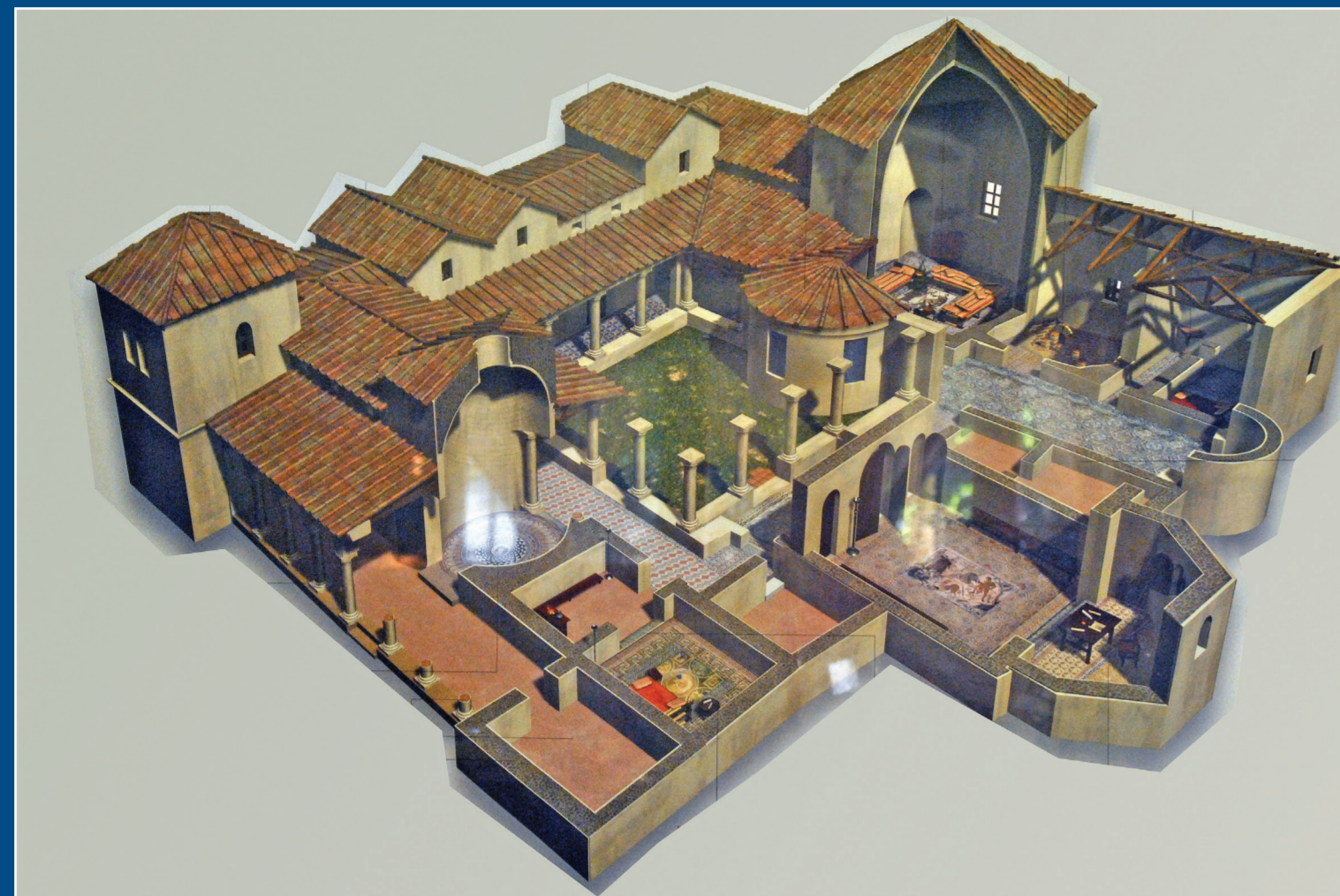
Reconstrucción de la villa de Carranque.