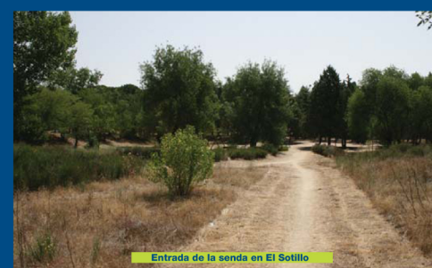
Entrada de la senda en El Sotillo

Cruzamos la calle de acceso a la urbanización El Bosque, con cuidado pues no tiene paso de cebra, y encontramos un paseo con farolas que nos conduce a una pasarela que cruza la M-501. En el otro margen, al salir de la pasarela giramos a la izquierda y tomamos un nuevo paseo que nos conduce a un antiguo puente de hierro, que cruzamos por encima entrando ya en el casco urbano de Villaviciosa.