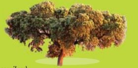
Encina ( Quercus ilex )