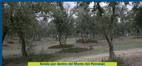
Senda por dentro del Monte del Parralejo

Giramos a la izquierda y seguimos este camino, por el que discurrirá la ruta los siguientes dos kilómetros, aunque antes, a 1,3 kilómetros encontraremos una barrera y tras cruzarla saldremos a una glorieta de un enlace de la M-501. Seguimos unos metros por el margen de esta glorieta y por donde sigue el camino, que tiene otra barrera.