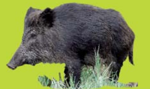
Jabalí ( Sus scrofa )