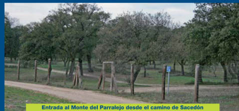
Entrada al Monte del Parralejo desde el camino de Sacedón

Seguimos ahora una senda sinuosa pero con dirección preferente al norte, y que atraviesa toda la masa forestal, en un recorrido de poco más de 1 kilómetro. Al salir del bosque cruzamos el arroyo de la Vega por un pontón, y alcanzamos un ancho camino paralelo a la autovía M-501.