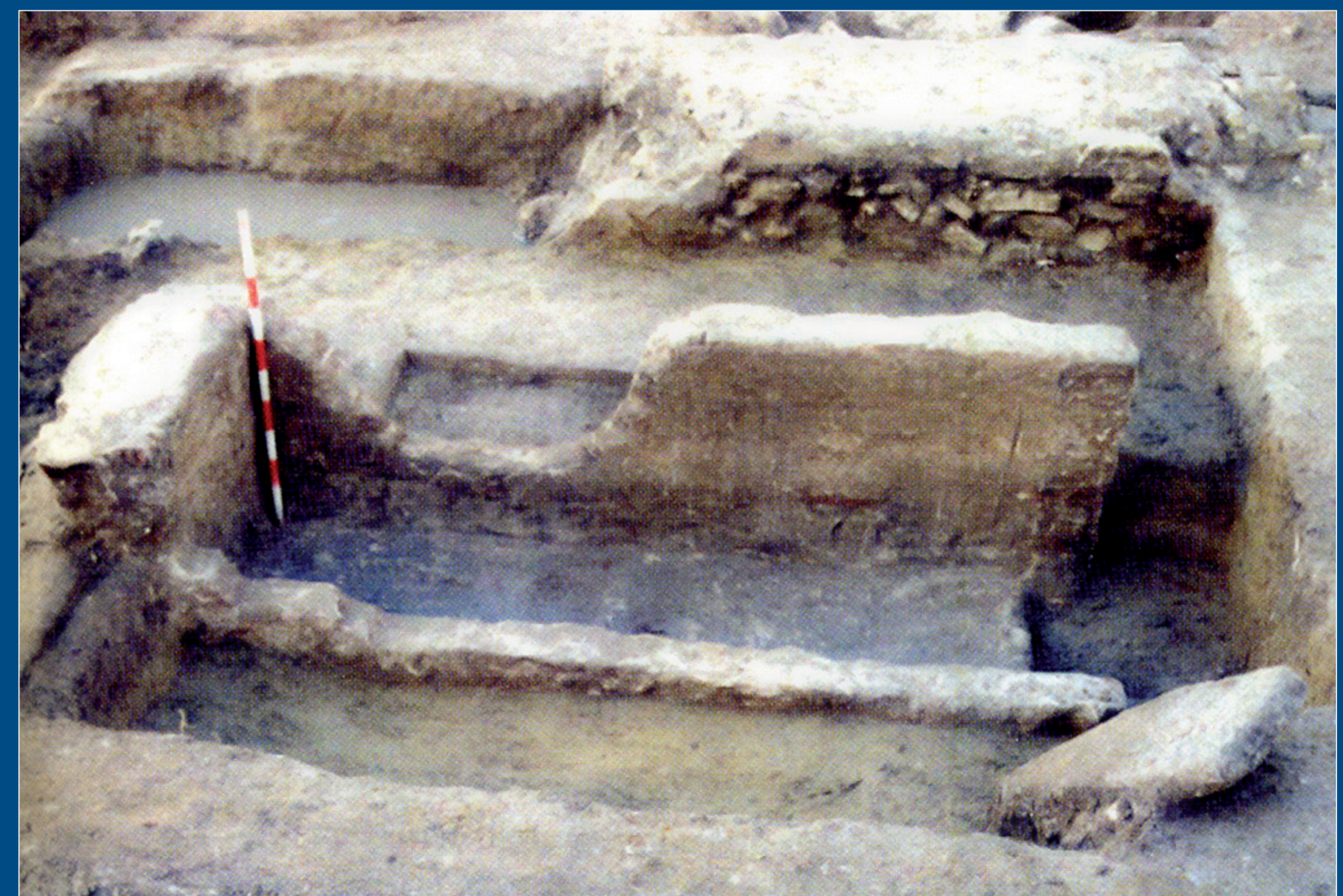
Restos del mausoleo romano