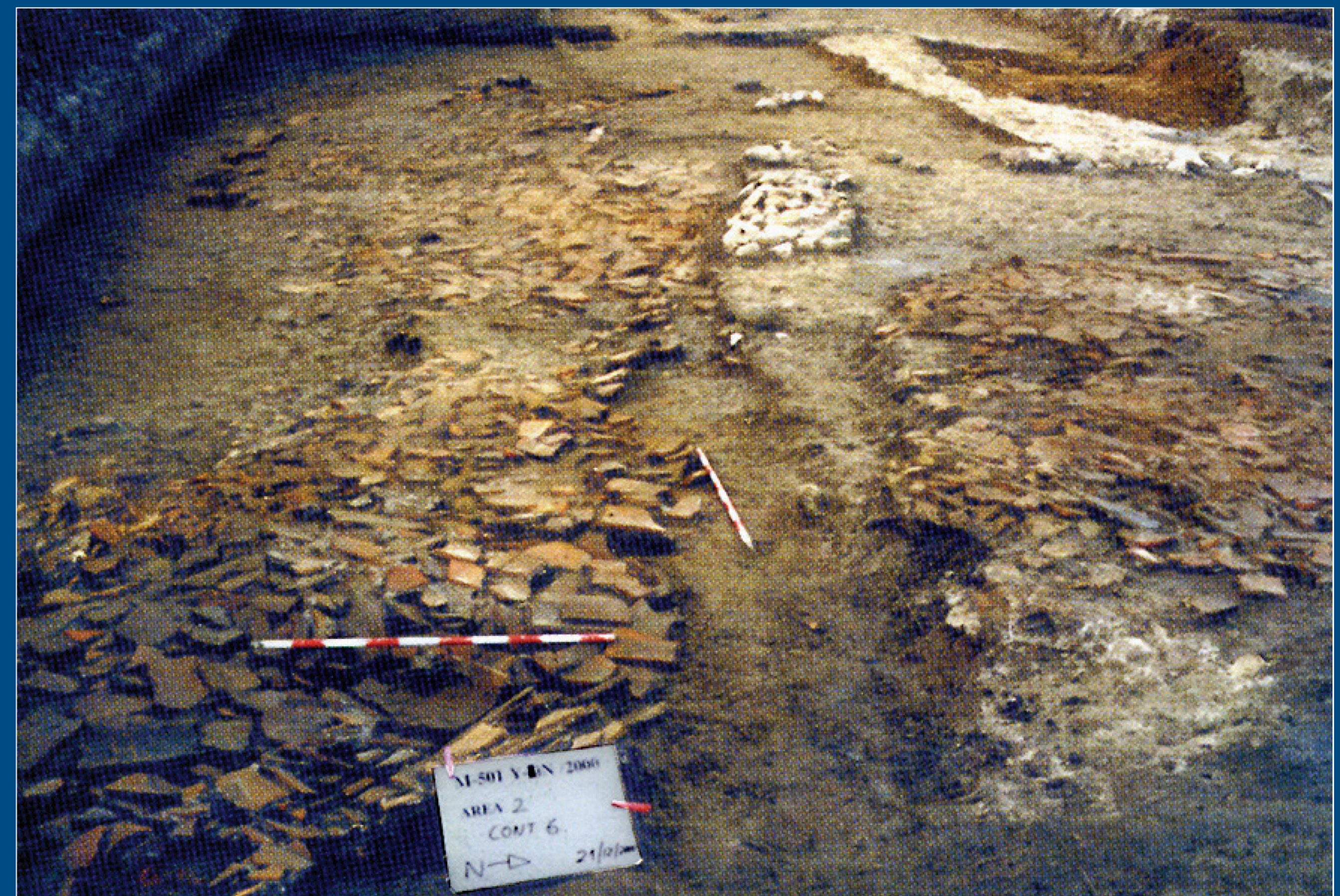
Pavimento de tejas en la necrópolis visigoda

Se excavaron y descubrieron los cimientos de un mausoleo del s. III d.C., similar al recientemente hallado en Arroyomolinos, y una veintena de inhumaciones en fosa, excavadas en el terreno natural, algunas con caja de piedra, ladrillo o teja, que datan ya de época visigoda (siglos V- VI d.C).