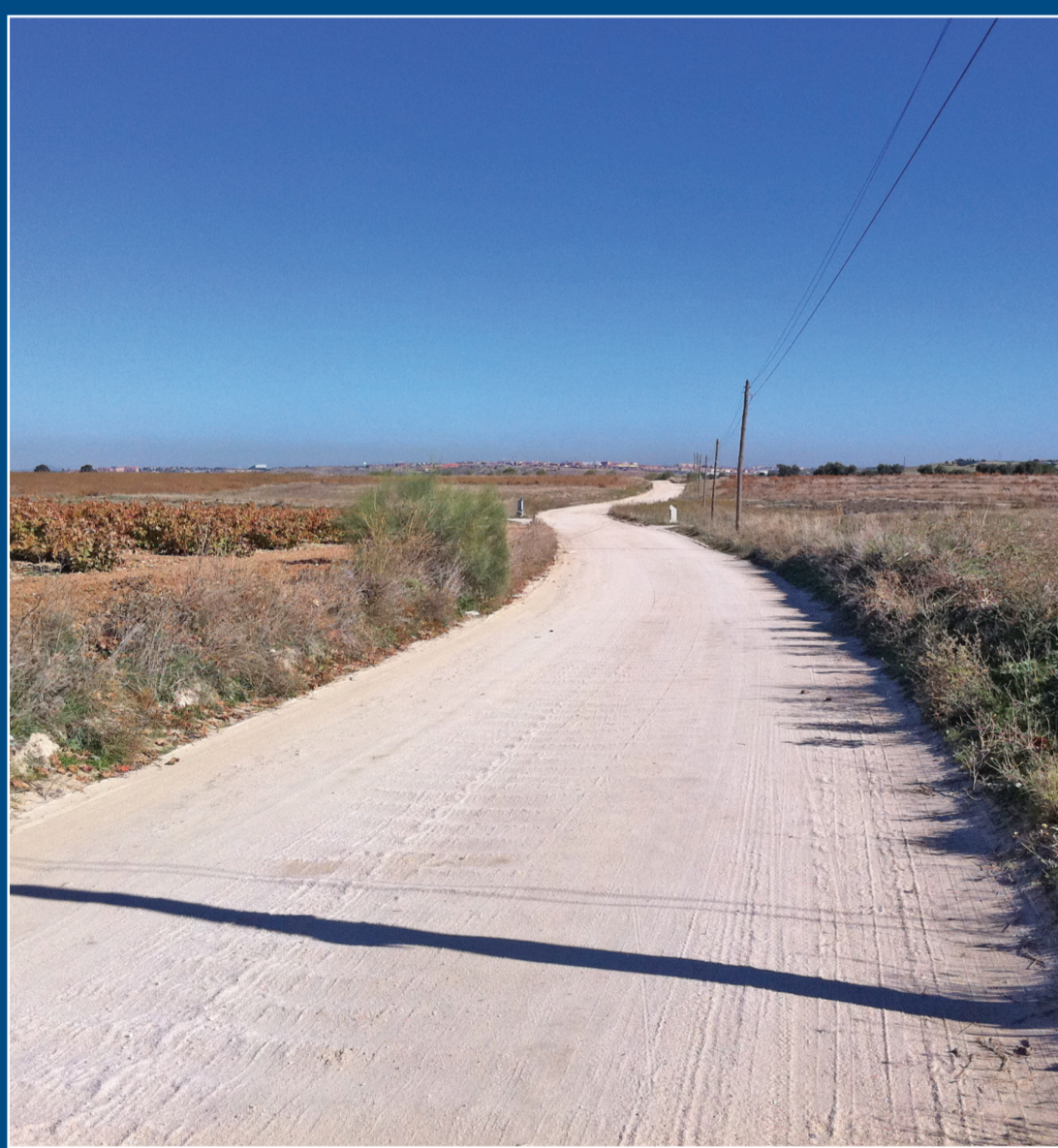
Aspecto del camino de la Zarzuela.

El espacio entre el camino y el río está jalonado de villas romanas, que dejan entre ellas un espacio medio de un km. y medio, una milla. Su situación está en relación con el riego con agua procedente del río. Son establecimientos agropecuarios – hoy los llamaríamos cortijos – que a partir del s. IV d.C. se hicieron muy corrientes y en los que habitaban los latifundistas romanos y un buen número de esclavos y colonos. Una de estas villas es el yacimiento más importante de esta zona, el de Santa María de Batres, Parque Arqueológico de Castilla-La Mancha, y más conocido por el nombre del municipio toledano al que pertenece: Carranque.