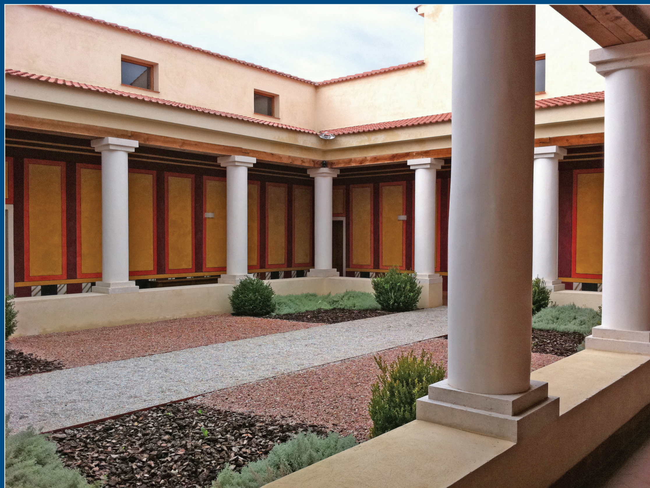
Reconstrucción del patio o peristilo de una villa (La Olmeda, Valladolid)

El valle del río Guadarrama se abre, a partir de su salida de la zona del piedemonte granítico-esquistoso de la Sierra a la altura de la urbanización Molino de la Hoz, en una fértil vega, de acusada disimetría.