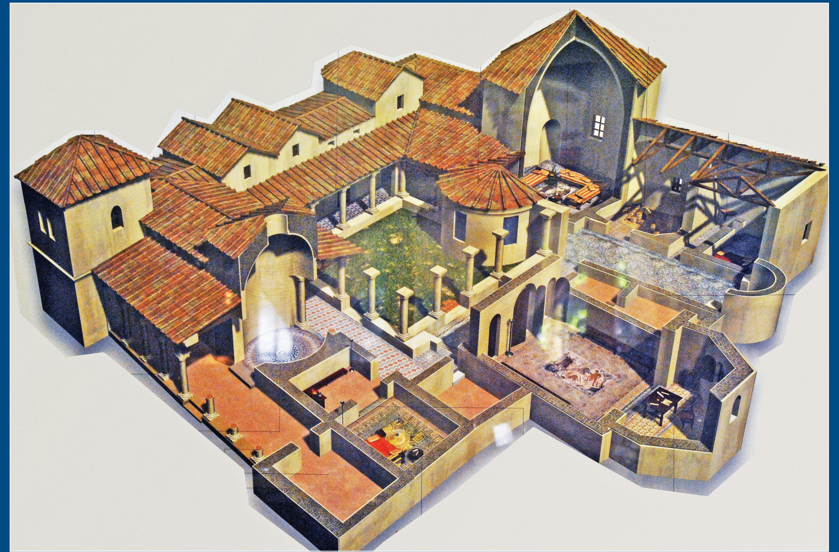
Reconstrucción de la villa de Carranque.

La orilla izquierda, con un escalón de falla levantado, no tiene espacio para el cultivo. Sobre este eskarpe de falla están los asentamientos de época carpetana y musulmana, como Olmos, Canales y Calatalifa, pero no los romanos. Estos se encuentran en la orilla derecha, mucho más tendida, junto al río. Por allí pasa el Camino de La Zarzuela, llamado Carril Toledano más al N y Cañada de la Calzadilla hacia el S, una antigua vía romana que, siguiendo el curso del Guadarrama por la primera terraza, servía de camino de servicio para las numerosas villas que jalonan el cauce del río, y de vía natural aprovechable en parte para ir de Toledo a Segovia.