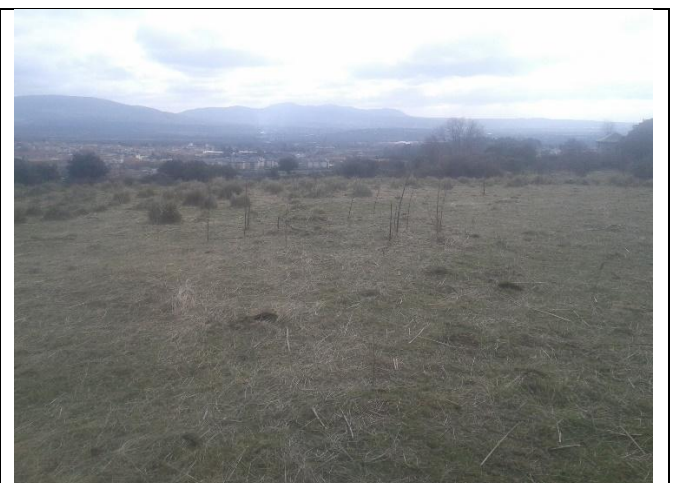
Zona a atravesar al NE de la AP-6

La autenticidad de este documento se puede comprobar en www.madrid.org/csv mediante el siguiente código seguro de verificación: 0944401517079010292282