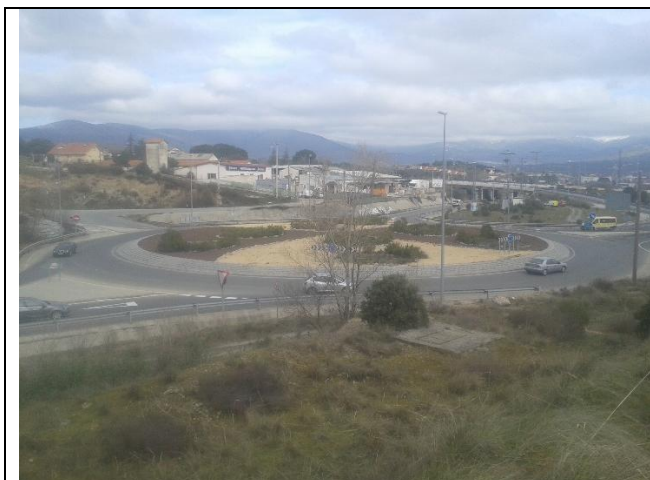
Glorieta de la M-614 y los ramales de acceso a la AP-6