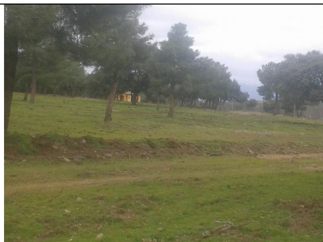
Terrenos forestales al oeste de la M-600 y al norte de la gasolinera