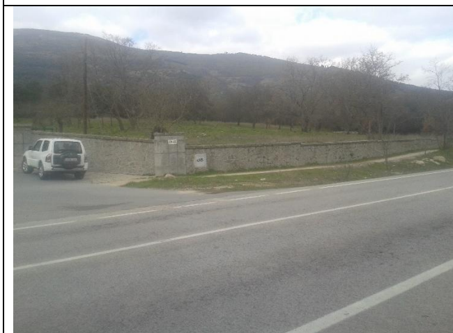
Zona prevista para el cruce al oeste de la M-600 junto al acceso a la Residencia de los Maristas