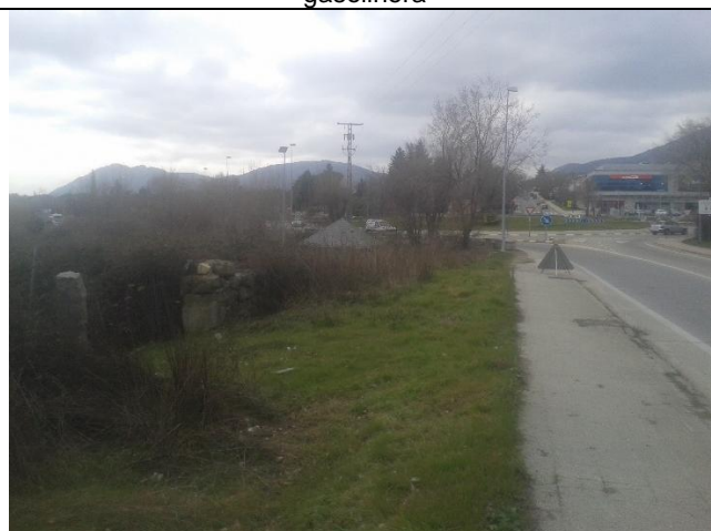
Glorieta donde acabará la conducción

La tubería irá en zanja durante todo el recorrido con un recubrimiento mínimo de tierras de 1 m y con un ancho medio de 2,3 m, pudiendo disminuirse puntualmente hasta 1,3 m para reducir afecciones. La conducción estará dotada de una serie de elementos de maniobra y control (válvulas de seccionamiento, ventosas, válvulas de desagüe, caudalímetros, etc) en puntos de cambio de pendiente, conexiones, etc, que se alojarán en cámaras o arquetas tipo. Los desagües serán ejecutados en los mismos lugares que los existentes. La zona de afección se compone de una zona de ocupación permanente durante la fase de explotación de 54.840 m 2 correspondiente a una banda de 6 m de anchura, con ensanchamientos puntuales en las zonas con arquetas o similares de más dimensión, y de una zona de ocupación temporal durante la ejecución de las obras de 182.800 m 2 correspondiente a dos bandas de unos 10 m de ancho, una a cada lado de la franja de ocupación permanente, más una serie de áreas adicionales durante la obra para casetas del personal o aperos, aparcamiento de maquinaria, etc con una extensión de 3.375 m 2 .