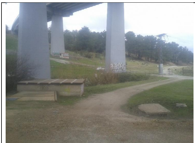
Inicio de la conducción, bajo el viaducto de la AP-6

Escorial. Sigue en paralelo y al este de la M-600 durante más de 600 m hasta llegar la rotonda de acceso al hospital, que atraviesa en hinca, para continuar en paralelo al sur de la M-600 otros 800 m y llegar a la cámara de abastecimiento pegada por el NE a la glorieta de acceso al casco de El Escorial (confluencia de la M-600 y la calle Pozas).