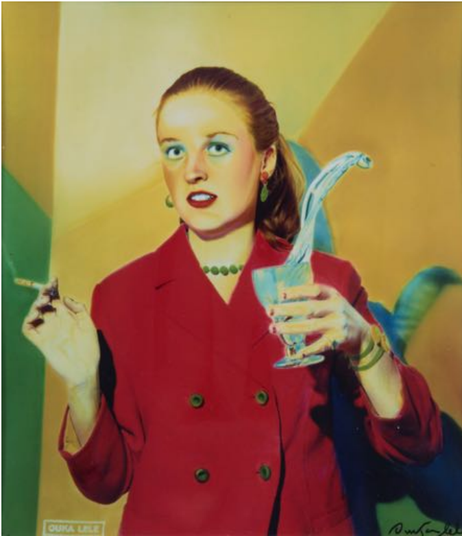
Ouka Leele. Autorretrato con vaso de agua, 1984 © VEGAP, 2023

Otra de las artistas ligadas a La Movida Madrileña va a ser Ouka Leele .