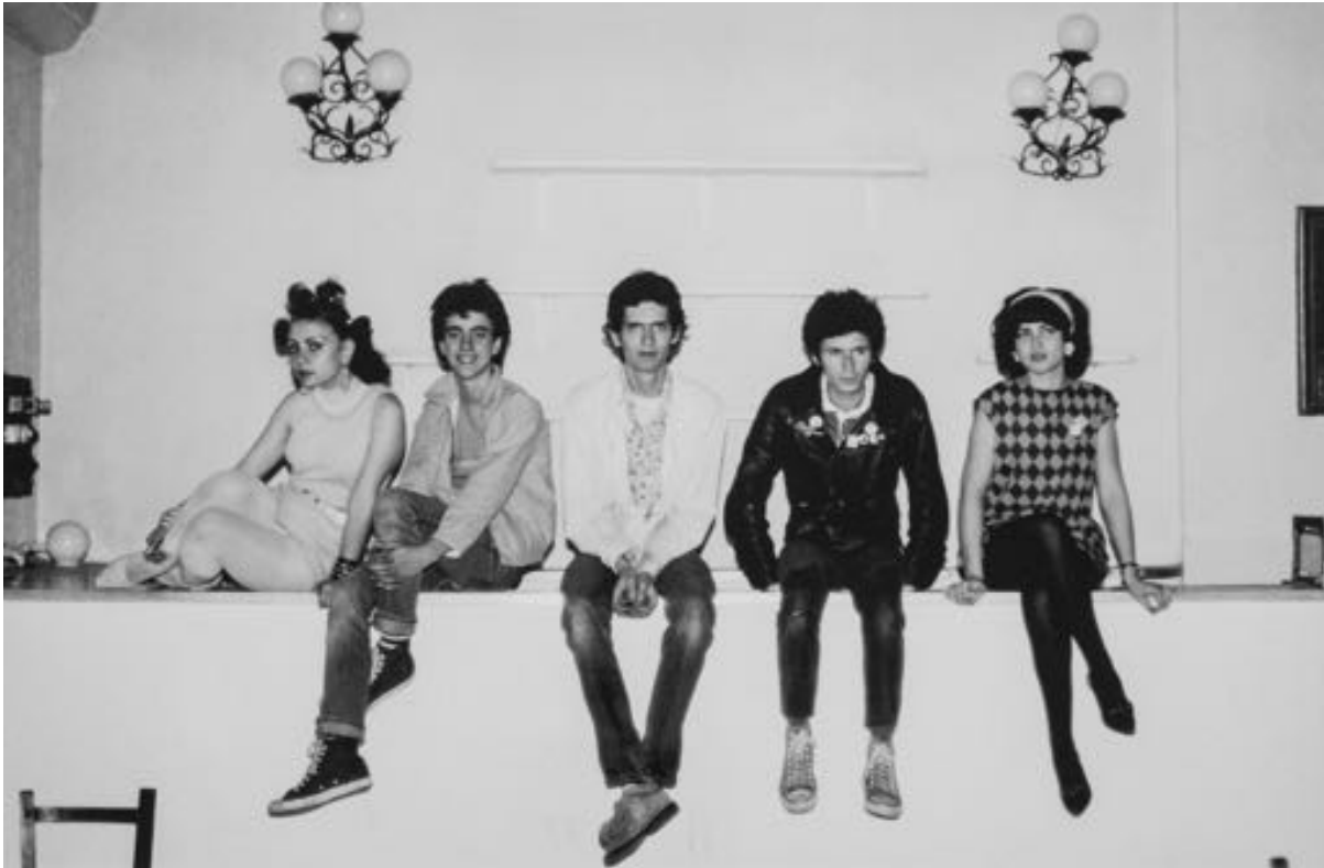
Miguel Trillo. Alaska y los Pegamoides en el Teatro Marín , 1980 © VEGAP, 2023