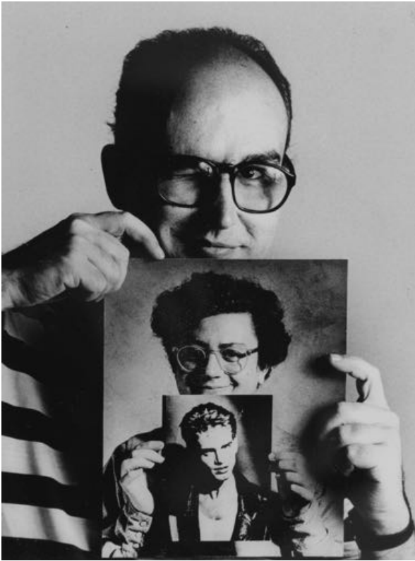
Pablo Pérez-Mínguez. Autorretrato con GPV y SAM, 1983 © VEGAP, 2023

¿Quiénes crees que son las personas retratadas? ¿A qué crees que se pueden dedicar?