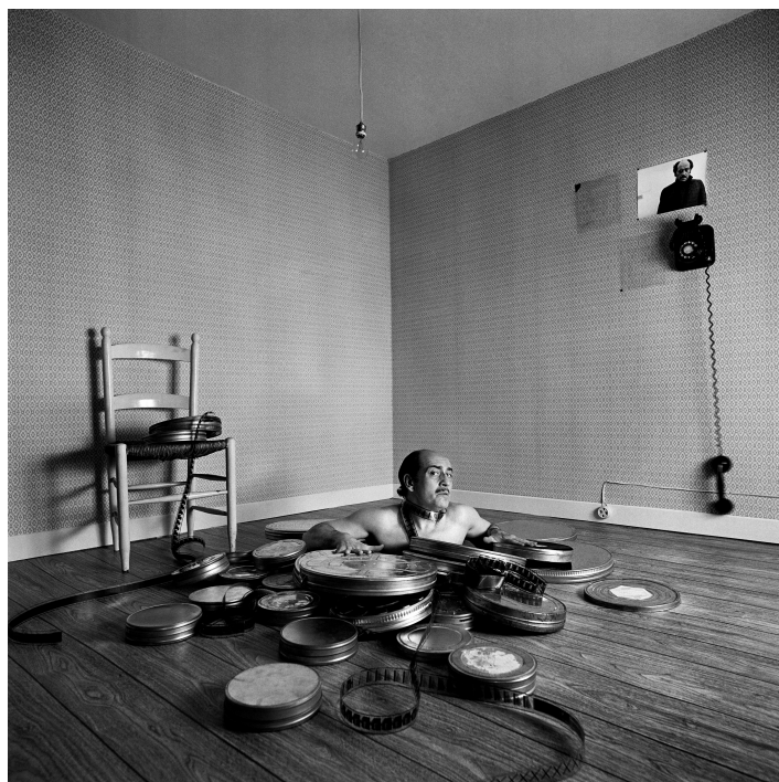
Albert Schommer. Retratos psicológicos (1969 -1973)

López Vázquez está sepultado entre cintas de películas. En la pared aparece una foto de uno de sus personajes dramáticos y además hay un teléfono descolgado que nos habla de una de sus películas famosas, La cabina .