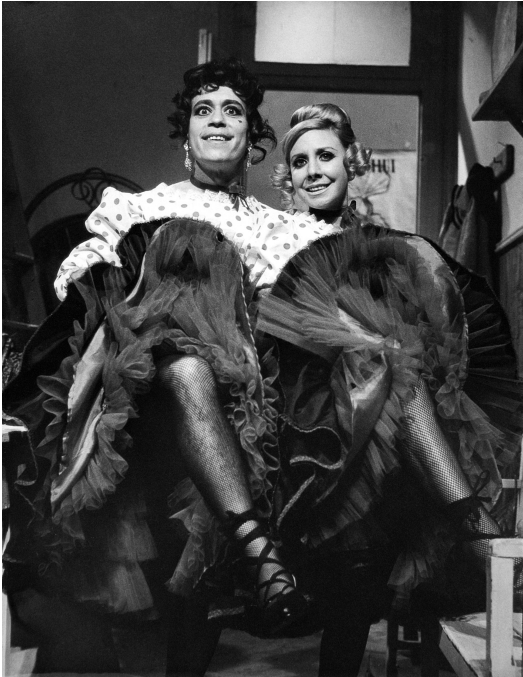
José Luis López Vázquez con Gracita Morales en Objetivo: BI-KI-NI.

La carrera de López Vázquez está directamente vinculada a la de otras grandes figuras de la cinematografía española. Actrices míticas como Gracita Morales , el guionista por antonomasia Rafael Azcona o directores como Luis García Berlanga y Carlos Saura .