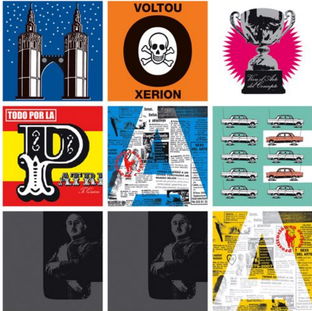
Óscar Mora. HOY PAELLA , 2005 @ VEGAP