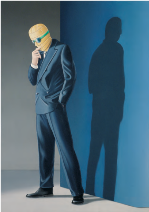
Juan Cuéllar Costa El hombre invisible (El dilema) , 1999 Óleo sobre lienzo. @VEGAP