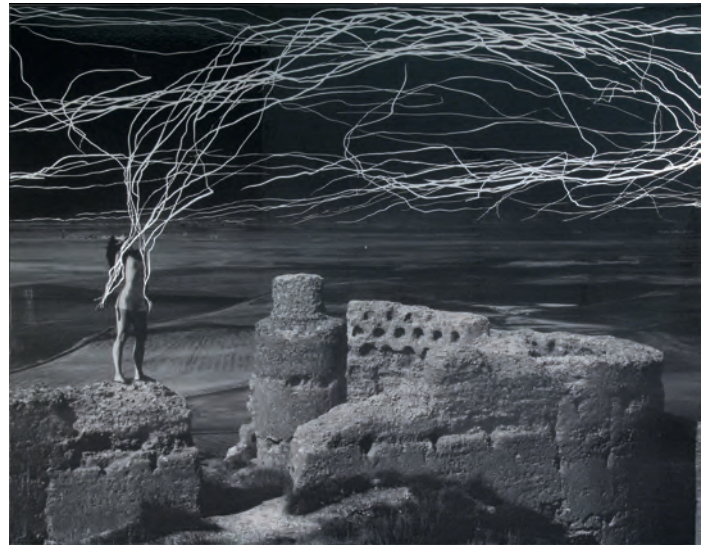
Marina Núñez Sin título (Ciencia ficción) , 2000 Offset y serigrafía

Un mundo completamente imaginado y sobre el que podríamos especular sobre si es nuestro mundo actual o un mundo futuro.