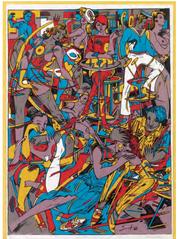
Cesepe Sin título , 1990 Serigrafía. @VEGAP

Cesepe (Carlos Sánchez Pérez) (Madrid, 1958-2018) fue uno de los artistas protagonistas de La Movida madrileña. Se inició en el mundo del cómic underground publicando historietas en las revistas del momento antes de comenzar a hacer carteles para películas y obras pictóricas.