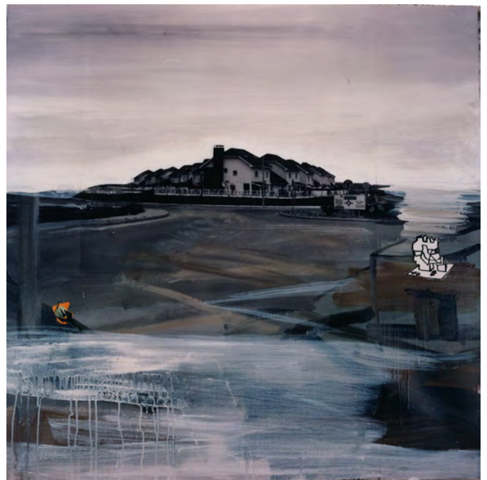
Juan Ugalde Vista , 1998 Collage y pintura sobre lienzo. @VEGAP

Una fotografía de una urbanización de lujo se fusiona con las pinceladas de pintura desubicándonos. La carretera que termina en una rotonda parece terminar en el mar. Además nos encontramos algunos elementos como un hombre sentado en un sillón naranja o una extraña escultura que colaboran en la ruptura de la realidad.